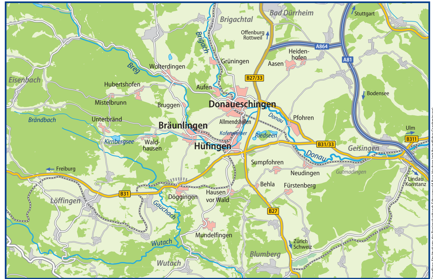
Grundlage: Strukturkarte des Regionalverbands Schwarzwald-Baar-Heuberg (mit freundlicher Genehmigung)