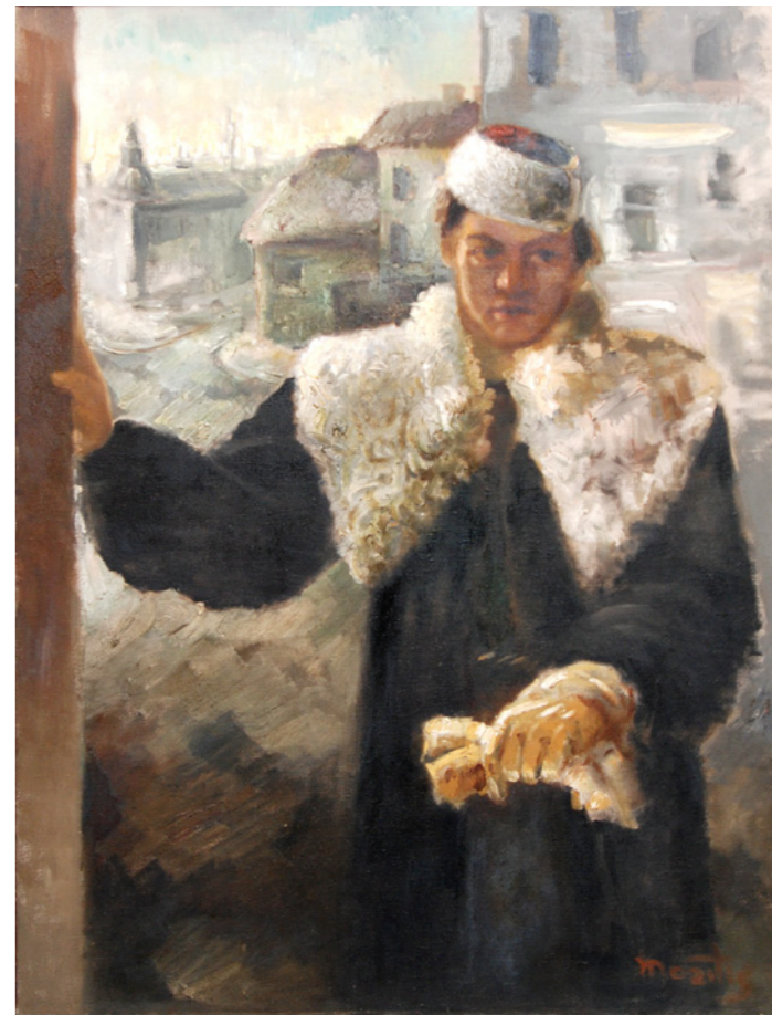
Ainas portrets 1936, audekls, eļļa, 132 x 97 cm