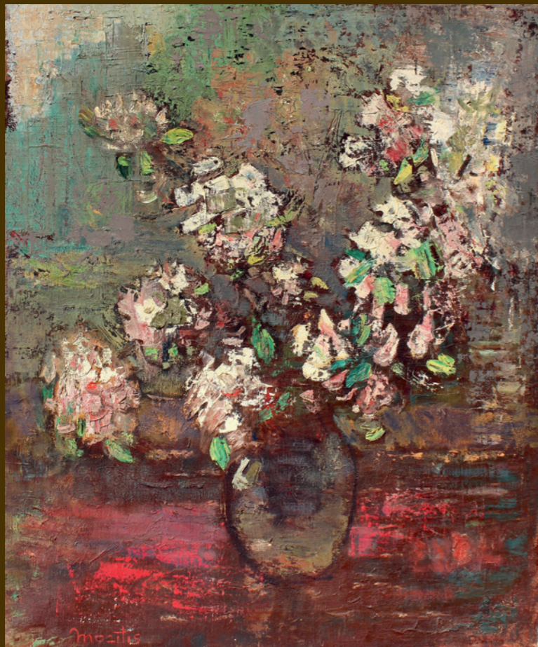
Magnolijas. Pēc 1950, audekls, eļļa, 76,5 x 63,5 cm

Atzīmējot mākslinieka un Latvijas Mākslas akadēmijas goda profesora Arnolda Mazīša 100 gadu jubileju, 2013. gada 18. jūlijā mākslinieka tuvīnieki Latvijas Mākslas akadēmijai pasniedza dāvinājumu – trīs Arnolda Mazīša gleznas: „Atis Teihmanis” (1950), „Čellists Atis Teihmanis” (ne vēlāk kā 1968) un „Magnolijas” (pēc 1950).