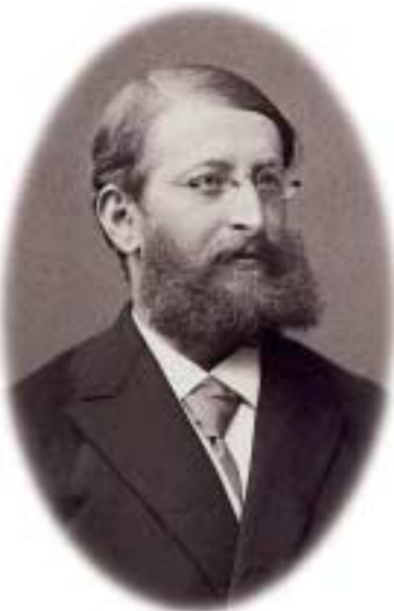
Figur 1 Max Sänger (1853–1903) var en av Tysklands mest berømte gynekologer på slutten av 1800-tallet, og han hadde nære bånd til Norge, blant andre til Nina og Edvard Grieg.

Sänger was closely linked to Norway, both professionally and personally. This paper describes his work as gynaecologist and his relationship to Norway, especially his friendship with Nina and Edvard Grieg.