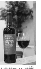
山葡萄ワイン紫雫（1本2,500円）