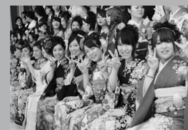
みんなでハイチーズ! (1/12 村成人式)