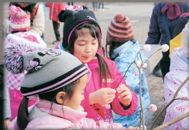
子どもたちによるミズキ団子づくり