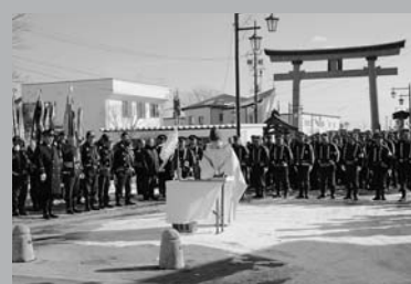
今年一年の無火災を祈願しました (1/12 村消防団出初式)