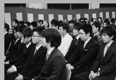
凧とした様子で話を聞く新成人 (1/12 村成人式)