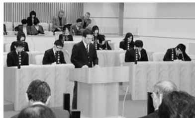
緊張した面持ちで質問に立つ高校生