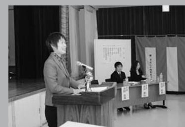
お世話になった先生から、昔のエピソードを交えながら成人としての心構えを教わりました (1/12 村成人式)