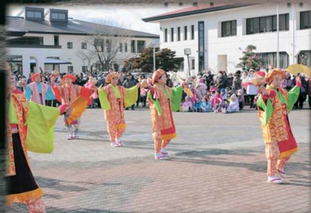
きらびやかな衣装で一年の幸福を願う大黒舞