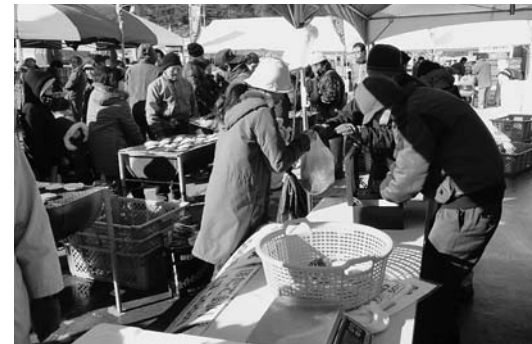
ホタテを買い求める人で会場はにぎわいました

会場では数々のホタテ料理が提供され、来場者は野田湾で育ったホタテのおいしさを味わいました。