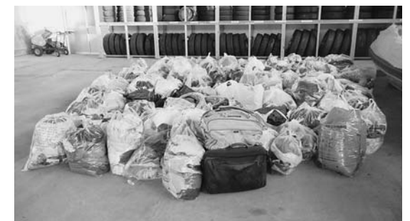
衣類回収で集められた古着など

今後も時期は未定ですが、継続して回収を行う予定です。皆様のご協力をよろしくお願い致します。