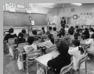
野田小学校の3年生31人は村の特産品であるしいたけについて学んだあと、おいしいしいたけ給食を食べました (12/5 しいたけ給食)