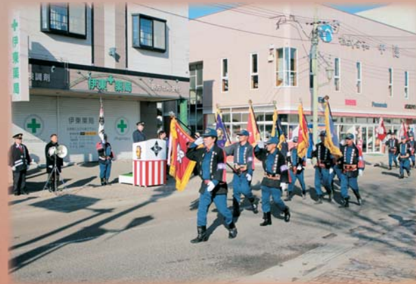
分列行進する消防団員ら

最後に城内地区で、消防団員らによる分列行進が行われ、防災を担う決意を示しました。行進の後、愛宕参道広場において、今年一年の無火災を祈願しました。