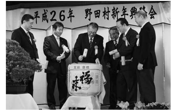
小田村長などによる鏡割り

会では復旧・復興に関する話題やさらなる村の発展について語り合い、親交を深めていました。