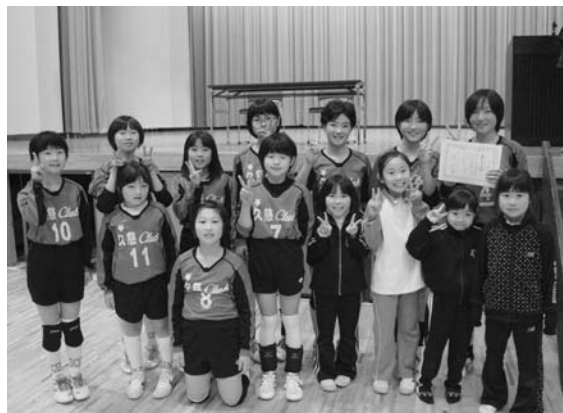
準優勝に輝いた久慈クラブのメンバー(村出身選手のみ)

12月7日、村体育館で行われた県北地区小学生バレーボール大会に、村出身選手を含む久慈バレーボールクラブスポーツ少年団が出場し、見事準優勝に輝きました。