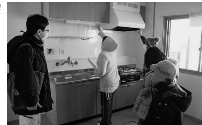
台所まわりを確認する来場者

同団地は3DKの平屋建てで、延べ床面積は67.90平方メートル。段差などを無くしたバリアフリー住宅となっています。建物は1月中に完成し、2月中には入居できるようになります。