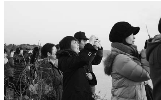
初日の出を写真に収める観光客