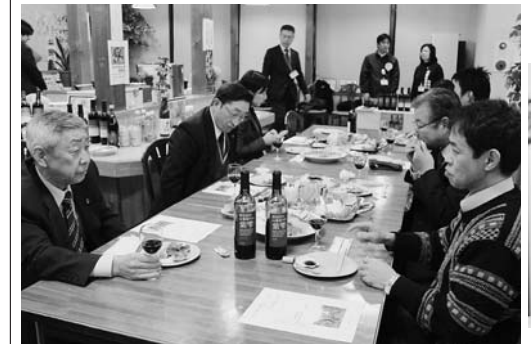
山葡萄の風味豊かな味わいが好評でした