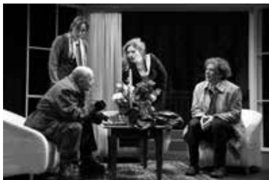
1 (327) Scena iz predstave

ULOGE: Ana – Danica MAKSIMOVIĆ, Milan – Predrag MANOJLOVIĆ, Kuma – Milica MIHAJLO-