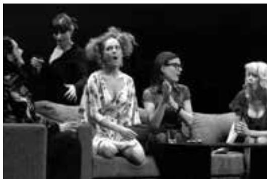
5 (514) Scena iz predstave