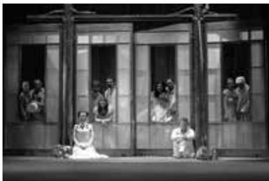
4 (451) Scena iz predstave