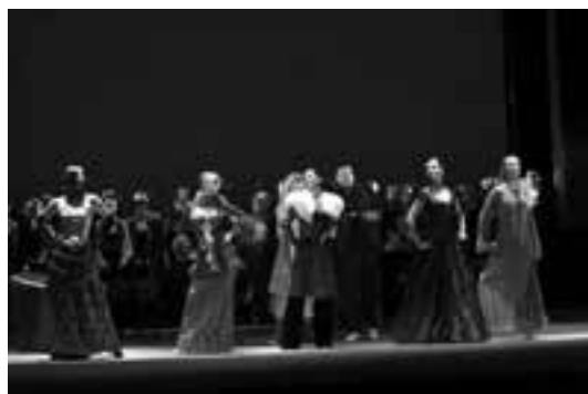
40 (131) Scena iz predstave