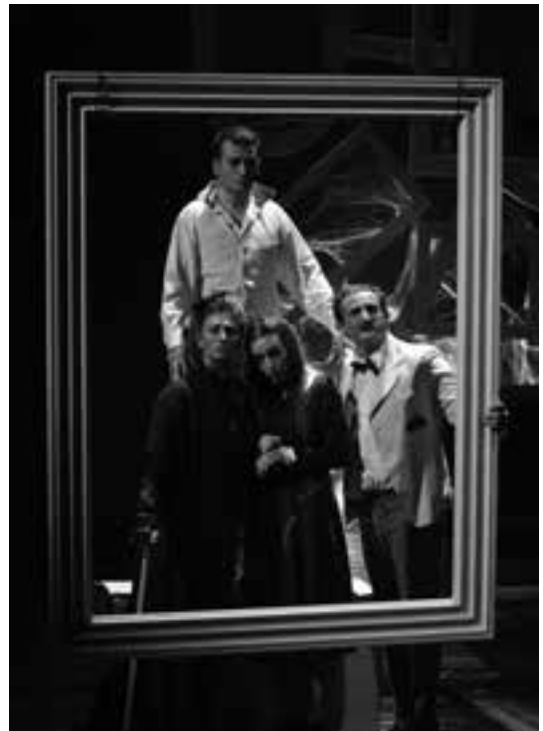
3 (547) Scena iz predstave