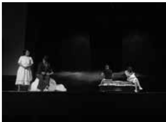
2 (601) Сцена зоз прегсїаиву

Прем. 28. 01. 2012, Руски Крстур 4 (2: Куцура – 1, Нови Сад – 1) 820