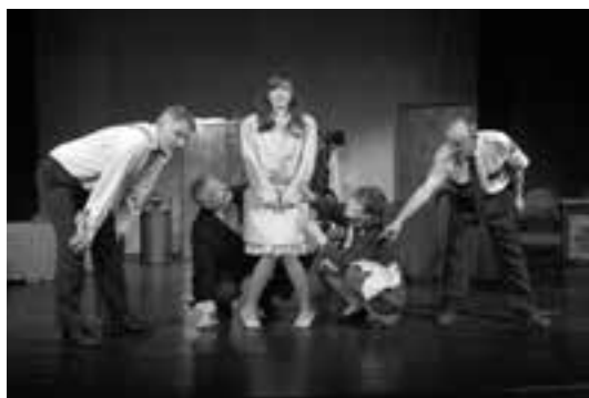
3 (739) Scena iz predstave