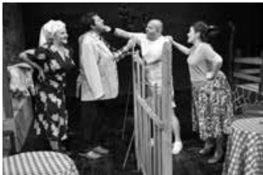
2 (593) Scena iz predstave