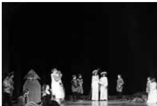
4 (620) Scena iz predstave