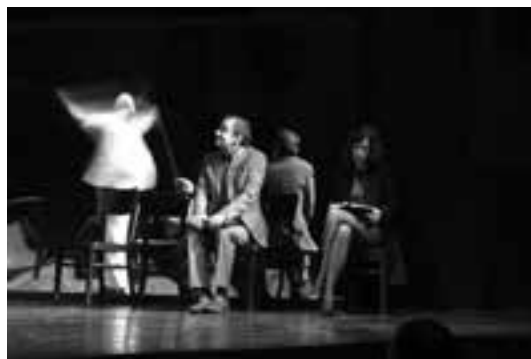
2 (2) Scena iz predstave