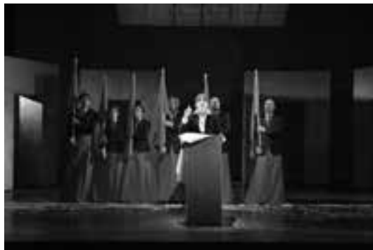
1 (192) Scena iz predstave