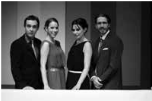
1 (1) Scena iz predstave