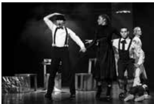
35 (579) Scena iz predstave