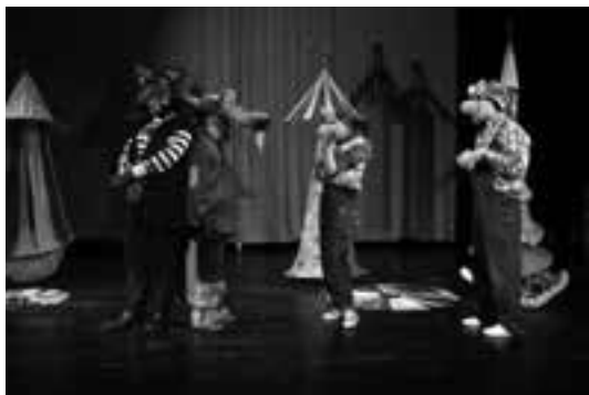
1 (485) Scena iz predstave