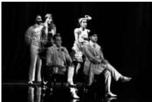
7 (99) Scena iz predstave