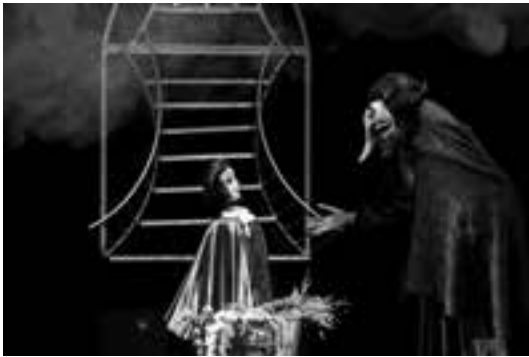
1 (463) Scena iz predstave

Pv. Velimir KOSTOV, ad. rd. Todor VALOV, sc. ks. kl. Stefka KJUUVLIJEVA i Natalija GOČEVA, am. Plamen MIRČEV MIRONA, lk. Nataša ILIĆ, pr. Dejan V. GOCIĆ, in. Ljiljana DODIĆ.