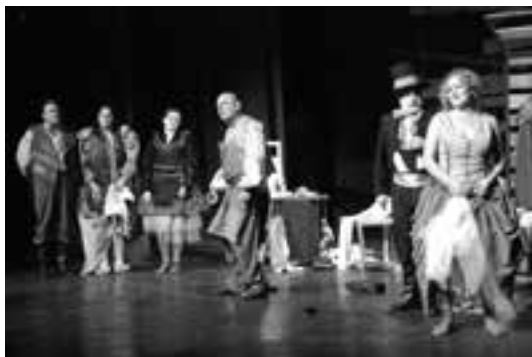
3 (594) Scena iz predstave

Prem. 02. 04. 2012, Pirot 9 (2: Jagodina – 1, Dimitrovgrad – 1) 2380