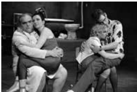
3 (784) Scena iz predstave