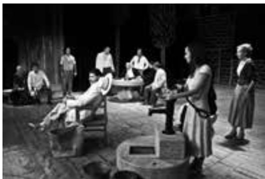
1 (92) Scena iz predstave