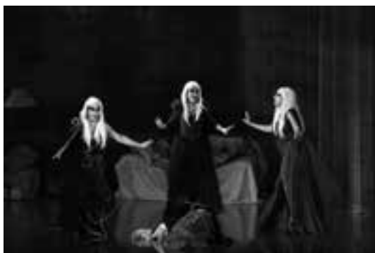
9 (172) Scena iz opere