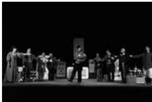
1 (600) Сцена зоз прецијаи

Prem. 18. 09. 2011, Руски Крстур 8 (6: Бикић До – 1, Шид – 1, Нови Сад – 1, Ђурђево – 1, Кула – 1, Лалић – 1) 1110