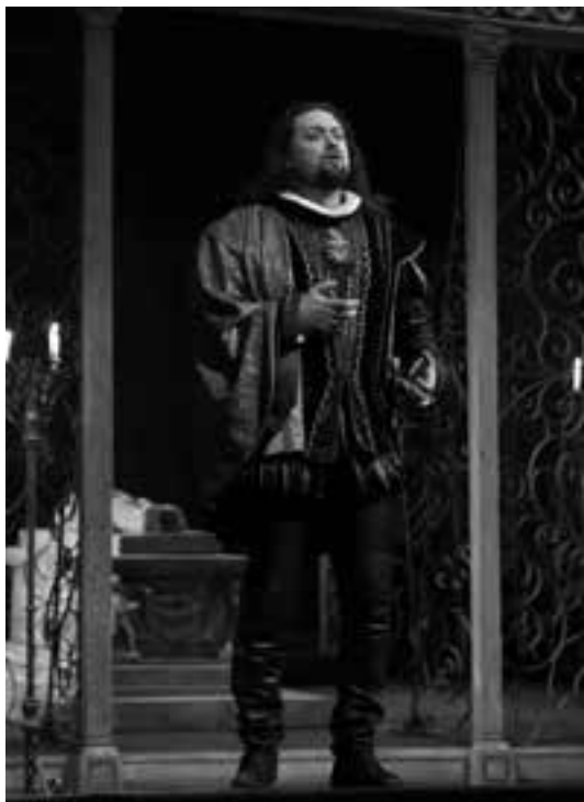
41 (132) Scena iz predstave