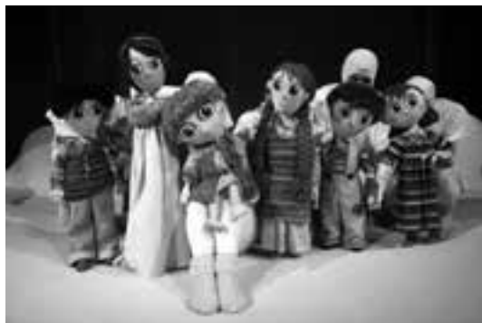
6 (787) Scena iz predstave

Rd. Slađana KILIBARDA, pr. Danilo MIHNJEVIĆ, sc. ks. kl. Blagovesta VASILEVA, am. Aleksandar KOSTIĆ, ak. Vera OBRADOVIĆ, ds. Robert LA-