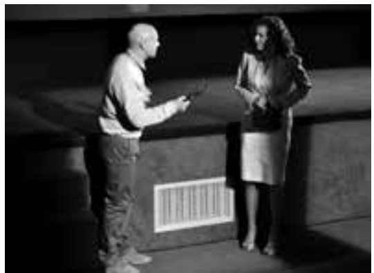
2 (588) Scena iz predstave