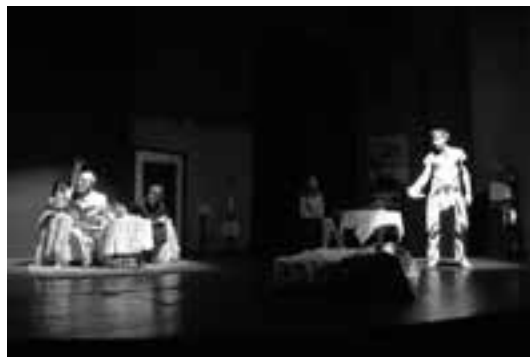
1 (737) Scena iz predstave

ULOGE: Budimir – Aleksandar MIHAJLOVIĆ, Desanka – Radmila ĐORĐEVIĆ, Ljupče – Mihael STOŠIĆ, Lenka – Tamara STOŠIĆ, Pogrebnik – Saša STOJKOVIĆ, Scenski radnik 1 – Jelena FILIPOVIĆ, Scenski radnik 2 – Danilo MIHAJLOVIĆ, Scenski radnik 3 – Saša ĐELIĆ.