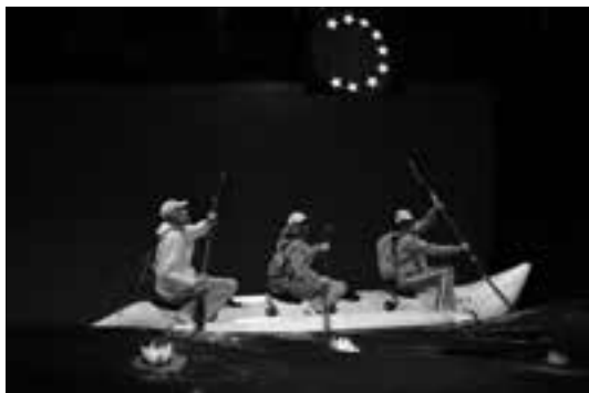
5 (690) Jelenet a darabból