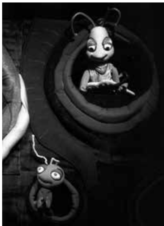
3 (512) Scena iz predstave