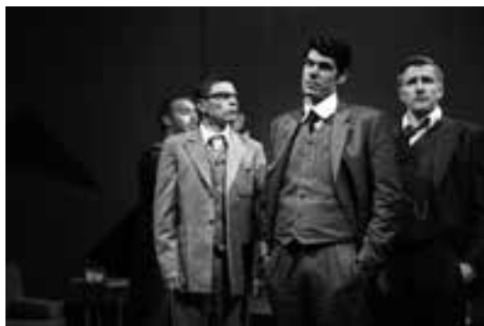
1 (35) Scena iz predstave