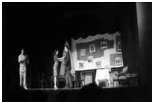
1 (617) Scena iz predstave