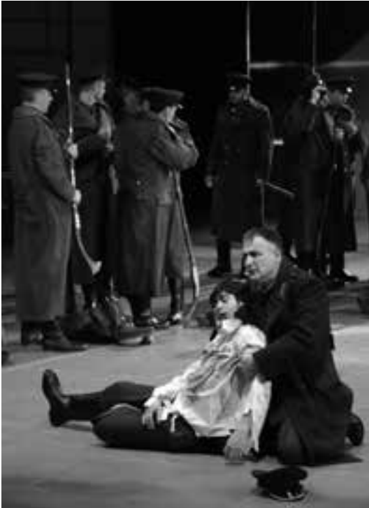
2 (546) Scena iz predstave