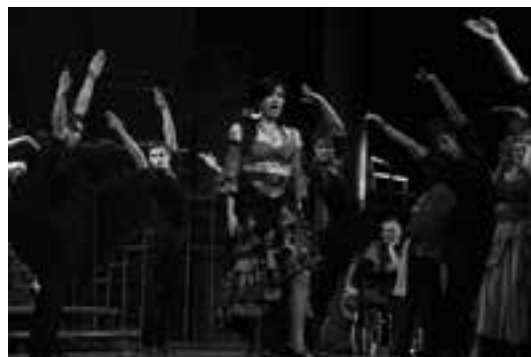
42 (133) Scena iz predstave