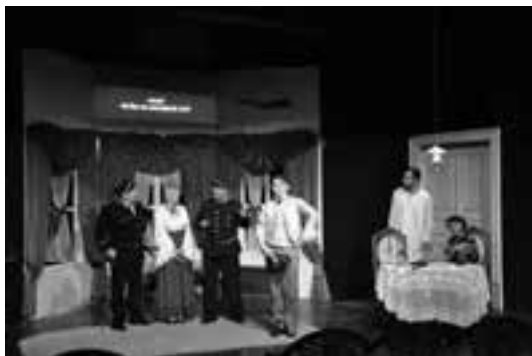
5 (760) Scenă din spectacol