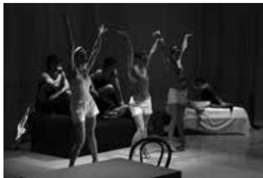
13 (176) Scena iz baleta „Sobareva metla”