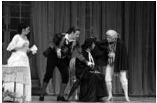
28 (572) Scena iz predstave