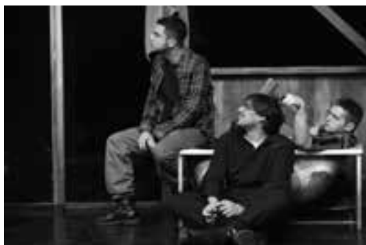
5 (5) Scena iz predstave