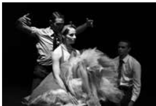
13 (176) Scena iz baleta „Balada o mesecu lutalici”

Dušan RADIĆ & Miloje MILOJEVIĆ: BALADA O MESECU LUTALICI & SOBAREVA METLA*