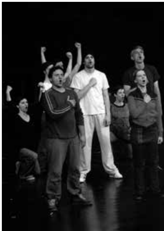
1 (27) Scena iz predstave