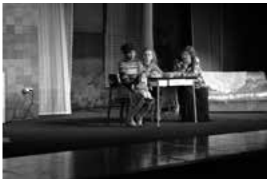
1 (306) Scena iz predstave