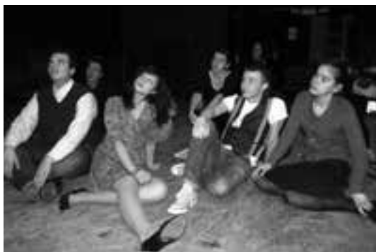
7 (497) Jelenet a darabból

Ab. TÓTH Laura és LÉPHAFT Ágnes, rd. OSZVÁR Róbert, pr. CSÁKI Beáta és SÍPOS Arnold, sc. BIACSI Endre, ks. HUSZKA Zita, im. KOVÁCS K. Áron.