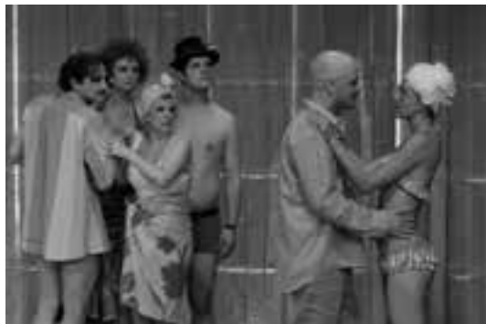
5 (549) Scena iz predstave