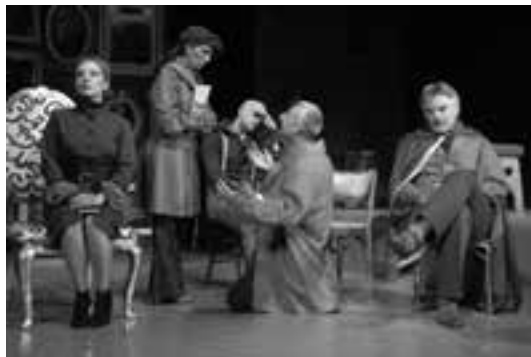
2 (738) Scena iz predstave