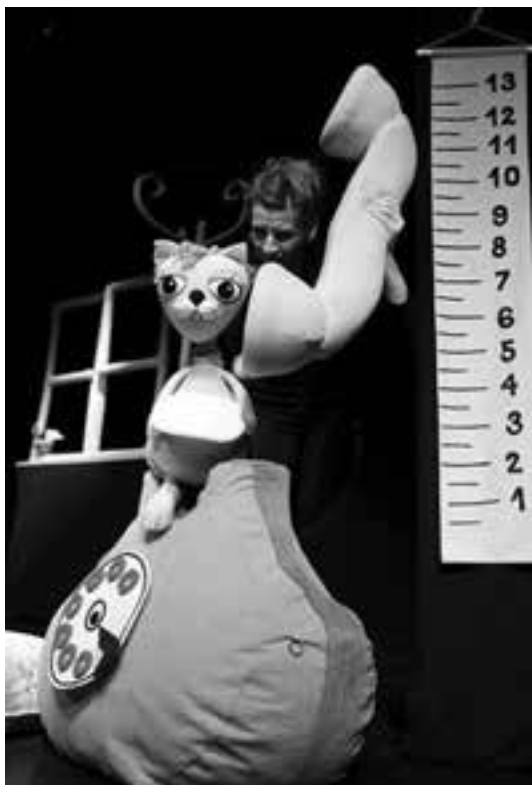
2 (388) Scena iz predstave

Prem. 14. 03. 2012, Kragujevac 14 (1: Bačka Palanka – 1) 3080