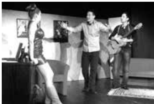
2 (284) Scena iz predstave

2 (284) ZVEZDE I TALENTI* (Marc Camoletti: Boeing-Boeing)