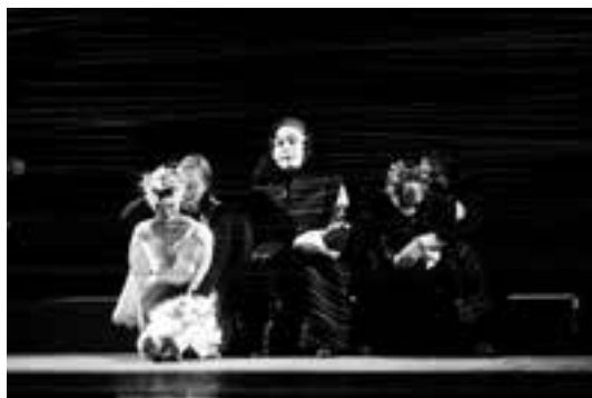
1 (631) Scena iz predstave