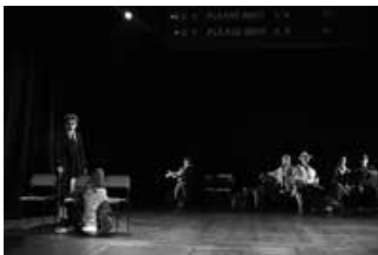
1 (807) Scéna z predstavenie

Miroslav BENKA: BYDLISKO – ABODE – OBITAVALIŠTE