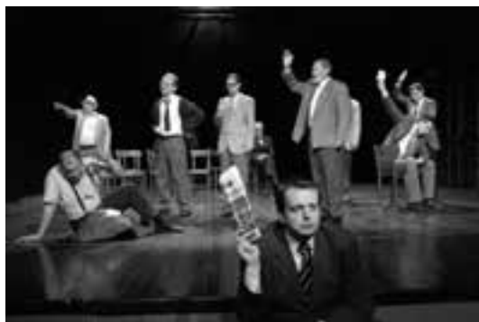
4 (379) Scena iz predstave