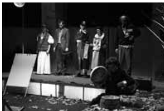
1 (586) Scena iz predstave

Prem. 13. 12. 2011, Novi Sad 6 (2: Beograd – 2) 912