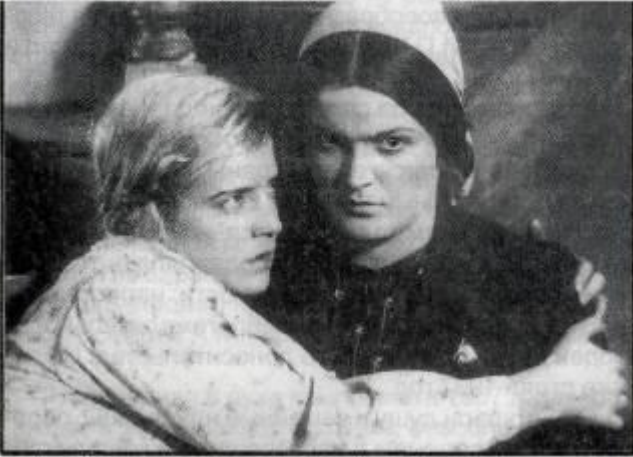
Кадр из фильма "Вражьи тропы", 1935 г.