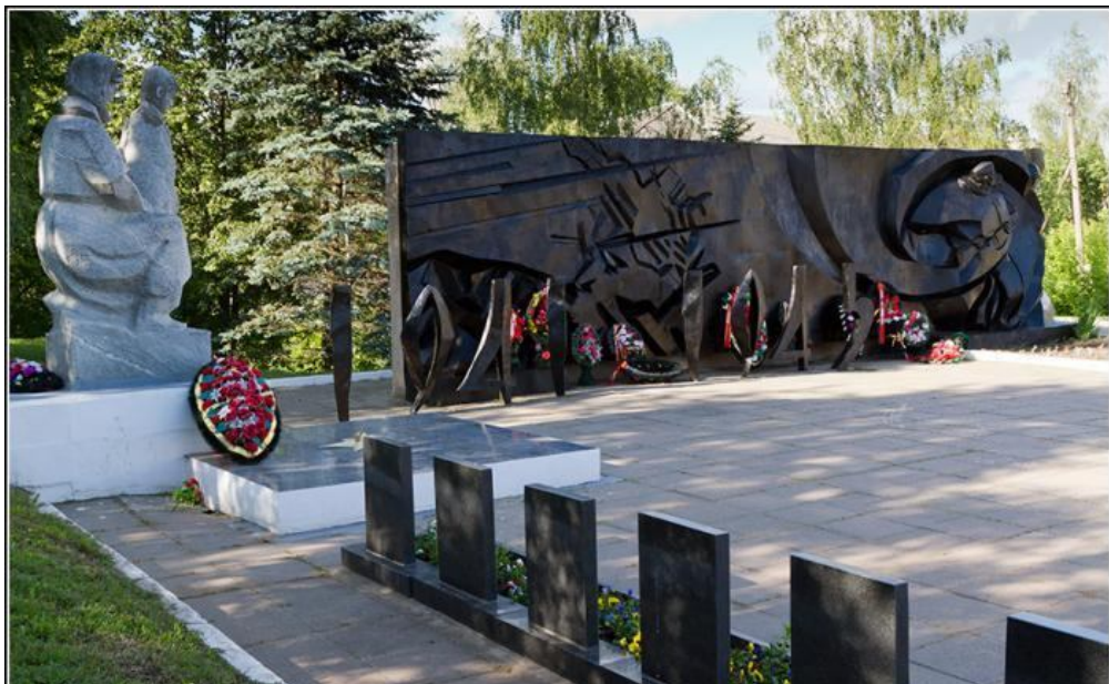
Мемориал памяти погибшим в Великой Отечественной войне в городе Кашин