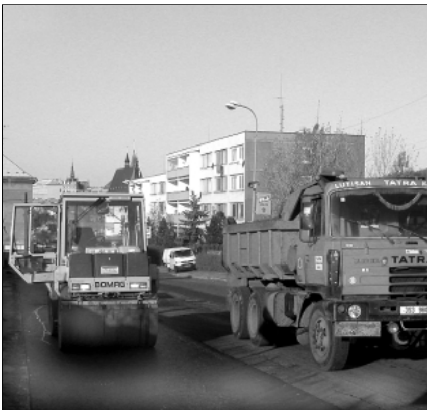
Oprava části silnice v Pražské ulici se blíží ke konci