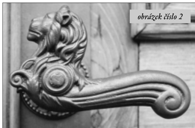
obrázek číslo 2