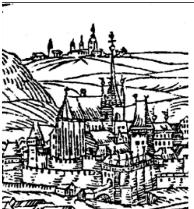
Dřevoryt Pražské brány z Diadochu Bartoloměje Paprockého z Hlabol (1602).