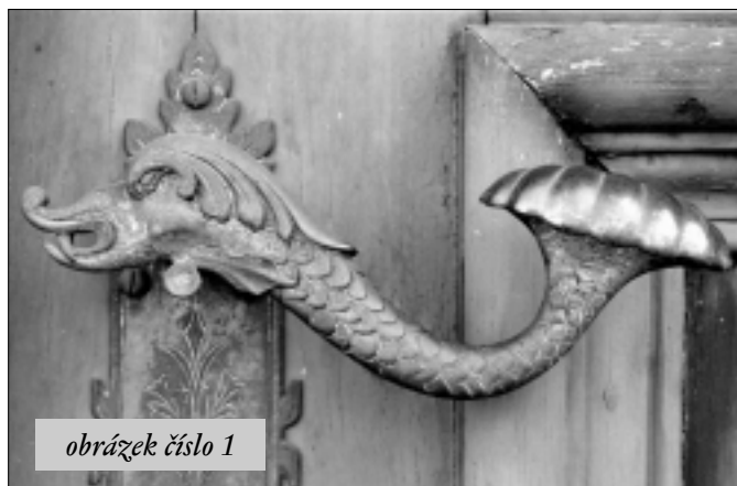
obrázek číslo 1