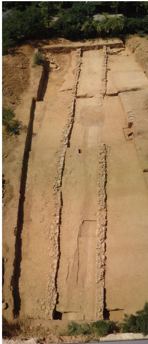
Εικ. 8. Αρχαία οδός Λιθαγωγίας. Άποψη από ΒΑ.

Το αρχαίο θέατρο των Αχαρνών (εικ. 10-11) αποκαλύφθηκε στην οδό Σαλαμίνας 21, κοντά στη διασταύρωση με την οδό Λιοσίων, σε πυκνοκατοικημένη περιοχή στο κέντρο του σημερινού δήμου, σε εκσκαφή για την ανέγερση οικοδομής. Το μεγαλύτερο τμήμα του θεάτρου, η ορχήστρα και η σκηνή βρίσκονται κάτω από το οδόστρωμα της οδού. Ο προσανατολισμός του είναι προς τα Δ.-ΒΔ. Θέατρα δεν έχουν βρεθεί σε όλους τους αρχαίους δήμους της Αττικής και δεν φαίνεται να διέθεταν όλοι αλλά μόνον οι μεγαλύτεροι και οι σπουδαιότεροι.