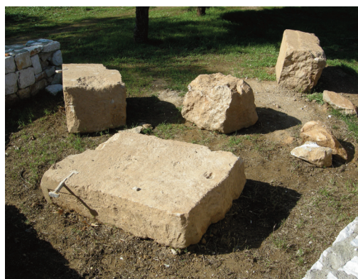
Εικ. 9. Μαραθώνας. Οι αρχαίοι δόμοι με τους μολύβδινους συνδέσμους.

Η σημασία της αποκάλυψης του θεάτρου των Αχαρνών είναι τεράστια, καθώς πέρα από το ίδιο το μνημείο, καθορίζει τη θέση του πολιτικοθρησκευτικού κέντρου του αρχαίου δήμου, το οποίο αναζητούσαν από παλιά ξένοι και