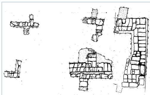
Εικ. 1. Κάτοψη ναού, πιθανώς της Αρτέμιδος Κολαινίδος.

Η μόνιμη εγκατάσταση στην περιοχή του μετέπειτα αρχαίου δήμου ανάγεται στην Αρχαιότερη Νεολιθική περίοδο (περίπου 6000 π.Χ.), αποτελούμενη από πασσαλόπηκτες ημιυπόγειες καλύβες. Κοντά τους βρέθηκε ημιυπόγεια οικία της Νεότερης Νεολιθικής (5000-4500 π.Χ.). Εξαιρετικό ενδιαφέρον παρουσιάζει ο οικισμός της πρώιμης εποχής του Χαλκού που εντοπίστηκε σε τρία σημεία, πάντα στην κορυφή υψωμάτων. Στο κέντρο περίπου του Ιππικού Κέντρου, αποκαλύφθηκε οικισμός από υπόγειους θαλάμους, λαξευμένους στο φυσικό βράχο, που χρονολογείται από την Τελική Νεολιθική (4500-3200 π.Χ.) έως και την πρωτοελλαδική II περίοδο. Δύο επίγειες οικίες ανήκουν στην τελευταία φάση κατοίκησης (2800-2300 π.Χ.). Σε λοφίσκο, σε ικανή απόσταση προς τα νοτιοδυτικά, ανασκάφηκε πρωτοελλαδικό I-II κτήριο με καμπύλη τη μία στενή πλευρά και όλμο για τη στερέωση πασσάλου. Μεμονωμένο κυκλικό ημιυπόγειο της Τελικής Νεολιθικής-πρωτοελλαδικής I περιόδου (περίπου 3500 π.Χ.)