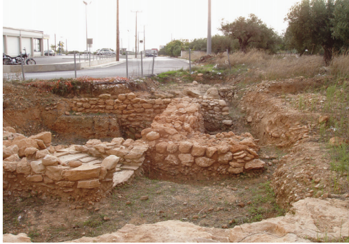
Εικ. 5. Οικόπεδο Παπαχρήστου. Οδός και ορθογώνια κτίσματα του πρωτοελλαδικού οικισμού.