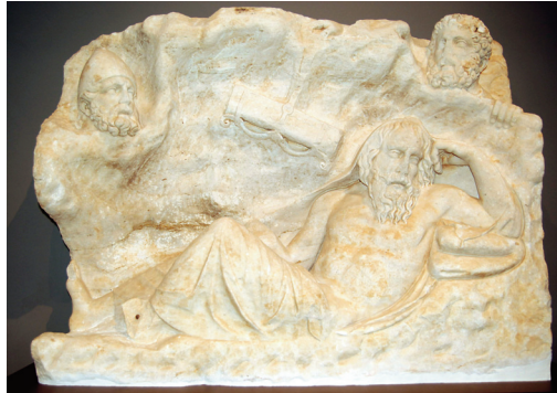
Εικ. 3. Ανάγλυφο με παράσταση του Φιλοκίτη.

τον Πausανία ναό της Αρτέμιδος Κολαινίδος (εικ. 1). Περιβόλος με μνημειώδη είσοδο και προσκίσματα ταυτίζεται με το ιερό του Φρατρίου Διός, σύμφωνα με επιγραφή που βρέθηκε σε παρακείμενο φρέαρ (εικ. 2). Το ιερό της Αφροδίτης περιελάμβανε τριμερές οικοδόμημα και κατάφυτο αϊθριο με δεξαμενή. Το όνομα μιας ιέρειας, NANNION, σώζεται σε σχιστολιθική πλάκα. Τέλος, ανασκάφηκε μικρό αγροτικό ιερό, πιθανώς της Δήμητρας. Στα δημόσια κοσμικά κτήρια κατατάσσεται επίμκτες κτηριακό συγκρότημα και μικρό στωικό κτήριο των κλασικών χρόνων. Δεύτερο στωικό κτήριο του 4ου αι. π.Χ. απέδωσε μολύβδινο σταθμίο με παράσταση χελώνας και χάλκινη αθωωτική δικαστική ψήφο. Στη δυτική πλευρά του χώρου αποκαλύφθηκαν τρεις αγροικίες ελληνιστικών χρόνων, που αποτελούσαν αυτόνομα βιοτεχνικά κέντρα και περιελάμβαναν ιδιαίτερους χώρους λατρείας. Τέλος, αξιοσημείωτο είναι υπόγειο κρηναίο οικοδόμημα των ρωμαϊκών χρόνων (2ος αι. μ.Χ.) με ενδεκάβαθμη κλίμακα καθόδου. Στο εσωτερικό του βρέθηκε επιγραφή που πιστοποιεί τη χρήση του και μαρμαρίνη ανάγλυφη πλάκα με τη σπάνια απεικόνιση του Φιλοκίτη ξαπλωμένου στη σπηλιά και πίσω του τον Οδυσσέα και τον Διομήδη, ο οποίος αφαιρεί τη φαρέτρα και τα τόξα του Ηρακλή (εικ. 3).