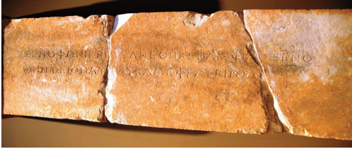
Εικ. 2. Επιγραφή σε Βάση αναθήματος: ΞΕΝΟΦΩΝ ΙΕΡΕΥΣ ΑΝΕΘΗΚΕ ΠΑΙΣ ΦΙΛΟΞΕΝΟ ΜΝΗΜΕΙΟΝ ΑΥΤΟΥ ΚΑΜΕ ΦΡΑΤΡΙΩΙ ΔΙΙ