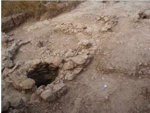
Εικ. 7. Οδός Θάνου (Ο.Τ. 293-294). Γενική άποψη του πρωτοελλαδικού οικισμού. Δεξιά, η οδός.