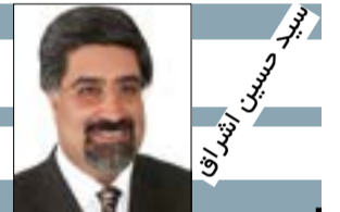
بخش بیستم و سوم

۴- تلاش برای درک و تشریح مفهوم حقوق فرهنگی، به عنوان جزو لاینفک حقوق بشر.