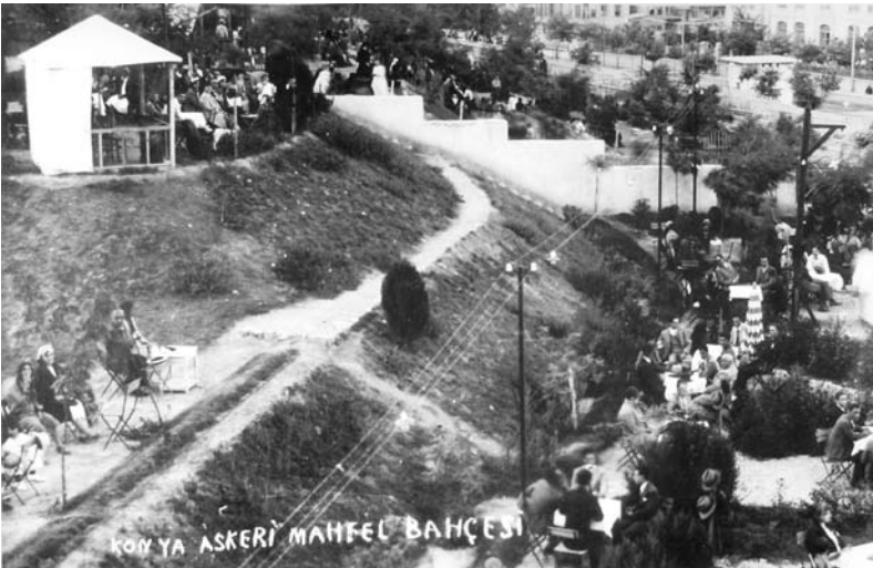
Askeri Mahfel (Orduevi)nin bahçesi (SÜSAM)

bir tenezzüh yeri değil, tarih ilminin en çok istifade ettiği bir tettebbu yeri, en faydalı bir dershanedir.” der.