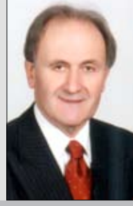
Prof. Dr. Saim Sakaoglu

B u yazıyı 17 Eylül 2009 Perşembe günü, Erdemli'nin Tömük beldesindeki tatil evimizde, yörenin en eski sitesindeki dairemizde yazıyorum. Yarın, biz Konyalıların pek kullanmadıkları bir terimle söylemek gerekirse, günlerden 'şerefe', öbür gün ise 'arefe', 20 Eylül'de ise 2009 yılının Ramazan Bayramı'nı idrak edeceğiz.