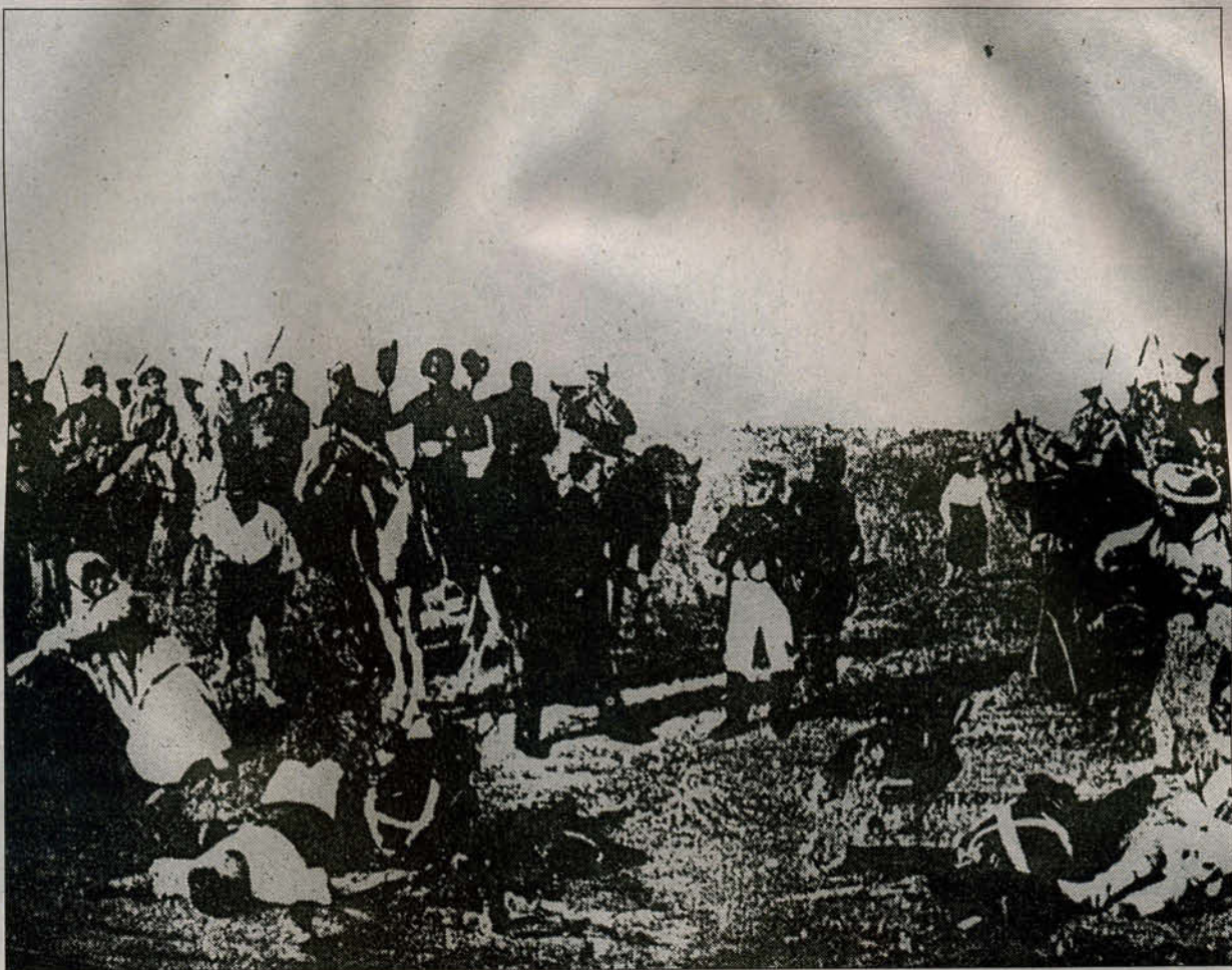
Rendición de posadas en la Batalla de Las Piedras

podamos disfrutar de nuestros derechos y acabar con la esclavitud y la miseria. ¡Compañeros, paisanos, adelante! Y que nadie tema porque la patria agradecerá sus esfuerzos y un día descansaremos todos de nuestras fatigas en una gran familia unida y victoriosa. ¡Paisanos amigos, VIVA LA PATRIA!