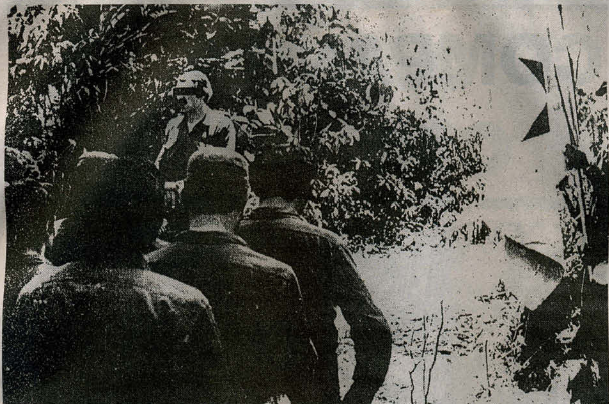
Parte de la compañía de Monte durante una marcha