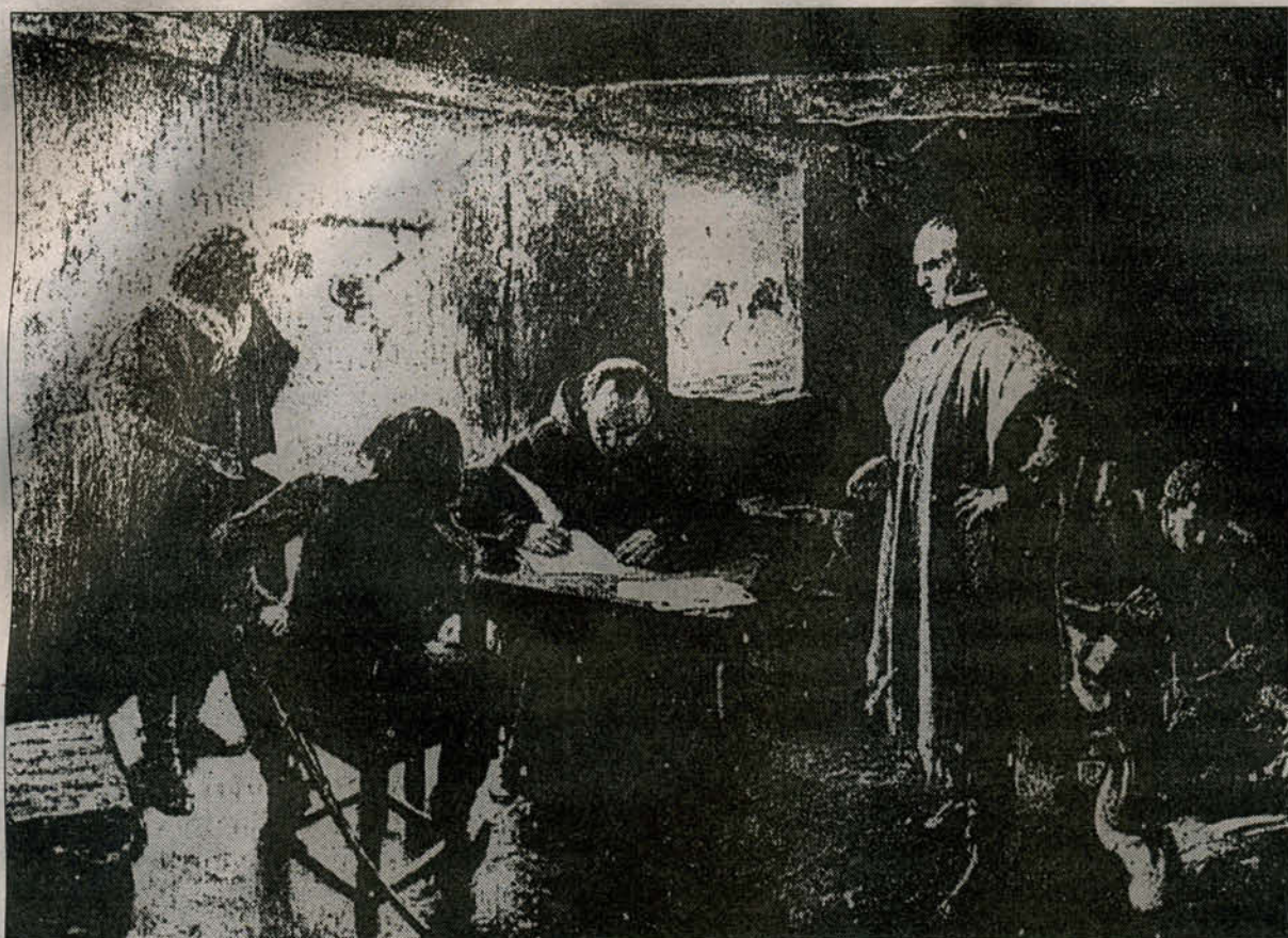
Artigas dictando instrucciones para las tropas.

sudeste del pueblo. Posadas —el jefe español— ha tratado de dejar libre la ruta a Montevideo, según la suerte de la acción.