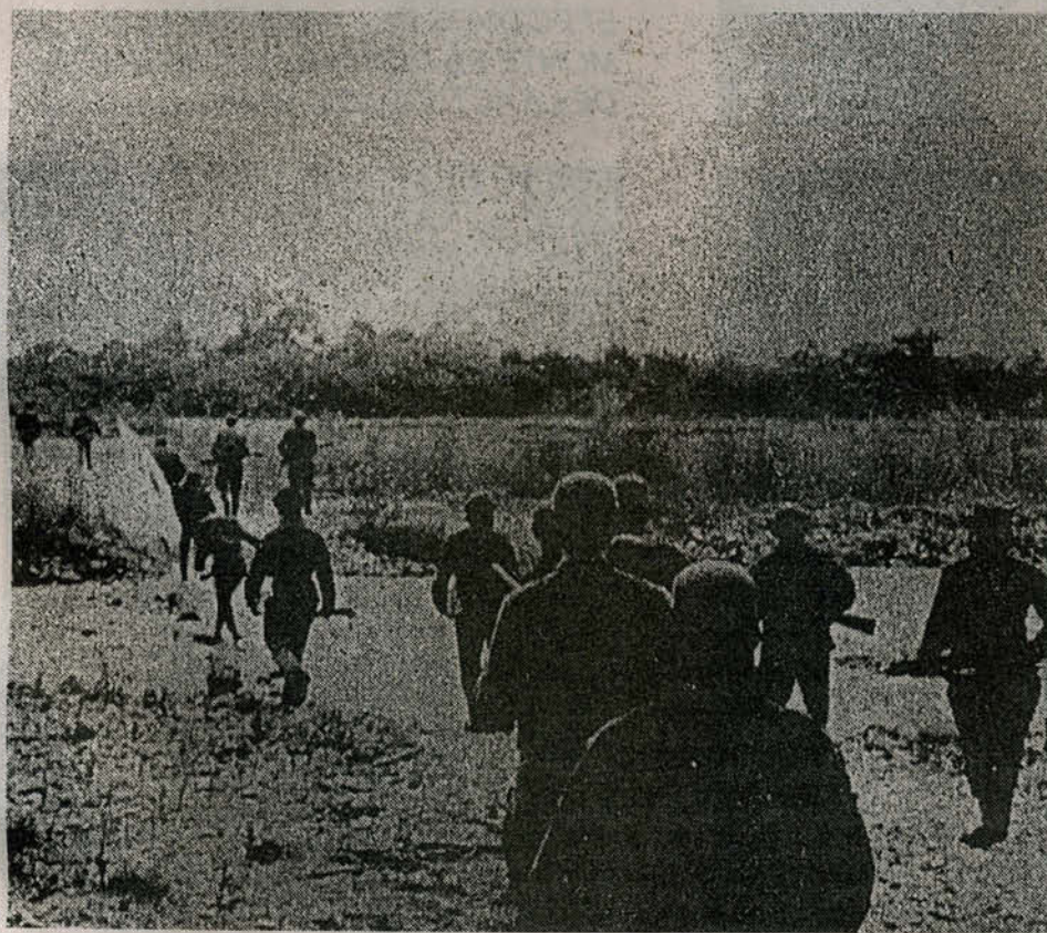
Arriba, una formación