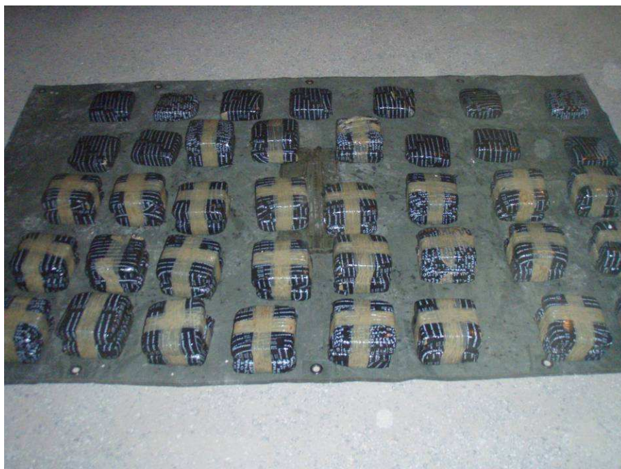
VEHÍCULO Y ENERVANTE ASEGURADOS.