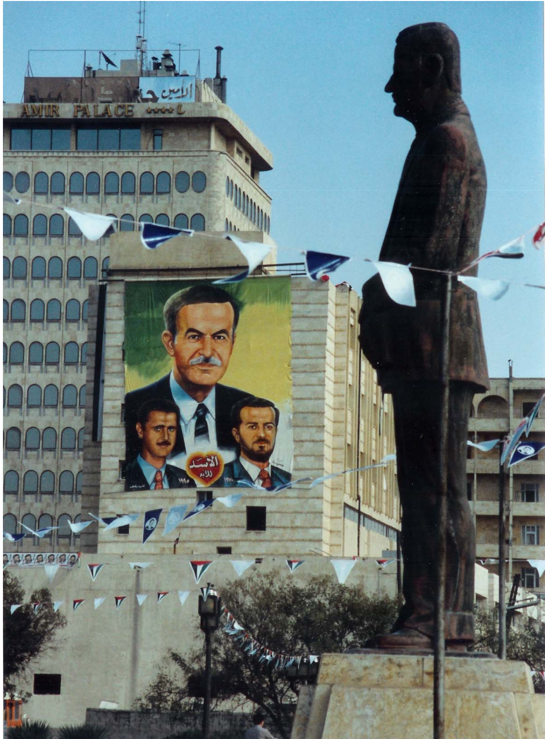
تمثال للرئيس حافظ الأسد و صورة جدارية له و لولديه باسل و بشار، في مدينة حلب .