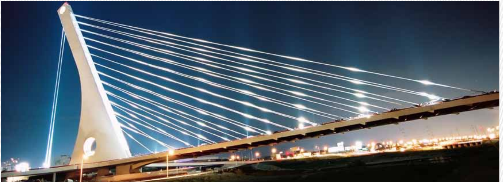
Puente La Unidad (Monterrey, N. L.)

This business unit's participation in several projects across Mexico has helped to consolidate its growth and hence diversify its structural organization. With this, GP Construcción has the capacity to operate at any point of the country and any kind of complexity, maintaining its unique approach to customer service, during and after each project.