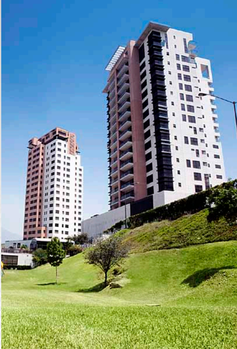
Residencial Los Arcángeles - Torre IV (San Pedro Garza García, NL)

GP Desarrollos es el brazo inmobiliario de Grupo GP, surge en los 80's con la creación del primer parque industrial privado en Nuevo León, el Parque Industrial Monterrey, detonando así oportunidades de inversión nacional y extranjera directa en el Estado de Nuevo León.