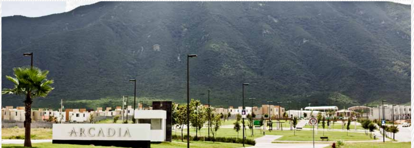
Fraccionamiento Arcadia (Villa de Juárez, NL)

We currently have presence in: Nuevo León, Tamaulipas and Coahuila.