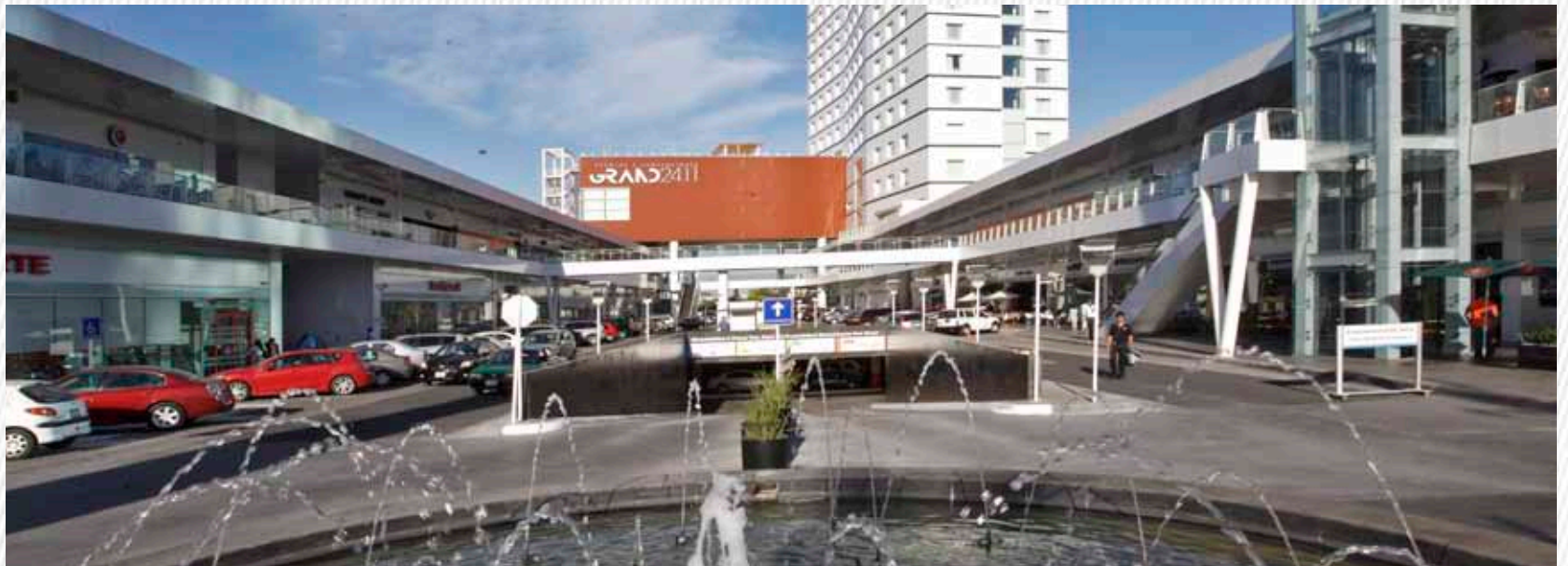
Plaza Comercial Paseo Tec (Monterrey, NL)