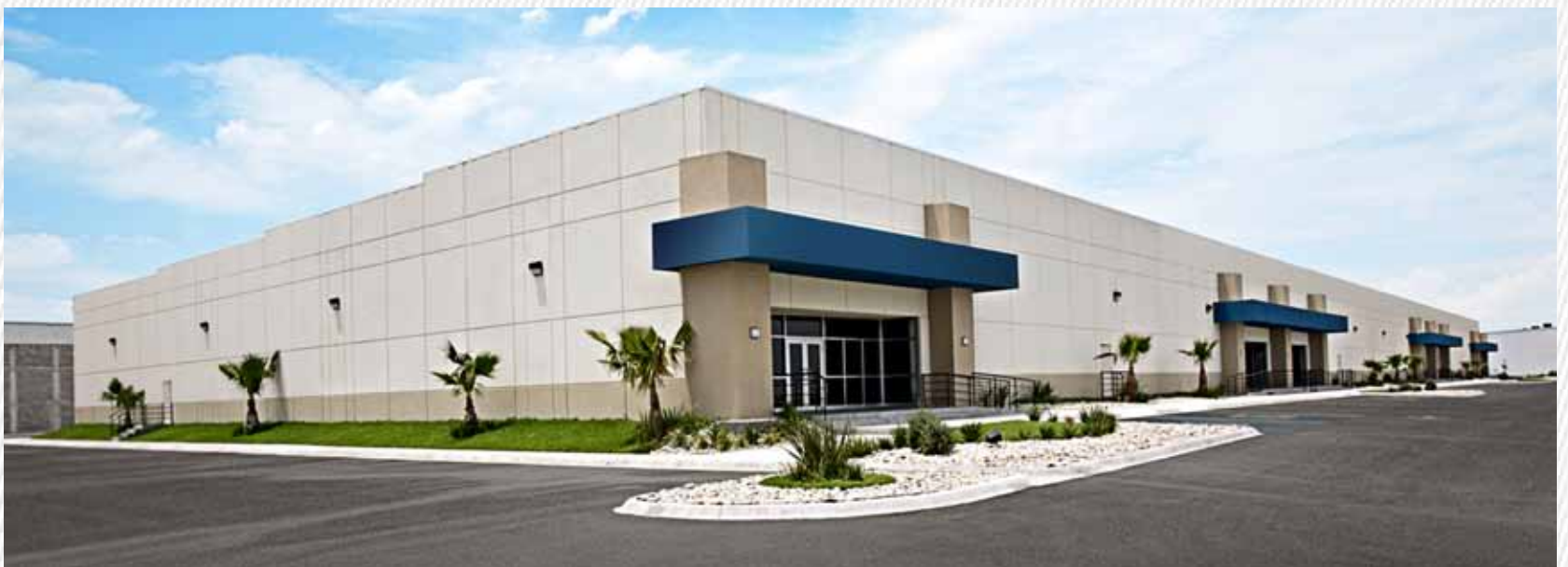
Monterrey Business Park - Edificio II (Apodaca, NL)

With over 10 years of experience in a variety of real estate markets, GP Servicios attends more than 3 million square meters.