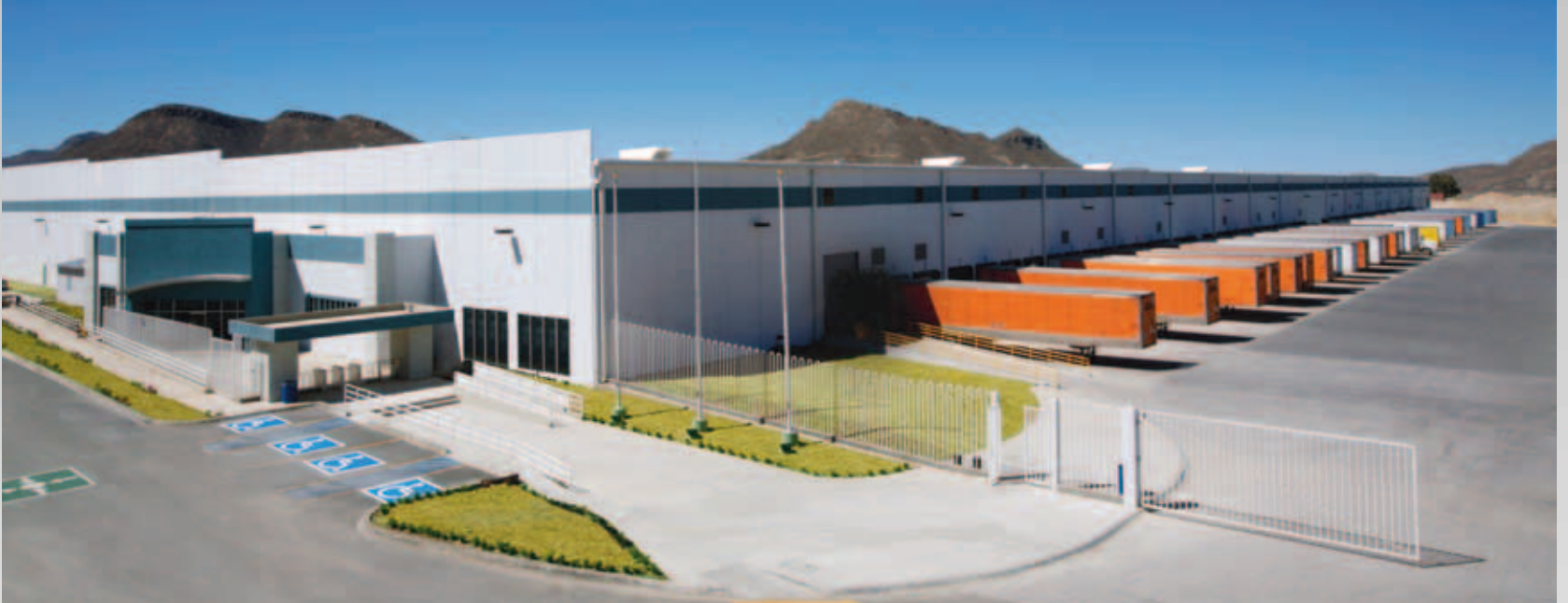
Centro de Distribución Whirlpool (Ramos Arizpe, Coahuila)