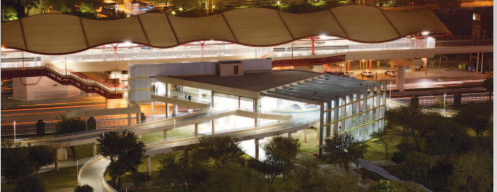
Línea II de Metrorrey - Estación Universidad (Monterrey, NL)