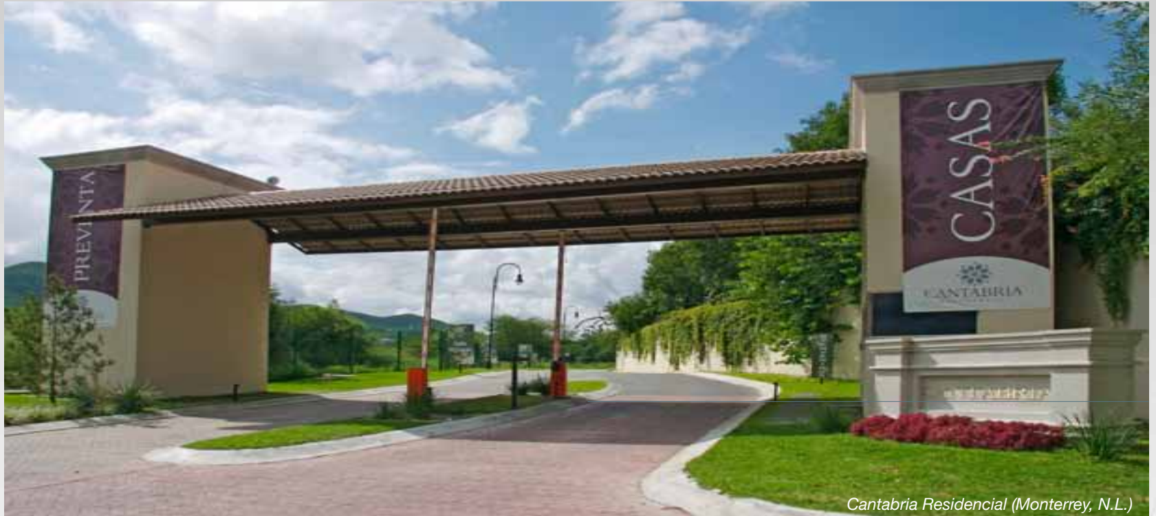
Cantabria Residencial (Monterrey, N.L.)

Una de las empresas más jóvenes de Grupo GP, dedicada a la conceptualización y comercialización de vivienda residencial principalmente en el Area Metropolitana de Monterrey, así como en las ciudades de Guadalajara y Reynosa.