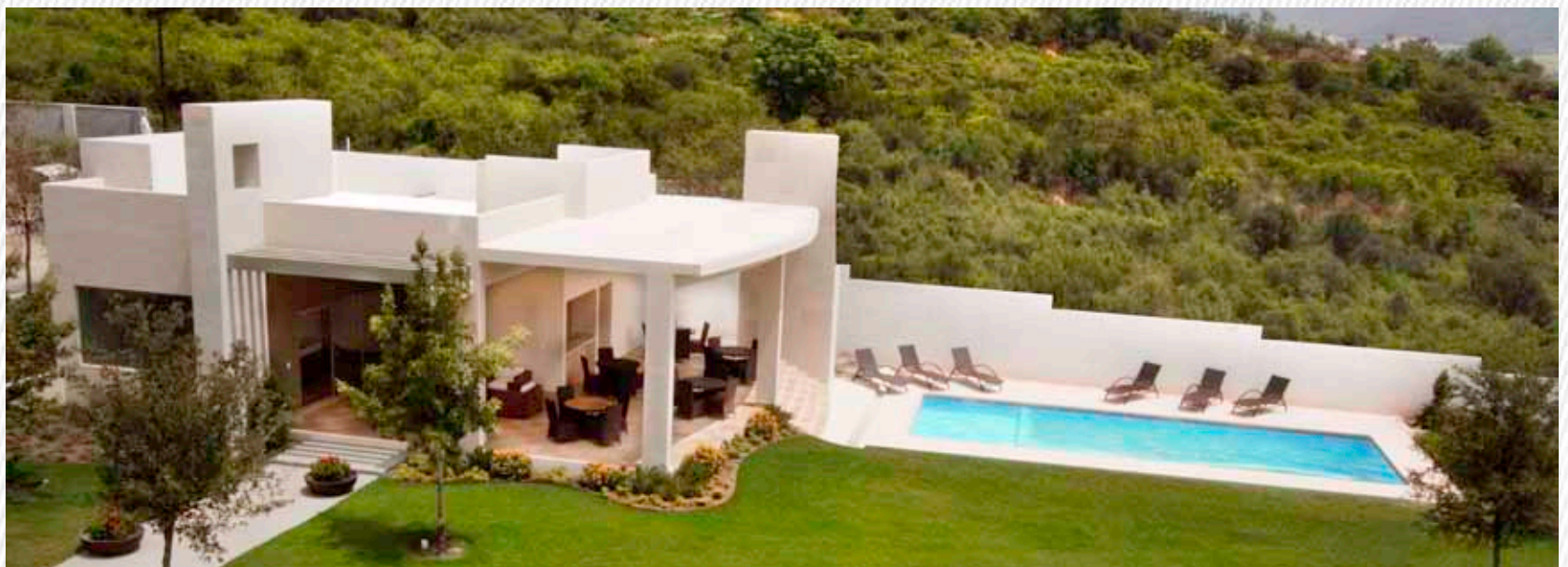
Soria. Comunidad de 40 Residencias

The brand's developments are designed to create a unique experience that offers avant-garde architectural concepts and privacy to create a harmonious and secure urban environment.