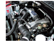
2500 cc Diesel Direct Injection with Turbocharger

Spesifikasi diatas sewaktu-waktu dapat berubah sesuai dengan perkembangan teknologi.