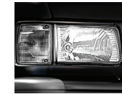
Crystal Head Lamp and clear Sign Lamp

Paling irit dalam penggunaan bahan bakar