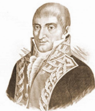
GENERAL FÉLIX MARÍA CALLEJA

1932 El Puente de Calderón es declarado Monumento Nacional