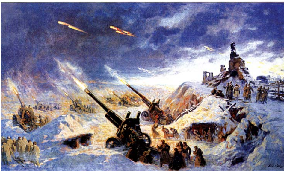
И. Соколов-Скаля. Артиллерия под Сталинградом. 19 ноября 1942 года