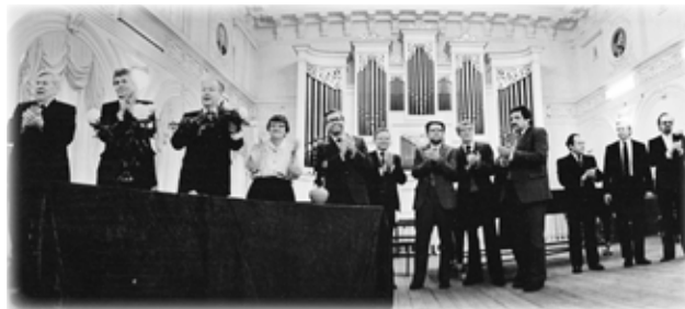
Преподаватели кафедры хорового дирижирования