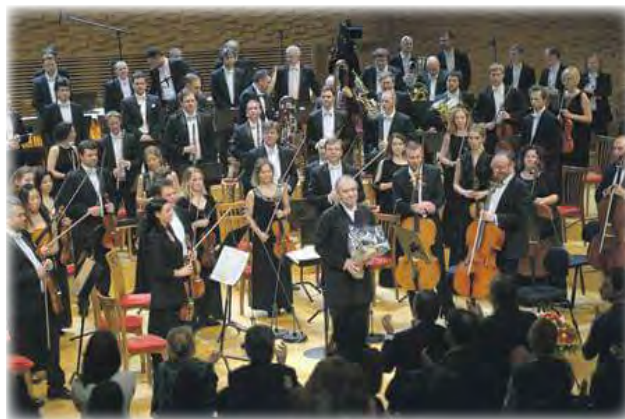
Оркестр под управлением В. Гергиева

Рукопись сочинения 1907 года, посвященного памяти учителя и наставника Стравинского Николая Андреевича Римского-Корсакова, исчезла еще до революционной поры. Рано или поздно уникальный опус Стравинского вернулся бы на концертную сцену.