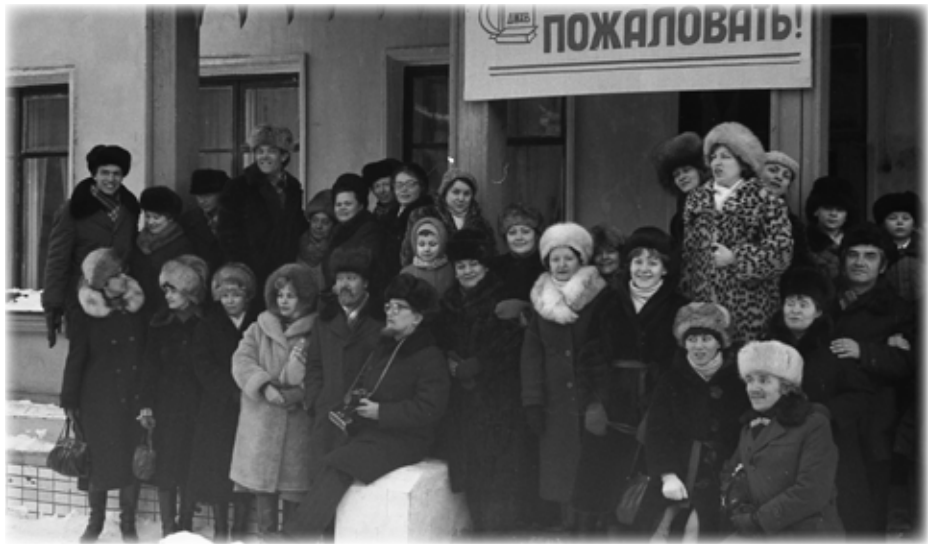
У входа в ДМХВ. 1996