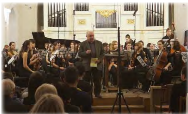
Открытие юбилейного концерта