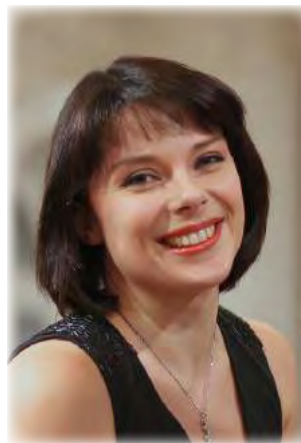
Екатерина Мечетина, солистка Московской филармонии, лауреат международных конкурсов и молодежной премии «Триумф»: