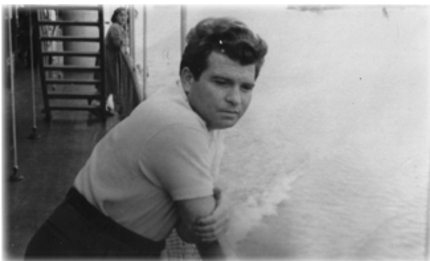
Э. Гилельс на пароходе