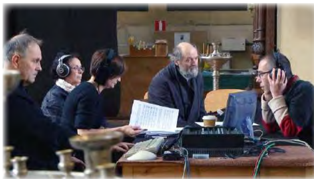
Кадр из фильма «Даже если я все потеряю...»

Конечно, образ Арво Пярта рождается не только из его размышлений, диалогов с близкими, ощущения природы и себя как ее естественной неотделимой части, но, в первую очередь, облик композитора, его глубинное стремление к