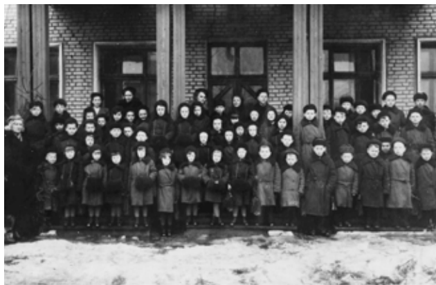
Первые воспитанники. 1947