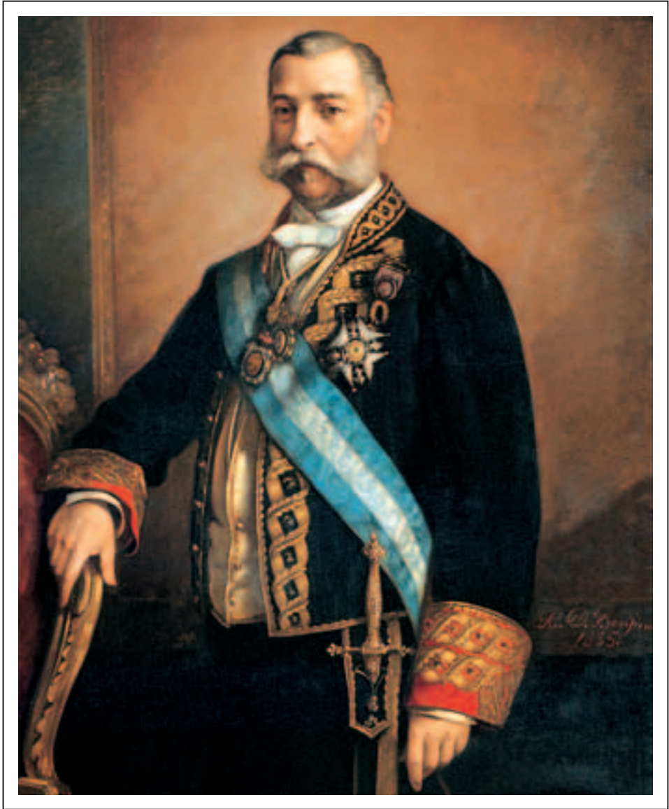
Obra de Rafael Díaz Benjumea