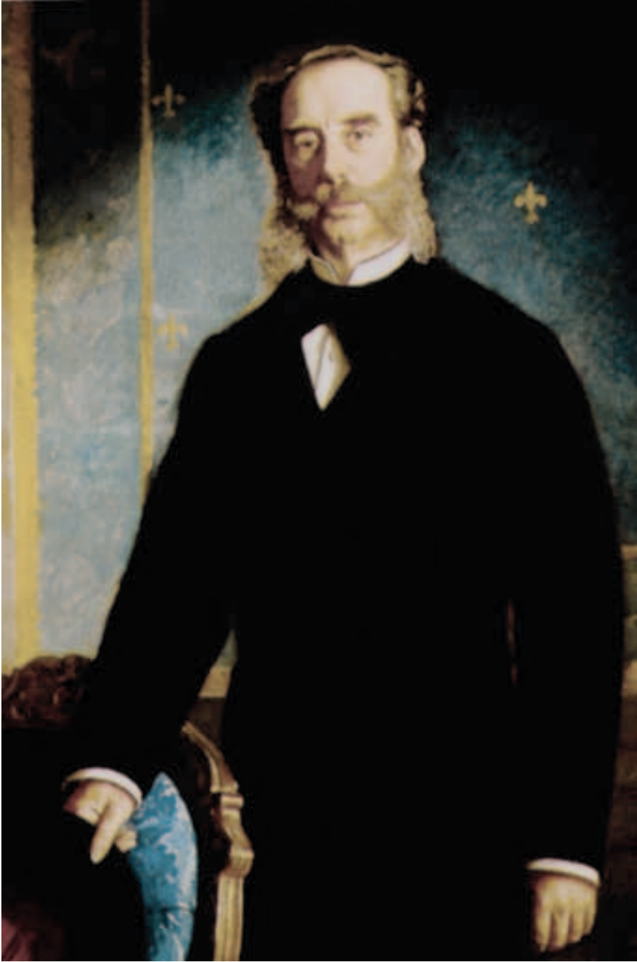
Obra de José Casado del Alisal