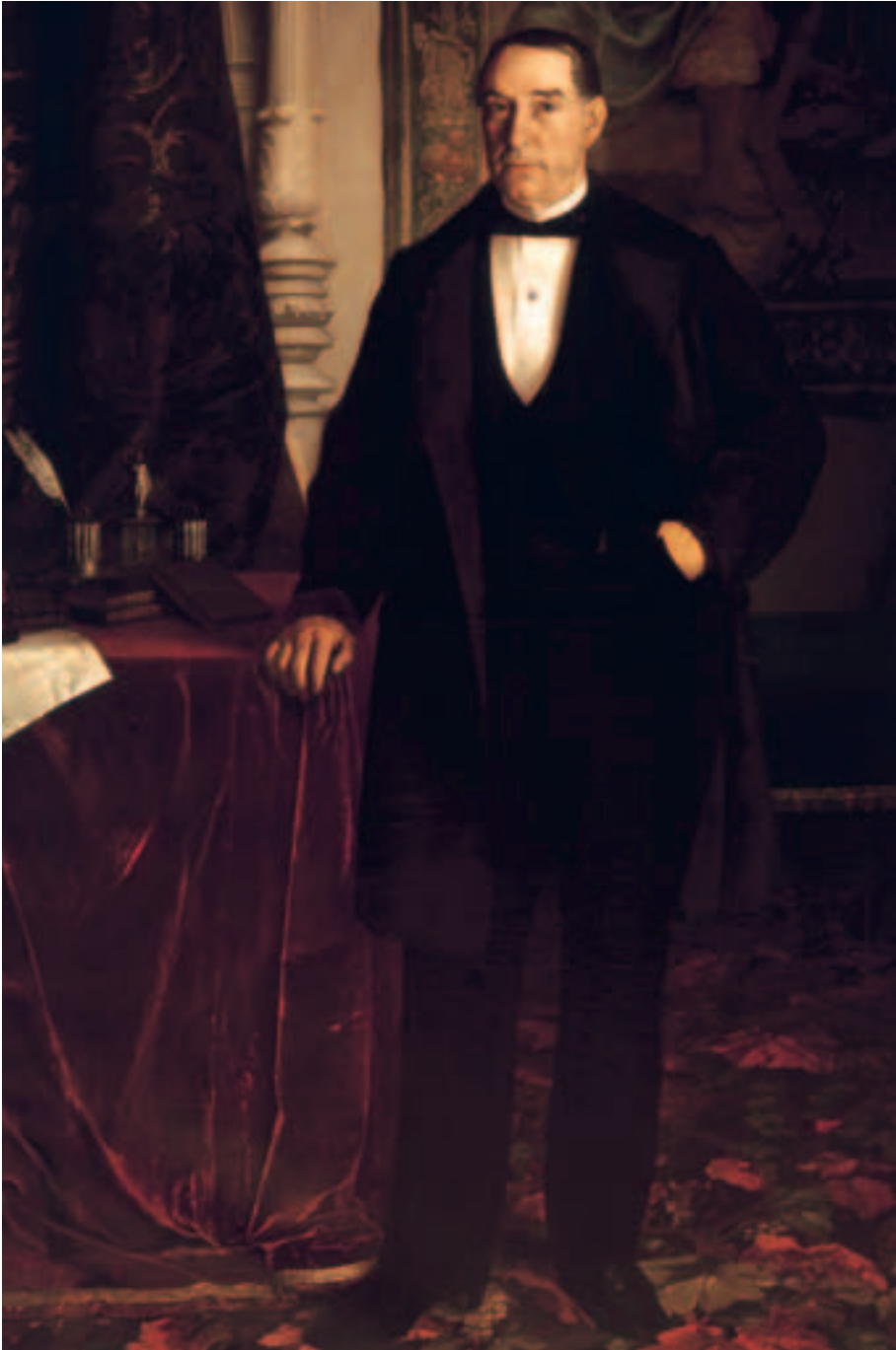
Obra de Eduardo López de Plano