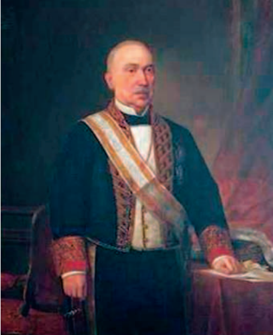
Obra de Pablo Pardo