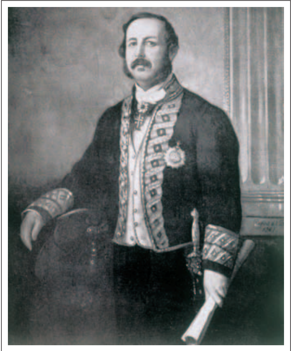
Obra de autor desconocido