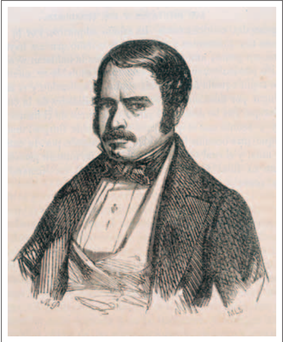
Obra de autor desconocido