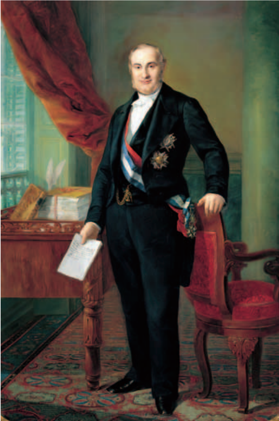
Obra de Bernardo López Piquer