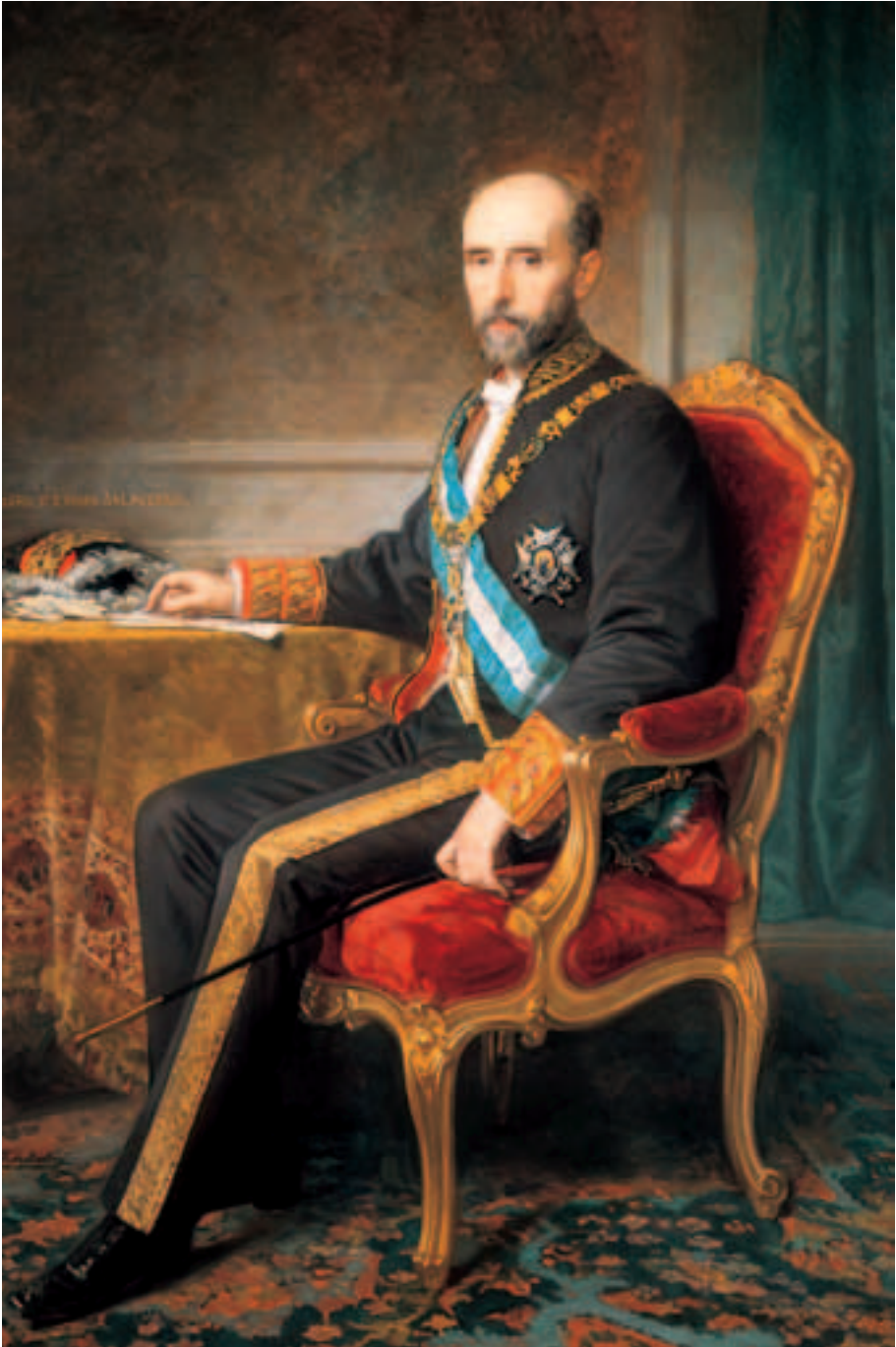
Obra de Federico de Madrazo