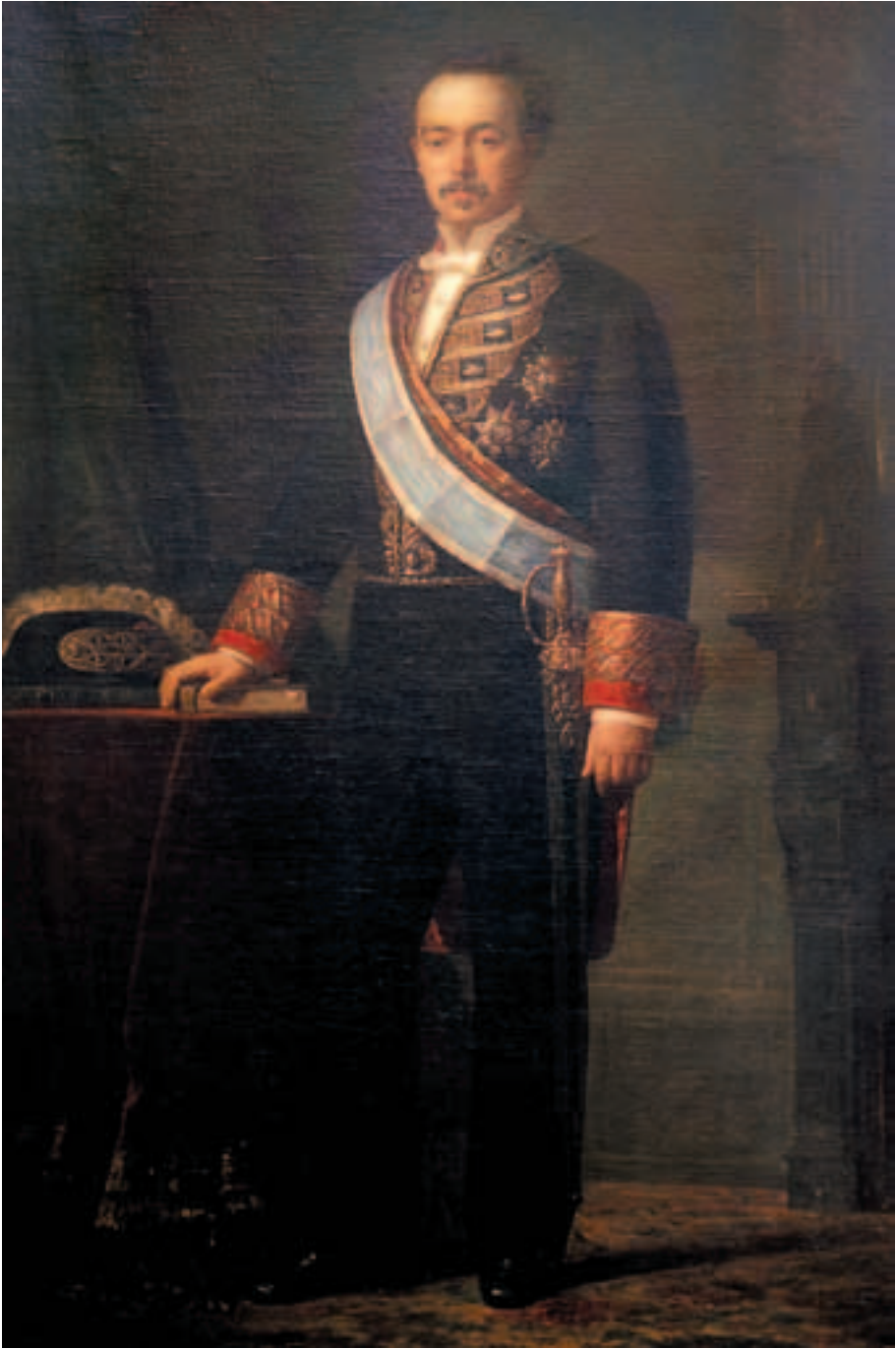
Obra de Dionisio Fierros