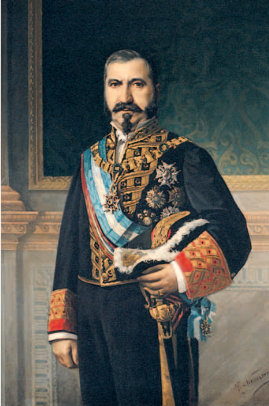
Obra de Román Navarro García