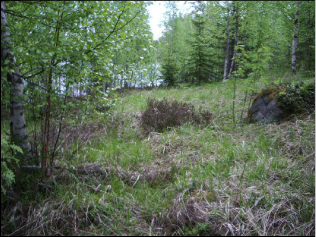
Asuinpaikan maastoa kuvattuna itään.