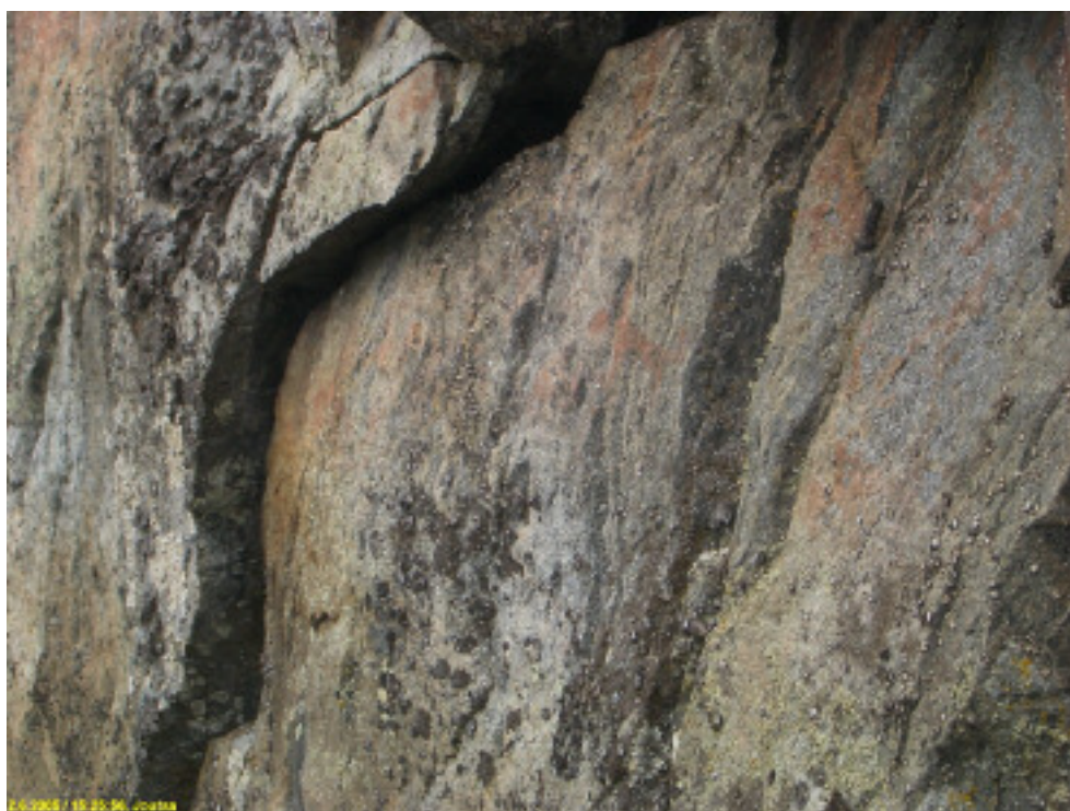
Lähikuva maalausseinämästä, jossa keskellä, hieman oik. erottuu hirven kuva