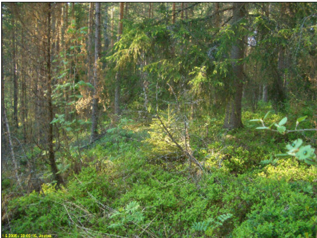
Asuinpaikkaterassia kuvattuna pohjoiseen