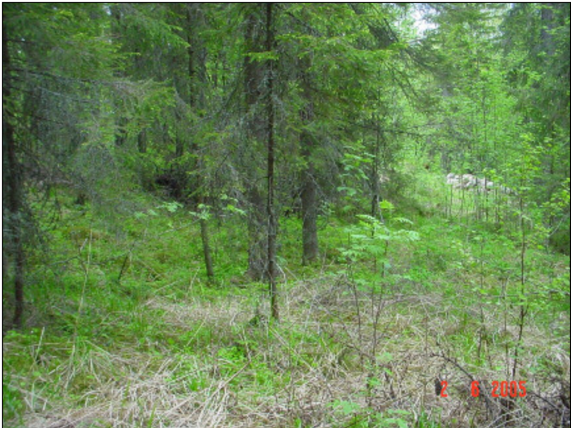
Asuinpaikan maastoa kuvattuna pohjoiseen.