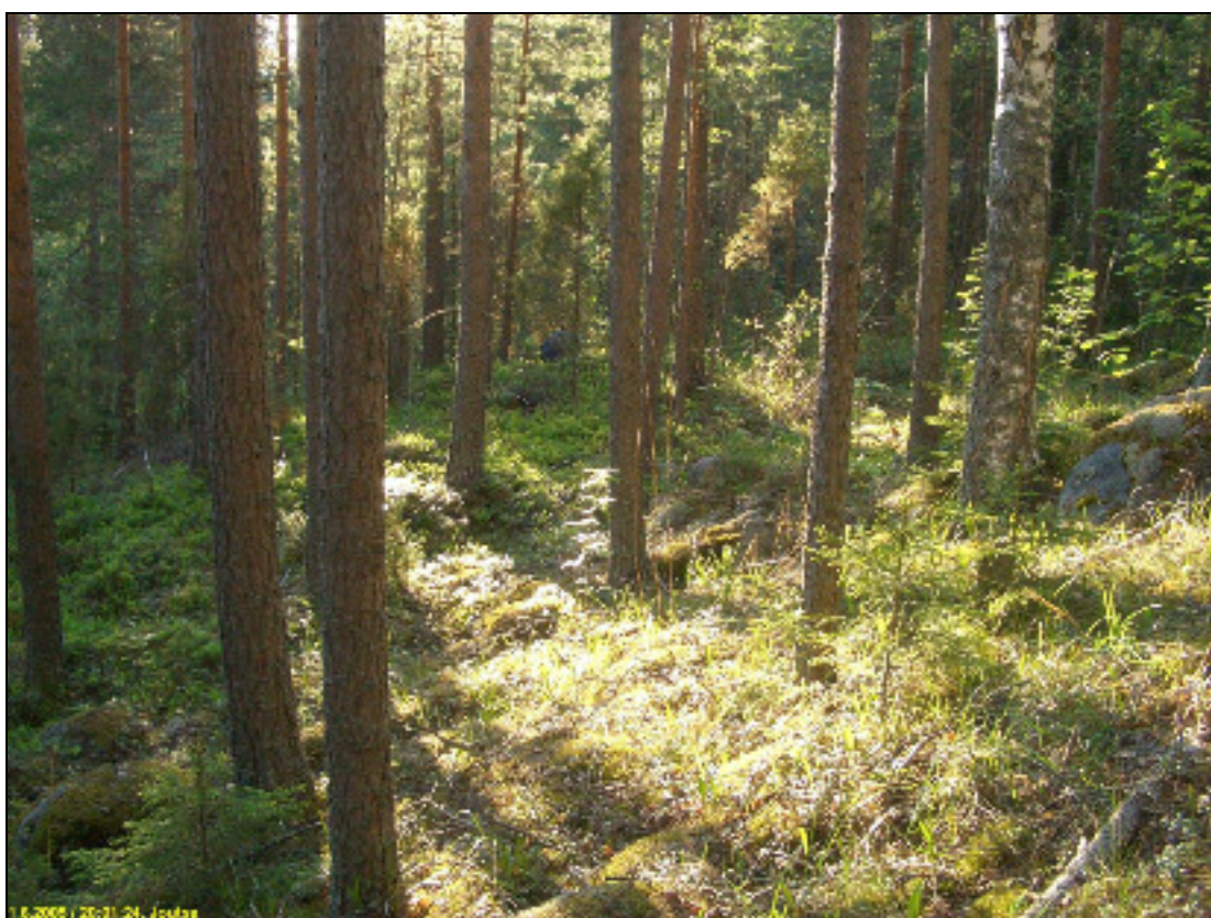
Asuinpaikkaterassi kuvattuna lounaaseen yläpuoliselta mäeltä.