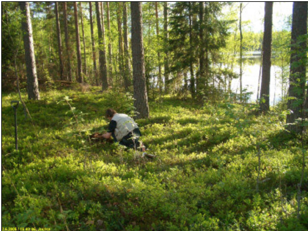
Asuinpaikkaa kuvattuna lounaaseen.