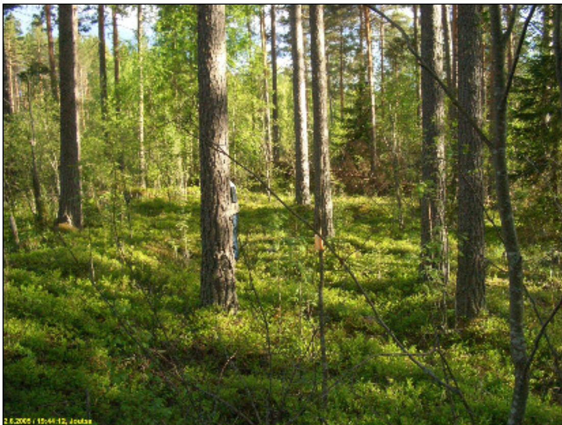
Asuinpaikkaa kuvattuna etelään, alla pohjoiseen