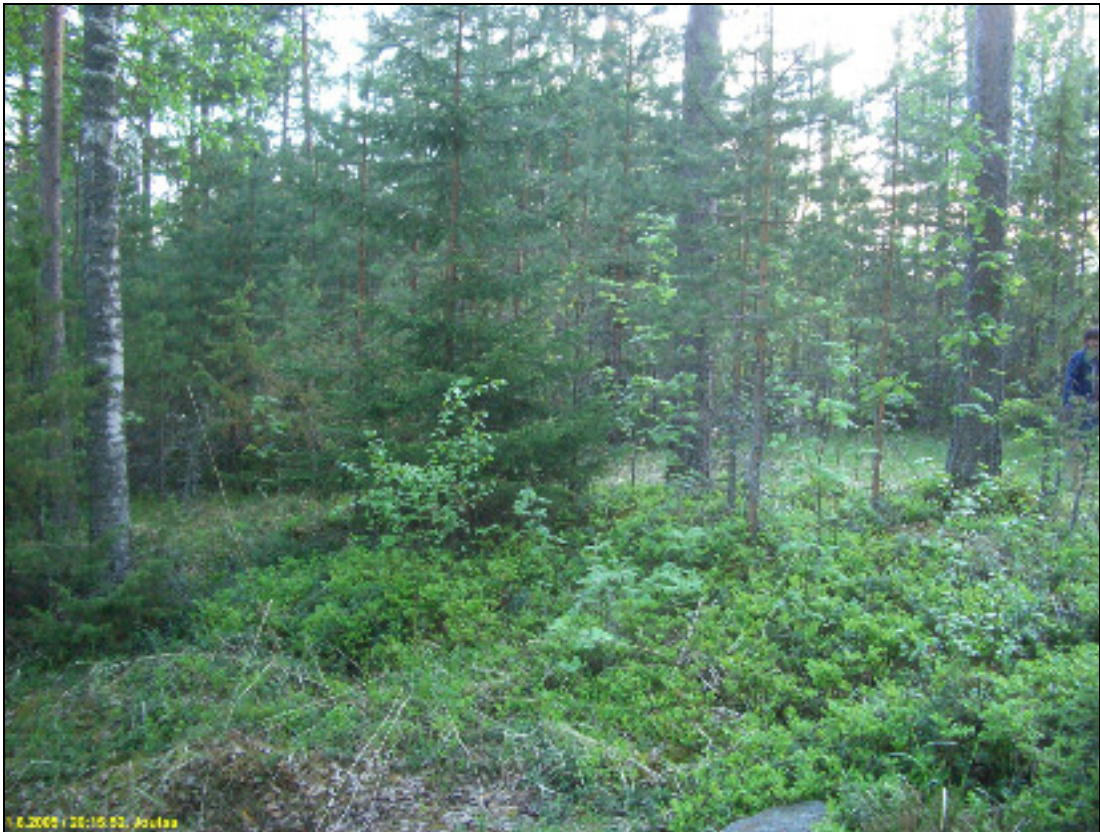
Asuinpaikkatasannetta kuvattuna länteen.