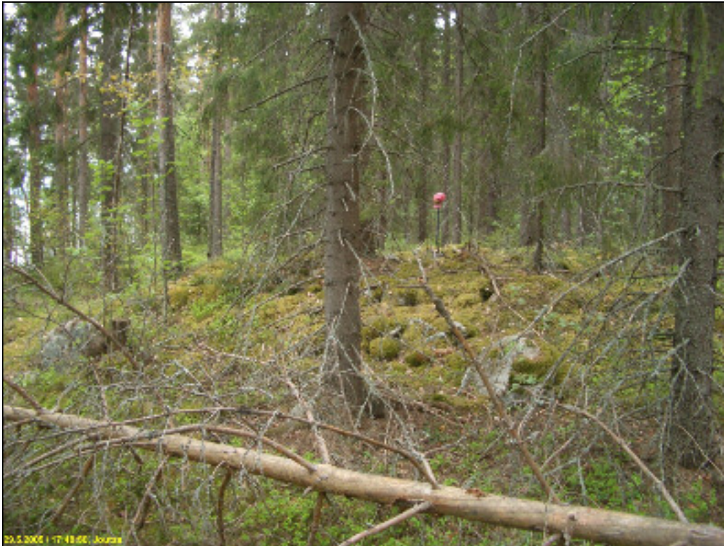
Lapinraunio, kuvattu lounaaseen, alla koilliseen.