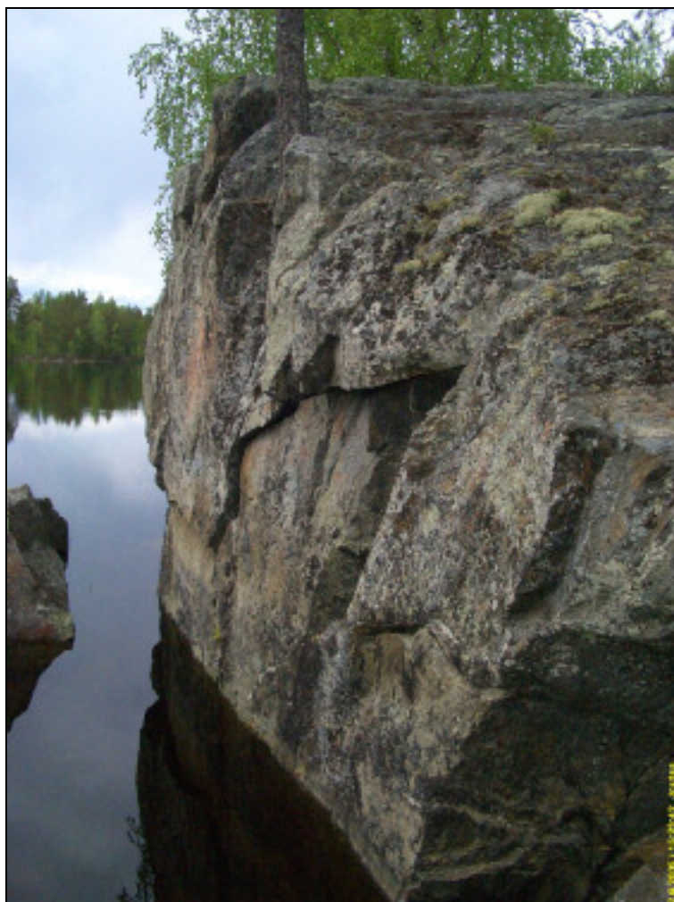
Maalausseinämä kuvattuna sen eteläpuolelta rantakiveltä