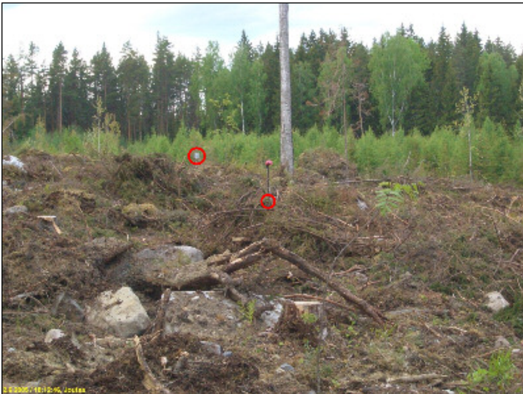
Asuinpaikan eteläreunaa edustalla (pun ympyrä) kuvattuna luoteeseen, harjanteen takana (toinen pun ympyrä) asuinpaikan pohjoisreuna.