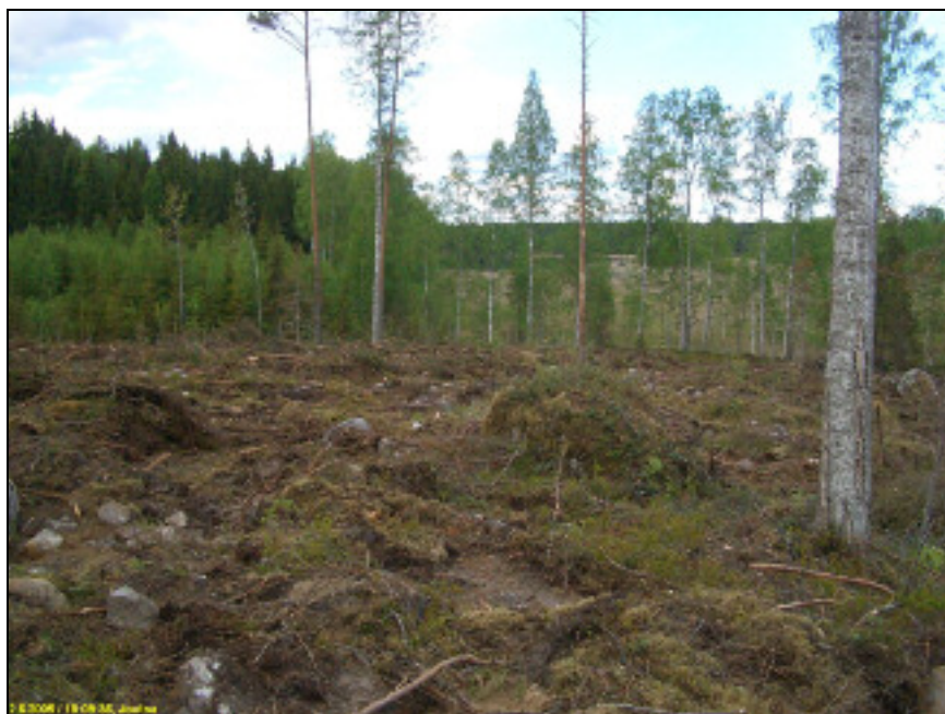
Asuinpaikkaa rinteessä, kuvattuna koilliseen metsätien tasalta

Huomiot: Paikka on laakean mäenkumpareen koillisrinteellä, hieman lakitasanteen alapuolella loivasti Retisenlampeen laskevassa rinteessä. Paikalla käytäessä rinne oli hakattu ja laikutettu. Laikuissa havaittiin kvartsi-iskoksia siellä täällä, sekä palanutta luuta ja kampakeramiikan paloja keskittymänä kartalle rajatun alueen eteläpäässä ja toinen keskittymä alueen luoteispäässä. Kyseessä on laajahko kivikautinen asuinpaikka joka vaikuttaa rajautuvan alarinteessä n. 98-97 m korkeustasolle ja ylärinteessä hieman alle 100 m tasolle. Paikan rajausta perustuu löytöhavaintoihin ja niiden perusteella tehtyyn arvioon - rajausta ei ole tarkka. Maaperä paikalla on kivinen hiekkamoreeni. Paikka on laikutuksesta huolimatta suhteellisen ehjä. Paikannustarkkuus kartalle on n. +6 m.