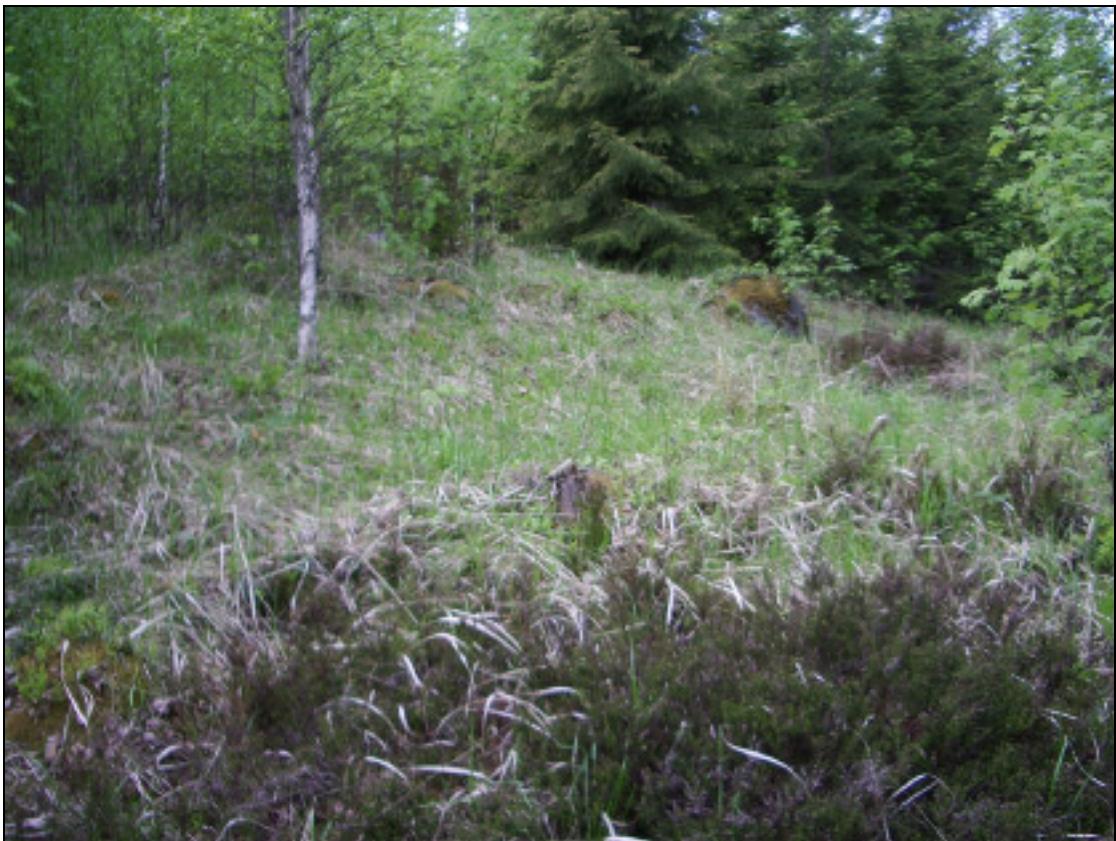
Asuinpaikan maastoa kuvattuna sen alapuolelta kaakkoon.