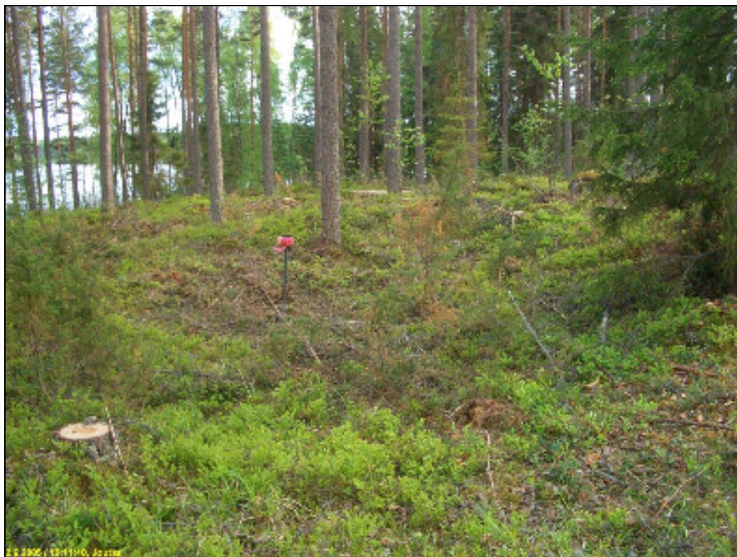
Asumuspainanne, kuvattu lounaaseen, alla luoteeseen.