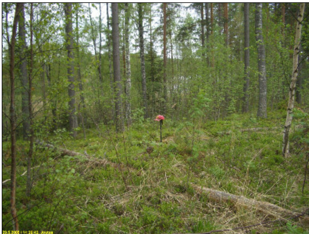
Asuinpaikkaa kuvattuna lounaaseen alla luoteeseen.