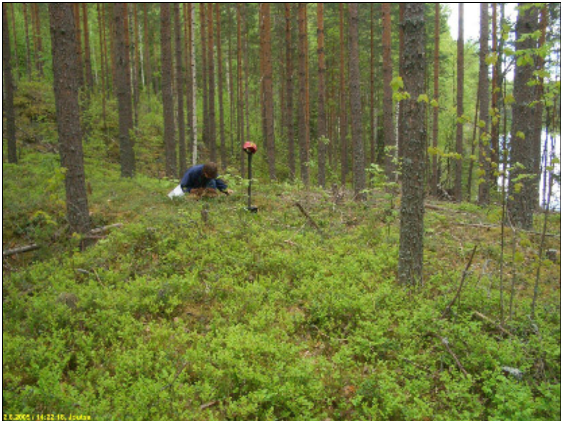
Asuinpaikkaa kuvattuna etelään.

Huomiot: Paikka on järvestä jyrkäkästi nousevan rinteiden laella olevalla tasanteella, koko tasanteen alalla. Paikka on täysin ehjä. Maaperä hiekkamoreeni ja kasvillisuus sekametsä. Kumpareen päällä, asuinpaikalla on myös hiilihauta.