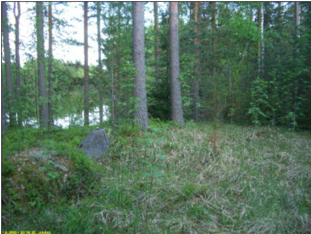
Asuinpaikkatasannetta, kuvattuna etelään.