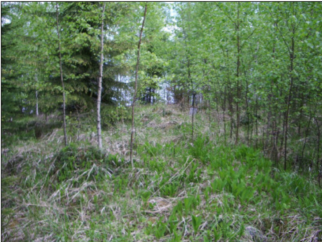
Asuinpaikan maastoa kuvattuna etelään.