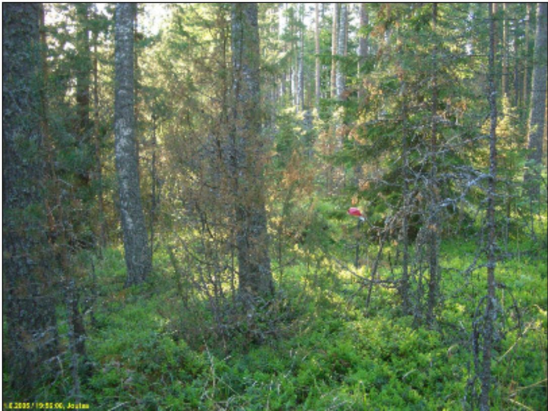
Asuinpaikkaterassi, kuvattu pohjoiseen.