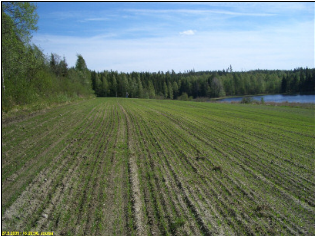
Kuvattu etelään alueen pohjoispäästä

Huomiot: Pelto laskee länteen ja etelämpänä lounaaseen. Länteen viettävä peltorinne on hienoaineksista moreenia, mutta pellon yläosa hiekkainen. Länteen viettävältä peltoalueelta löydettiin selkeitä kvartsi-iskoksia laajalta alalta, sekä rinteestä, että myös alemmaa. Pieni muutaman kvartsin keskittymä oli ylärinteessä, hiekkaisemman maaperän kohdalla, kun muut kolme tulivat alemmaa rinteestä ja leveämmältä alalta. Asuinpaikkaa ei saatu kunnolla esiin, eikä selkeästi rajattua. Ovatko kvartsit levinneet jostakin yhdestä keskittymästä (yläosasta, johon koordinaatti viittaa) vaiko onko alueella kenties useita keskittymiä - siis laajempi asuinpaikka? Asuinpaikan raja on karkea arvio ja oletus! Tarkka rajaaminen edellyttää koekaivauksen tai muun systemaattisen kartoituksen.