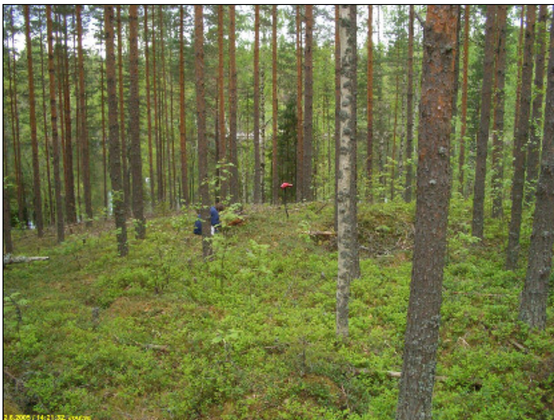
Asuinpaikkaa kuvattuna länteen, alla itään.