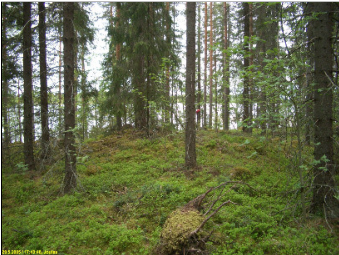
Kuvattu etelään, osin sammalpeitteinen lapinraunio kuvan keskellä

Huomiot: Paikalla on matalan harjanteen eteläpäässä - niemekkeen eteläkärjessä - rannan tuntumassa suhteellisen suuri, komea ja täysin ehjä lapinraunio. Kooltaan se on n. 4 x 7 m ja korkeudeltaan n. 1 m. Raunio on osin sammaleen peitossa, mutta jyrkkäseinäinen ja kajoamaton. Sen keskellä on pieni painauma kivikerroksessa. Raunion ympäristö on kuusivaltaista sekametsää ja maaperä varsin kivinen hienohiekkamoreeni. Satunnainen koekuopitus alueella ei tuottanut havaintoja esihistoriasta - mutta se ei tässä tapauksessa kerro paljoa mahdollisesta muun muinaisjäännöksen olemassaolosta. Raunion ympäristö ja miljöö on täysin ehjä - komea, ja sellaisena syytä säilyttää.