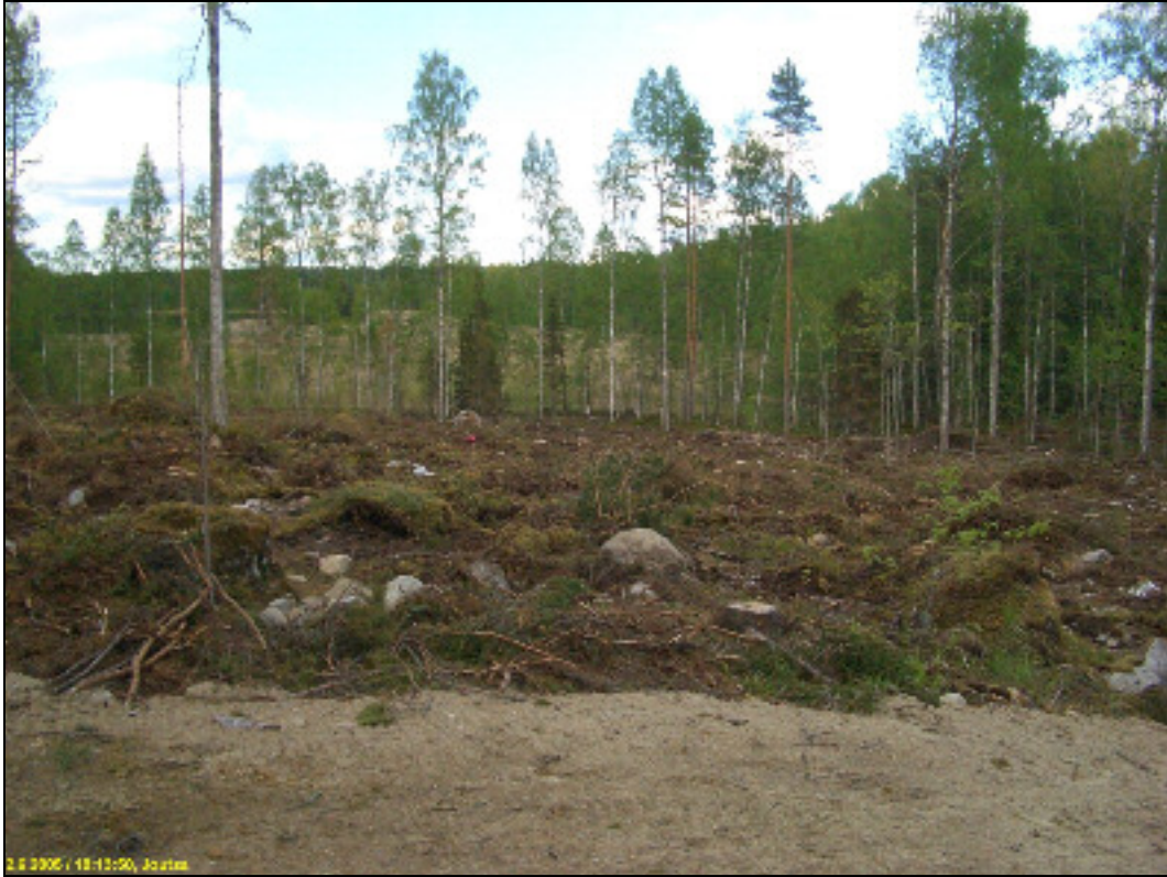
'Asuinpaikkaa rinteessä, kuvattuna itä-koilliseen metsätien tasalta