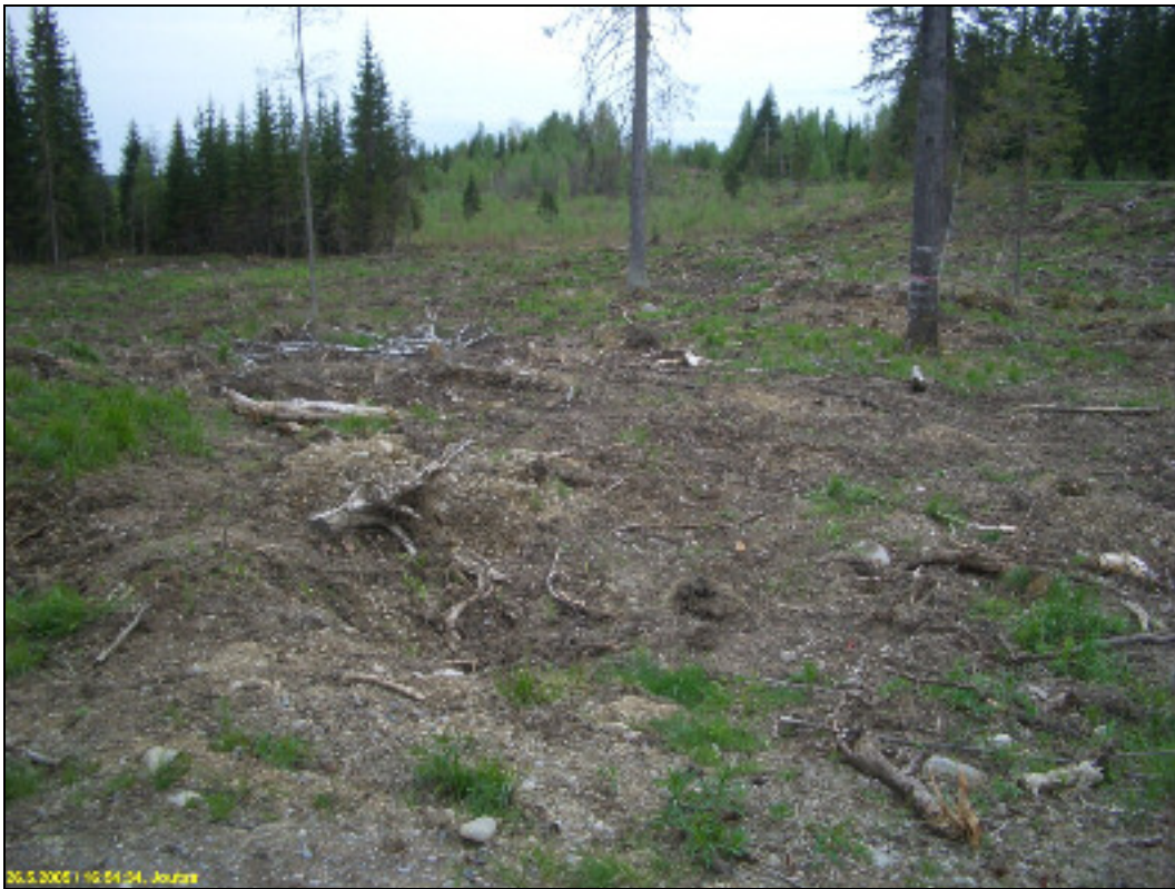
Asuinpaikan maastoa kuvattuna etelään. Vas. penkereen päällä maantie.