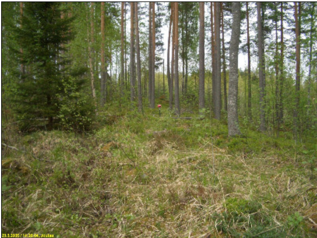
Asuinpaikkaa muinaisrantatörmän päällä, kuvattu länteen.

Huomiot: Paikalla on kahden kallioisen ja kivikkoisen kumpareen välissä rannan suuntainen hieman alavampi alue, joka laskee jyrkästi järveen. Tällä kumpareiden välisellä alalla maaperä on itäosassa ja törmän reunalla vähäkivinen, kun se muuttuu kauempana rannasta ja törmän reunasta taas kiviseksi ja kosteammaksi. Törmää pitkin kulkee sähkölinja. Asuinpaikka rajautuu maaperän ja koekuoppahavaintojen perusteella kohtalaisen selkeästi enintään n. 40-50 m leveälle rantakaistalle törmän reunalle. Koekuopissa havaittiin myös vahvaa likamaata, n. 10-15 cm paks. ja heti ohuen huuhtoutuneen kerroksen alla.