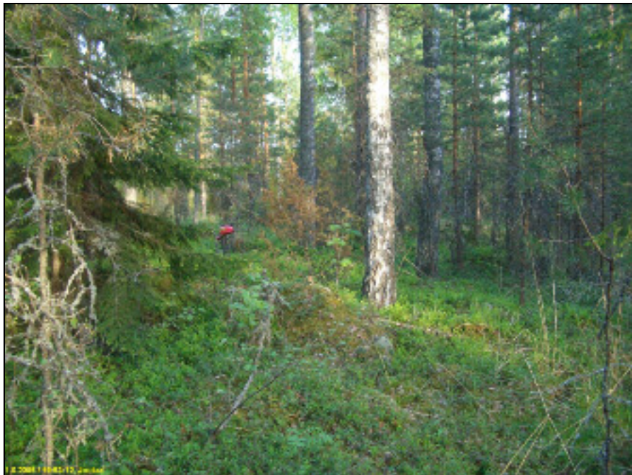
Asuinpaikkaterassi vas, oikealla muinaisrantatörmää, kuvattu itään.