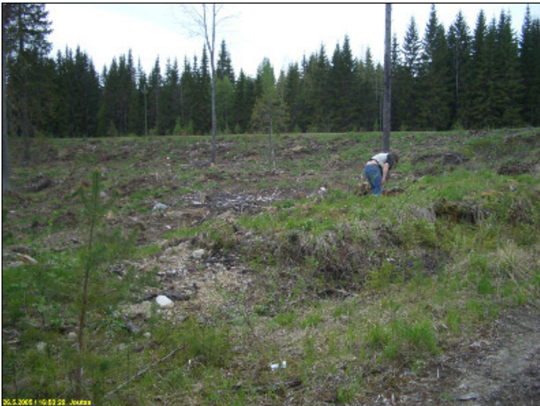
Asuinpaikkaa metsätien eteläpuolella, kuvattu länteen, takana maantien penger