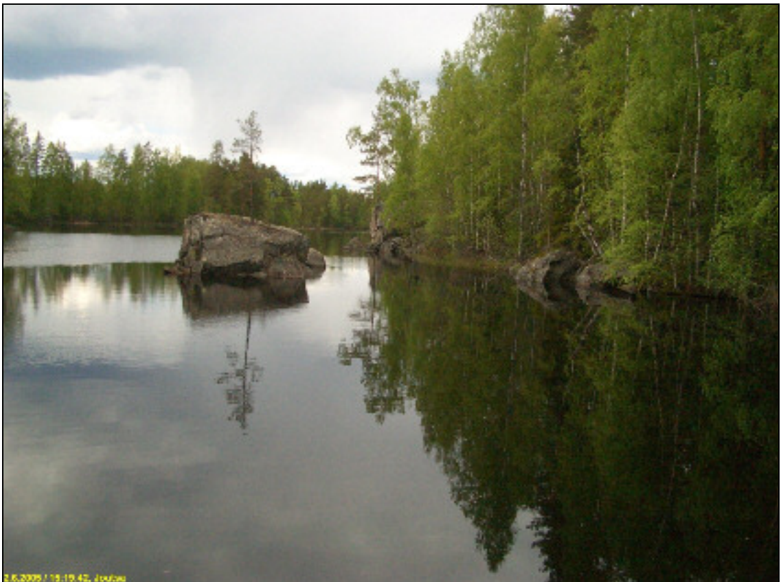
Itäpuoleinen maalaus kallio uoman keskellä olevan lohkarereen takana oikealla, kuvattuna Viherin vanhalta sillalta pohjoiseen