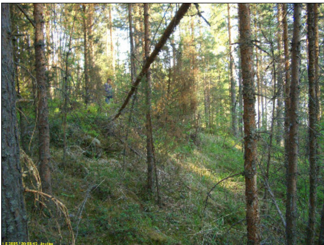
Asuinpaikkaterassi vas. ja muinaisrantatörmä kuvattuna etelään.