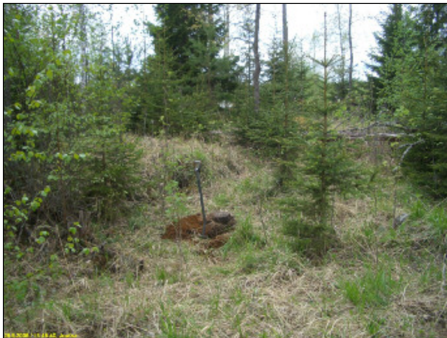
Löytökoekuoppa heti muinaisen rantavallin takana, kuvattu etelään

Huomiot: Niemen kärjen rannat ovat hyvin alavia ja tasaisia - vesijättöä. Rantatasanteen takana on vanha komea rantavalli, jään puskema kiven ja maan sekainen. Korkeammilla kohden valli muuttuu törmäksi. Aivan kärjessä, n. 30 m nykyisestä matalasta rannasta on em. valli ja sen takana nousee hieman ylempi harjanne. Harjanteen ja rantavallin väliseltä alueelta tuli koekuopista löytöjä, enimmäkseen löydöt heti vallin takaa, kivisestä hiekkamoreeniasta. Paikka on täysin ehjä. Sen länsipuolella maasto muuttuu vallin takana alavammaksi ja hyvin kosteaksi, vallin kaartuessa pohjoisen suuntaan. Asuinpaikan länsirajaus on epäselvä ja arvioitu.