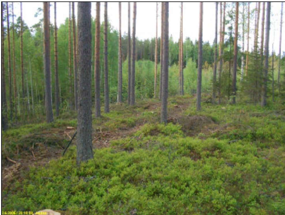
Asuinpaikkaa kuvattuna pohjoiseen.