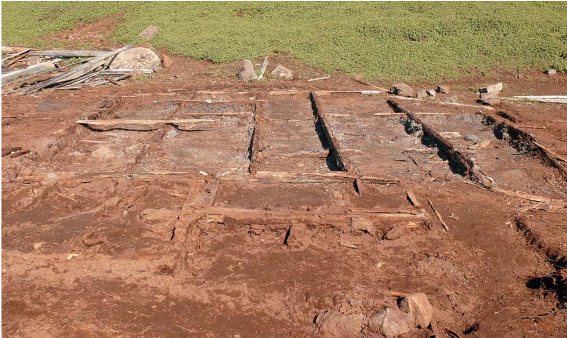
Abb. 5: Das freigelegte Fundament des Stationshauses. Die „englischen“ Balkenstücke quer zu den darüber liegenden Balken sind gut zu erkennen.