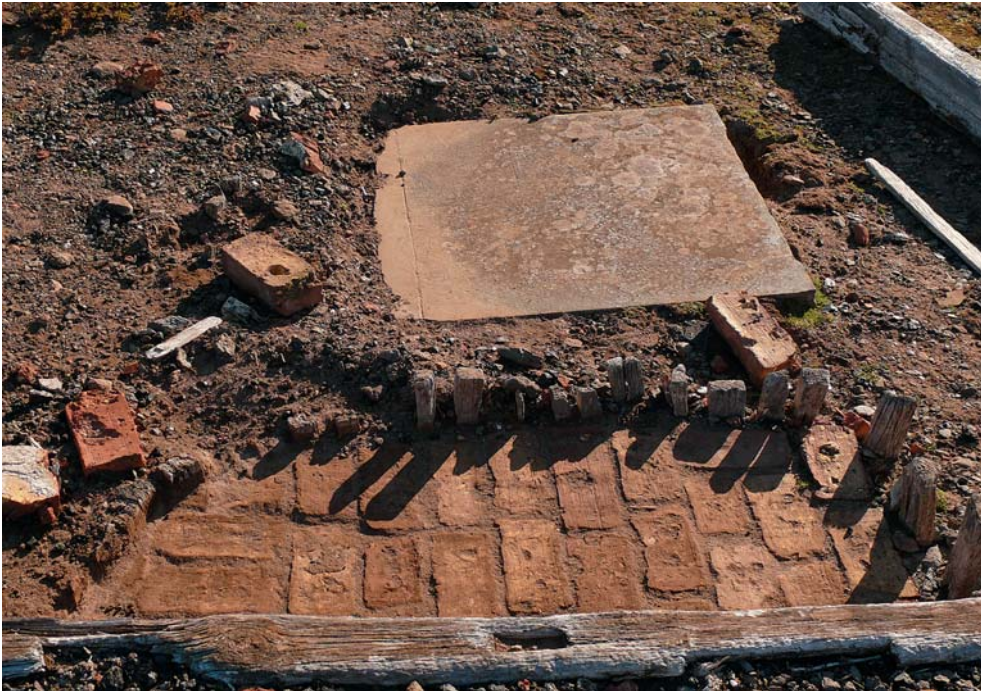
Abb. 9: Das gezielte Fundament innerhalb des Variationshauses.