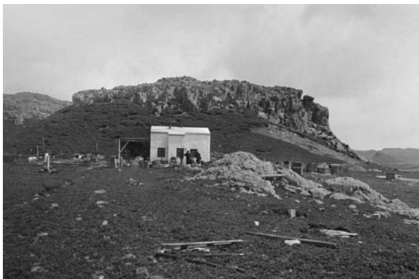
Abb. 6: Das Stationshaus. Im Hintergrund der Stationsberg. (Quelle: Privatbesitz C. Lüdecke).