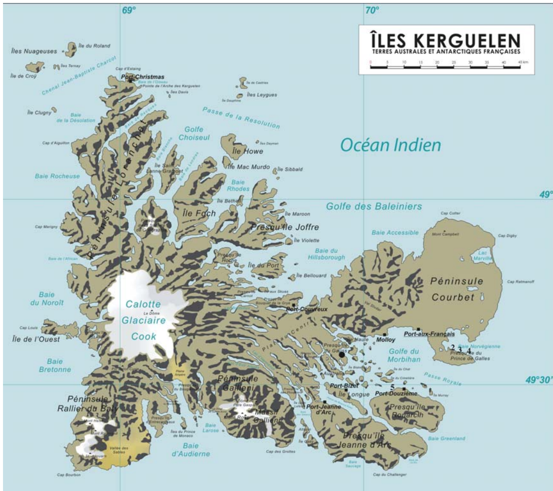
Abb. 1: Übersichtskarte über die Inselgruppe Kerguelen. ● = Beobachtungs-Bucht auf der Gauss-Halbinsel, 2 = Tombe Matley, 3 = Pointe ornithologique, 4 = Pointe Morne, 5 = Friedhof (verändert nach Wikipedia).