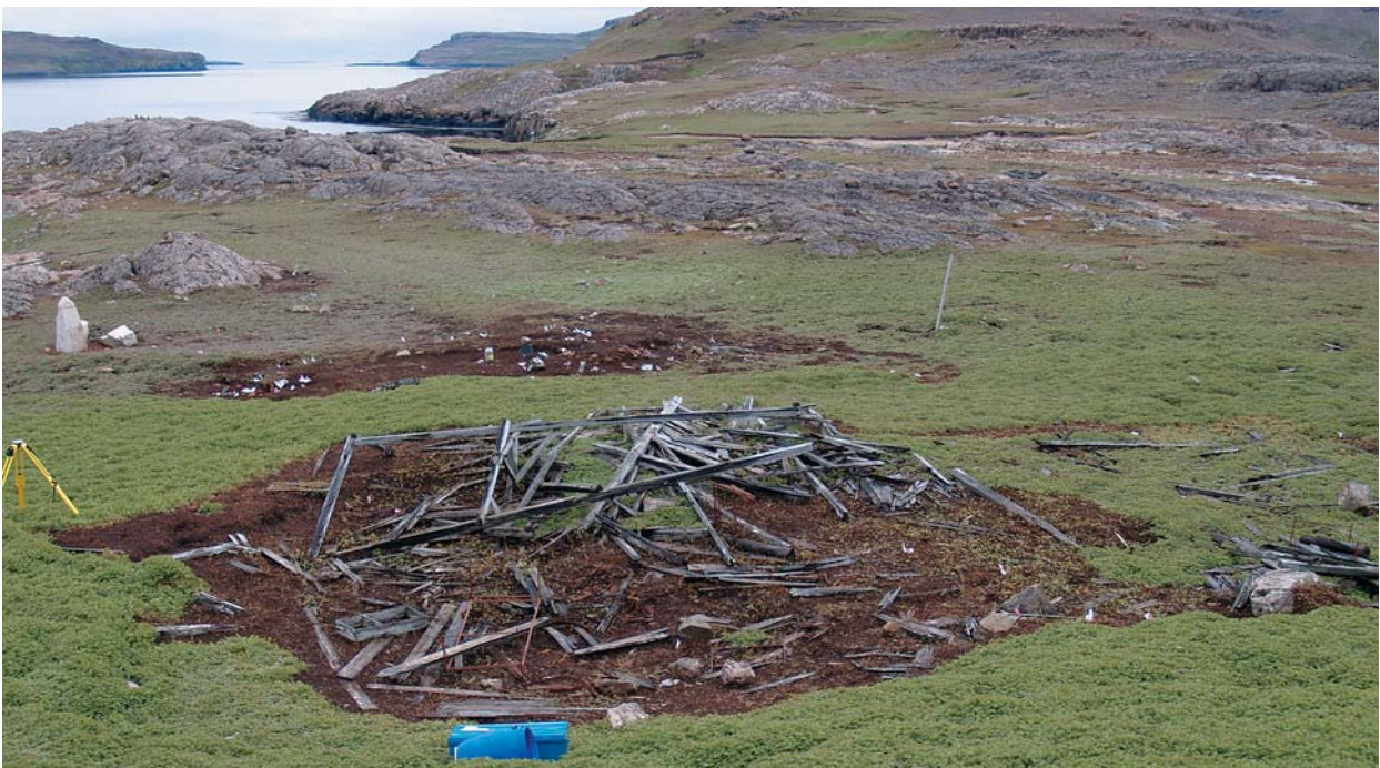
Abb. 4: Das Stationshaus nach dem Entfernen des Acaena -Bewuchses.