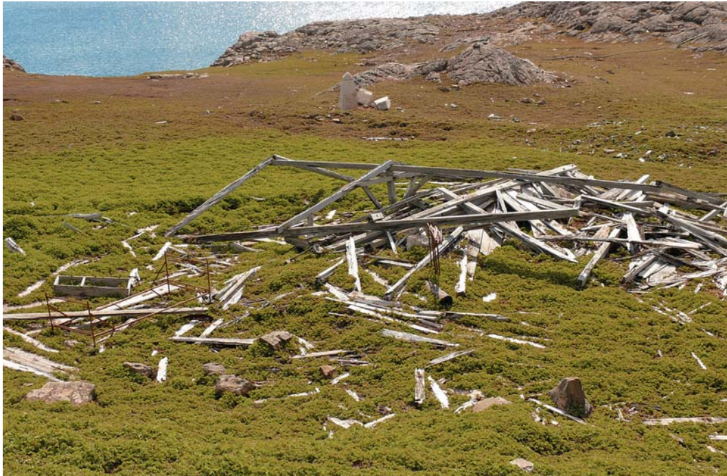
Abb. 3: Die Reste des Stationshauses vor Beginn der Grabung. Im Hintergrund sind die Passagesteine zu sehen.