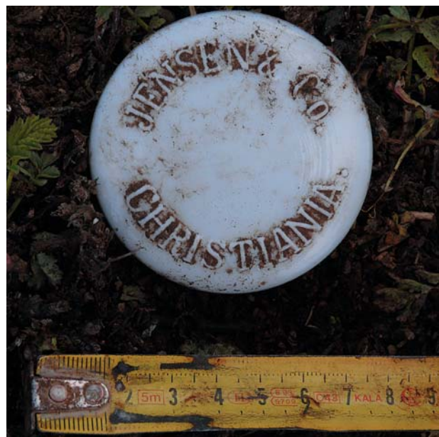
Abb. 12: Flaschendeckel mit der Beschriftung „JENSEN & Co. CHRISTIANIA“ aus der Fundstelle „Maison Culet“ deutet auf Kontakte nach Norwegen hin.

Zahlreiche Reste von Türen und Fenstern, die sich kaum von den entsprechenden Funden aus dem Stationshaus unterschieden, konnten geborgen werden. In mindestens einem Fall erwies sich eine Klinke aus der Fundstelle „Maison Culet“ als identisch mit einer Klinke aus einer Tür aus dem Wohnhaus. Linoleum wurde auch gefunden, aber nur in geringerer Menge. Korkschrot kam hingegen nicht zum Vorschein. Interessant war, dass die Beschriftungen auf den Kleinfunden niemals in französischer Sprache abgefasst waren. Auf insgesamt fünf Fundstücken war der Produktionsort oder das Herstellungsland abgedruckt: „Castleford“ auf einem Glasbruchstück, ein Bruchstück einer Flasche mit der Aufschrift „Wales“, eine Flasche und ein Glasdeckel mit „Christiania“ und eine Lampe mit „Made in Saxony“. Zwei Artefakte kommen also aus dem Vereinigten Königreich, zwei aus Norwegen („Christiania“ ist die alte Bezeichnung für Oslo bis 1877; Abb. 12) und eines aus Deutschland. Man kann also erkennen, dass bis auf die Reagenzgläser kaum wesentliche Unterschiede in den Kleinfunden aus dem Stationshaus und