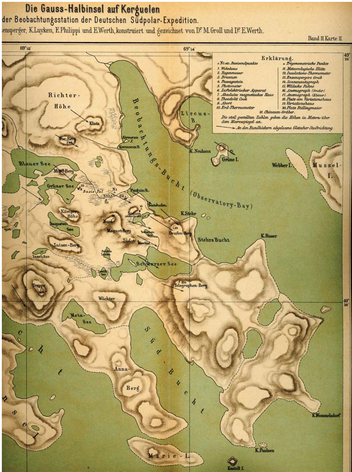
Abb. 2: Karte der Gauss-Halbinsel mit der Umgebung der Kerguelenstation an der Beobachtungs-Bucht, erstellt 1902. Solche Karten waren während der Ausgrabungen 2006/07 eine wichtige Orientierungshilfe (aus WERTH 1906).