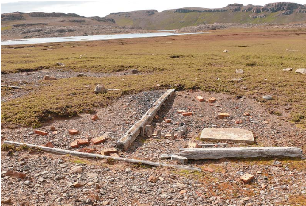
Abb. 8: Die oberirdisch sichtbaren Reste des Variationshauses vor der Grabung (Foto: Barbot).

Sicherlich eines der auffälligsten Zeichen des Siedlungsplatzes an der Beobachtungsbucht sind die „Passagesteine“ (Abb. 11). Es handelt sich hierbei um zwei etwa eineinhalb Meter hohe weiße Steinpfeiler, die sich etwa 15 m östlich vom Wohnhaus befanden, wobei sie aber überraschenderweise auf keinem historischen Foto der ersten deutschen Südpolarexpedition abgebildet sind. Die Pfeiler wurden wohl von der britischen Expedition zu den Kerguelen gebracht um einem Fernrohr zur Beobachtung des Mondes einen sicheren Stand zu geben. Der eine der beiden Pfeiler stand zu Beginn der