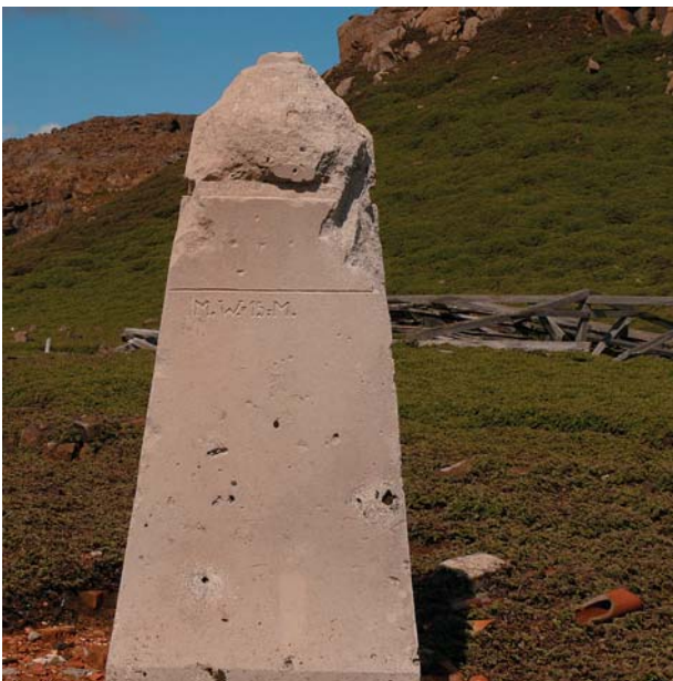
Abb. 11: Detailaufnahme des noch stehenden Passagesteins. Die Inschrift und die grobe Bearbeitung der Spitze sind gut zu erkennen.

Während der Grabung wurde intensiv nach Inschriften oder anderen Texten gesucht, die über die Geschichte des Siedlungsplatzes Auskunft geben könnten. Auf dem stehenden Passagestein konnte man die Inschrift „M.W. = 15.-M.“ sehr gut lesbar finden. Mangels einer plausibleren Idee wurde während der Grabung gemutmaßt, dass damit „Mittlerer Wasserstand = 15 Meter“ gemeint war. Gestützt wird diese These dadurch, dass sich die Steine tatsächlich etwa 15 m über dem Meeresspiegel befinden und sie mit 15 m auch auf der deutschen Karte der Stationsumgebung als Höhenangabe vermerkt sind. Auf einigen Holzresten des Stationshauses fand sich die Inschrift „K.L.“, deren Bedeutung bis jetzt ungeklärt ist. Es ist jedoch aus einem Brief bekannt, dass J. Enzensperger den Verlust einer Kiste mit der Kennzeichnung „K.L. 11“ (TARIQ) bemerkte. Die Abkürzung „K.L.“ ist also im Zuge der ersten deutschen Südpolarexpedition nicht ungebrauchlich gewesen und ist somit ein weiteres Indiz, dass das Stationshaus aus dieser Zeit stammt. Außer einiger Bundeszeichen am Stationshaus sind keine weiteren Inschriften an den Gebäuden bekannt.