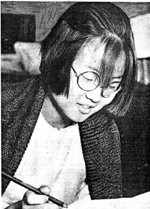
...Маленькая, хрупкая с нежным личиком и бесстрашными решительными глазами...