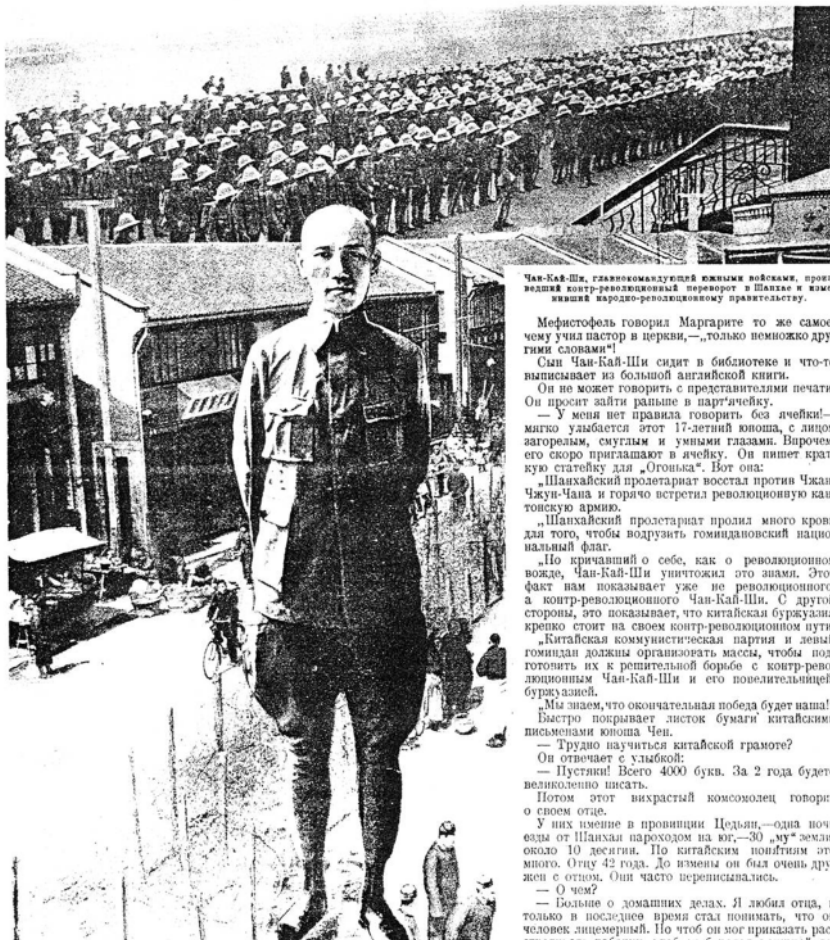
Чан-Кай-Ши, главнокомандующий южными войсками, проводивший контр-революционный переворот в Шанхае и изменивший народно-революционному правительству.

Медведь говорил Маргарите то же самое, чему учил пастор в церкви, — „только невозможно другими словами!“