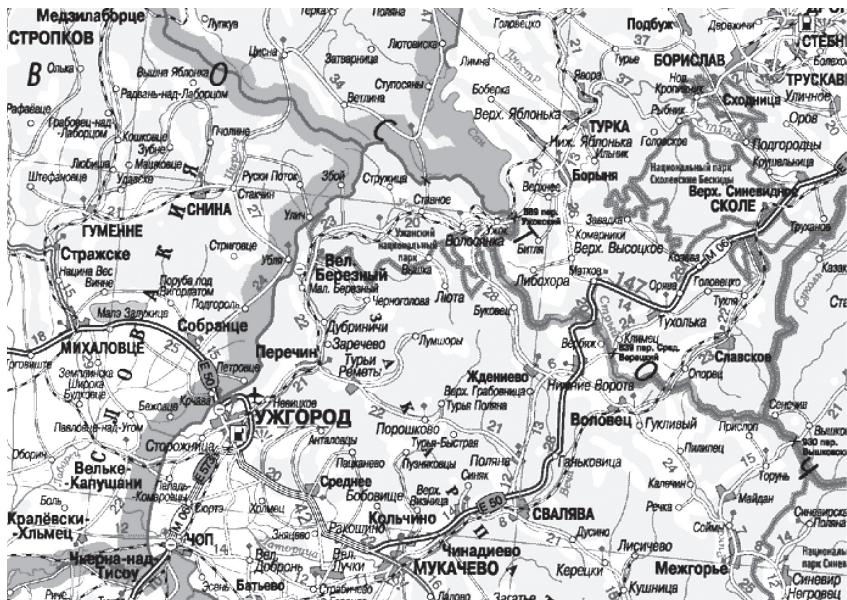
Рис.1. Фрагмент карти Закарпаття з позначенням на ньому містечком Сколе.