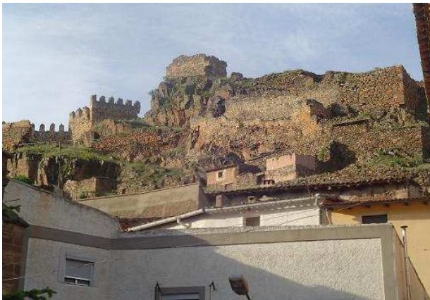
Vista de la fortaleza desde el pueblo, 20/05/2007