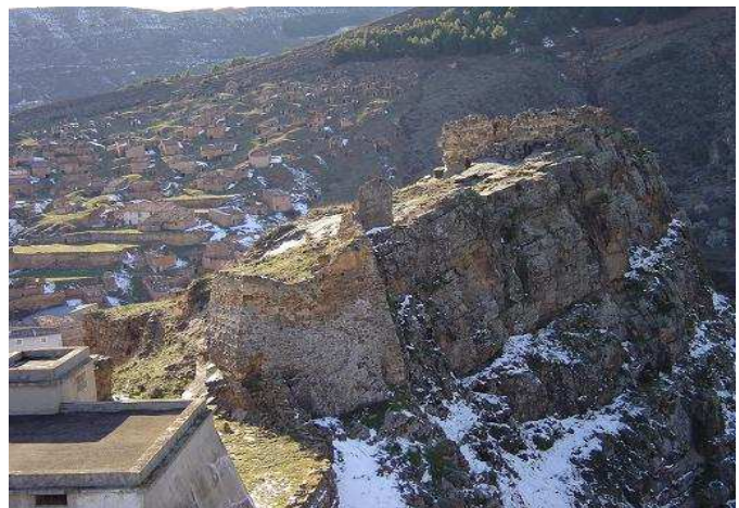
Vista del castillo, 29/02/2004