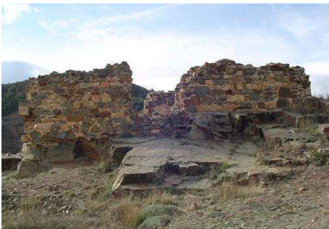
Recinto superior del castillo, 21/03/2006