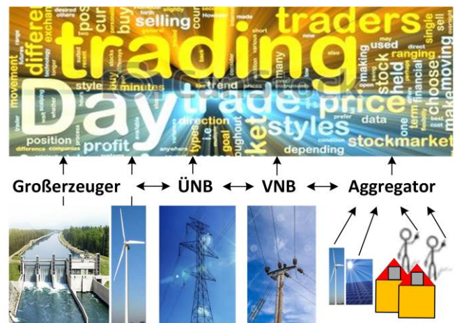
Flaches Geschäftsmodell der Elektrizitätswirtschaft

dem LINK-Paradigma. Das LINK-Paradigma ermöglicht, die Komplexität der Stromversorgungssysteme zu verstehen und deren Betriebsprozesse zu modellieren. Es inkludiert a) elektrische Komponenten – das können Teile des Netzes, speichernde bzw. stromproduzierende Einheiten sein – weiters b) eine Regelungseinheit sowie c) eine Schnittstelle.