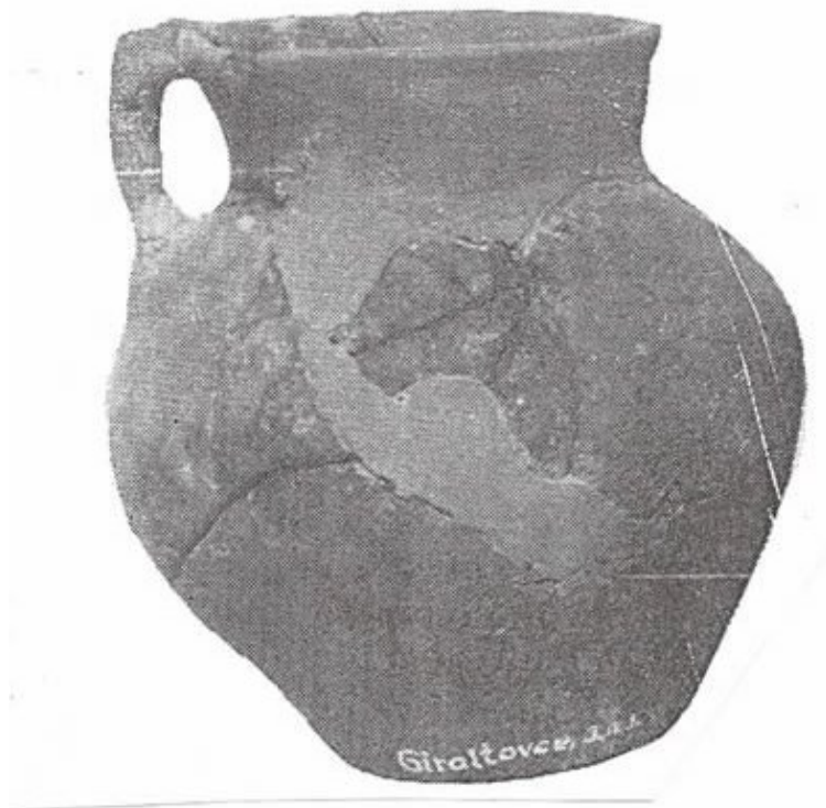
Keramika z neskorej doby kamennej nájdená v mohyle v Giraltovciach