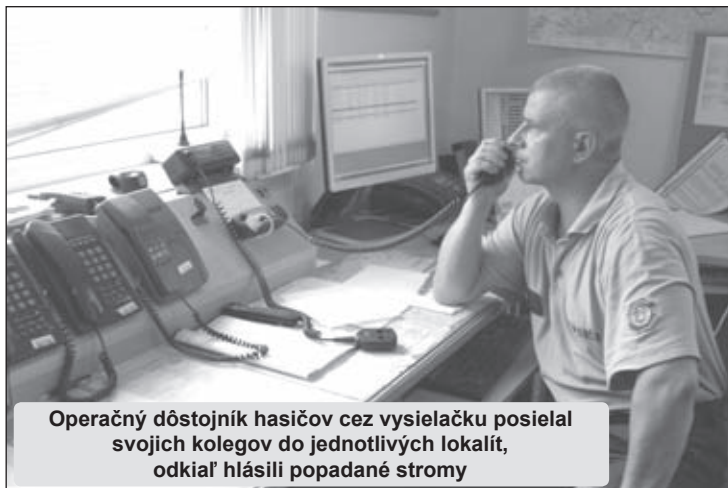
Operačný dôstojník hasičov cez vysielaciu posielal svojich kolegov do jednotlivých lokalít, odkiaľ hlásili popadané stromy