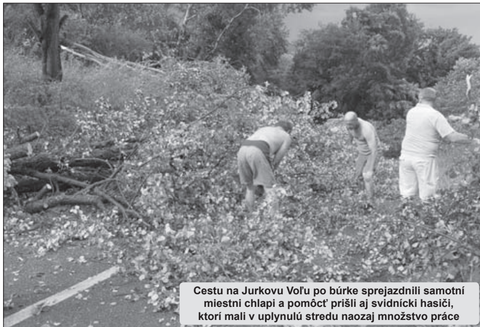
Cestu na Jurkovu Volu po búrke sprejzdňili samotní miestni chlapi a pomôcť prišli aj svidnícki hasiči, ktorí mali v uplynulú stredu naozaj množstvo práce