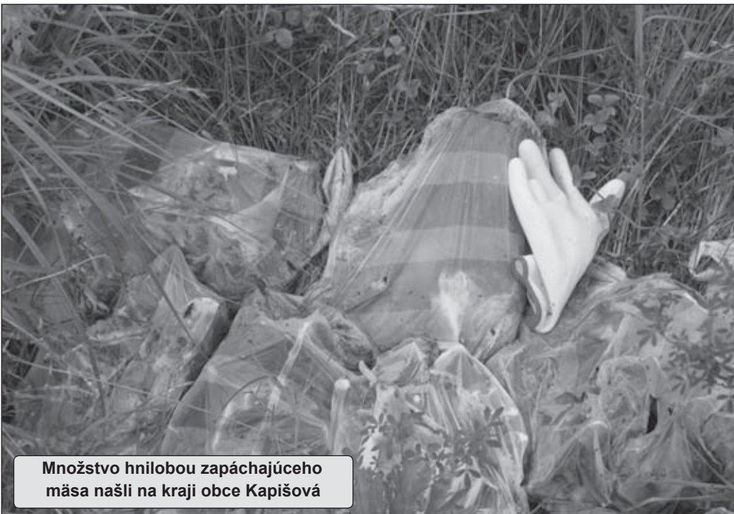
Množstvo hnilobou zapáchajúceho mäsa našli na kraji obce Kapišová