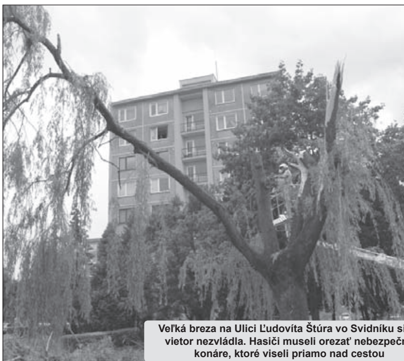
Veľká breza na Ulici Ľudovíta Štúra vo Svidníku silný vietor nezvládla. Hasiči museli orezať nebezpečné konáre, ktoré viseli priamo nad cestou