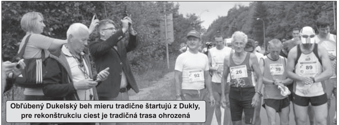
Obľúbený Dukelský beh mieru tradične štartujú z Dukly, pre rekonštrukciu ciest je tradičná trasa ohrozená