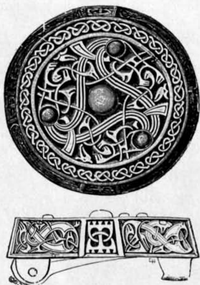
Fig. 3. Förgylld bronsfibula. Rikvide, Närs socken, Gotland. 1/1. — Gilded bronze fibula.

nitarna på var sin sida om nitparen något längre ut mot periferien än dessa en nit (av en blott hål), vilka 4 nitar bilda en rektangel. För övrigt ett nithål osymmetriskt framför den ena av gångjärnssidans nitpar. Botten har 5 nithål korresponderande med lockets mittnit och rektangelställda nitar. Hur dessa nitar fungerat kan icke sägas. Såväl lock som botten ha fyrdubbla kantlinjer.