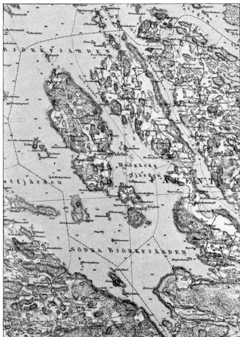
Fig. 1. Karta över Adelsö och Björkö jämte omgivningar. Efter Generalstabens kartblad Stockholm.