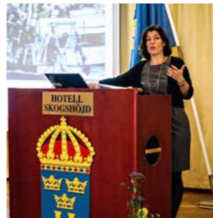
Försvarsminister Karin Enström besökte tinget på lördagen. Även hon fick många frågor från delegaterna.

När själva tingsförhandlingarna öppnades under högtidliga former på lördag eftermiddag av rikshemvärnschefen, tillika ordförande för tinget, gick det snabbt undan med de första motionerna. Motionerna om att tillåta att GSS/T - soldater placeras som extra hemvärnssoldater