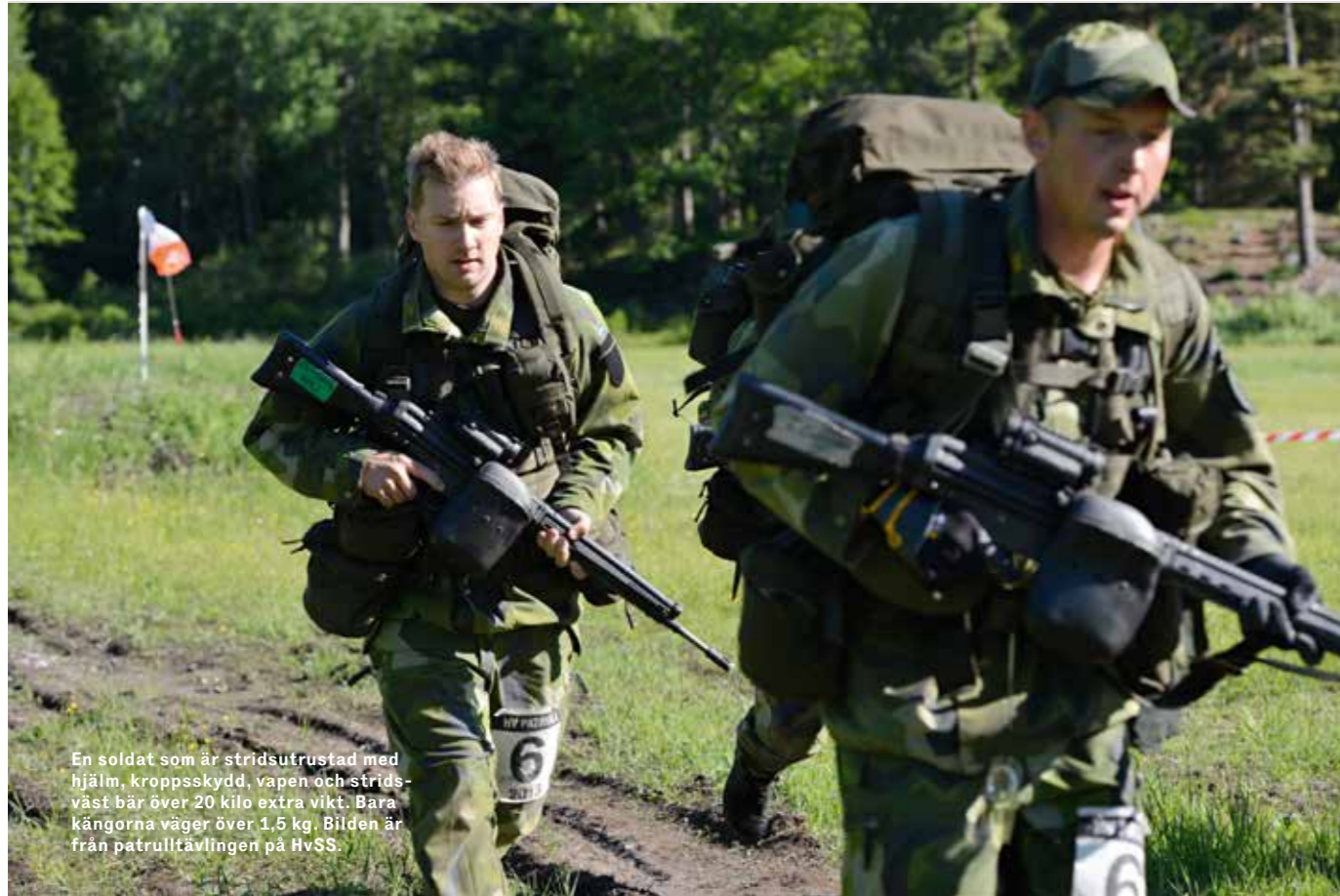
En soldat som är stridsutrustad med hjälm, kroppsskydd, vapen och stridsväst bär över 20 kilo extra vikt. Bara kängorna väger över 1,5 kg. Bilden är från patrulltävlingen på HvSS.