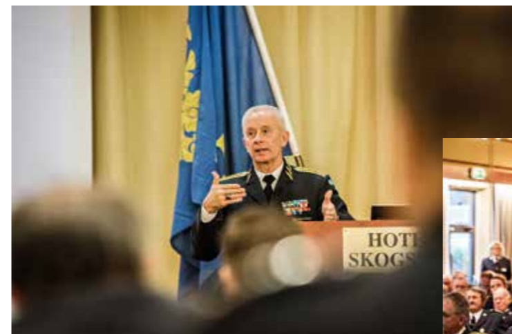
Överbefälhavaren Sverker Göranson talade om hemvärnets betydelse och dess framtid.