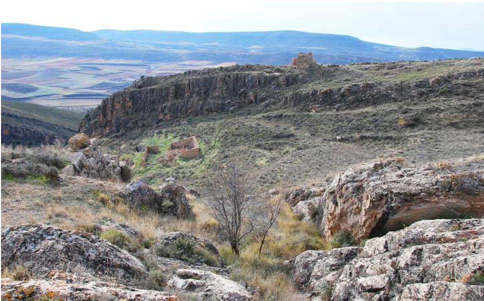
En primer plano vista del foso excavado en la roca