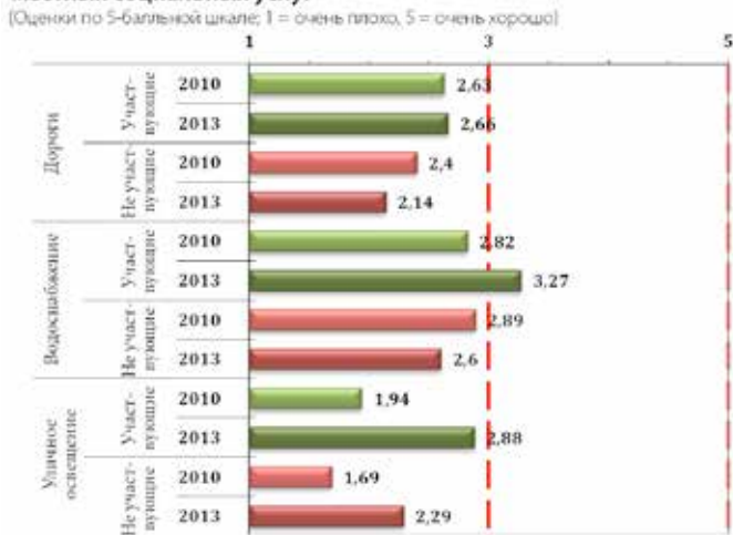
Рисунок 2. Степень удовлетворенности населения качеством местных социальных услуг