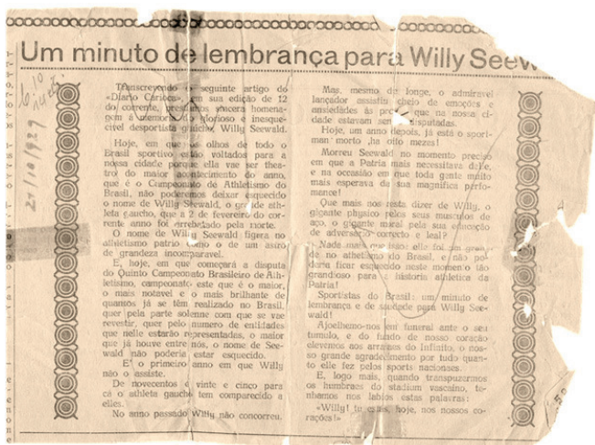
Figura 7. Reportagem de jornal do Rio de Janeiro publicada em homenagem ao atleta Willy Seewald, após seu falecimento no ano de 1929.

quanto em crônica publicada num jornal carioca e, posteriormente, reproduzida no jornal de São Leopoldo (conforme FIGURA abaixo).