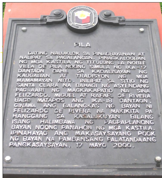
Larawan 4. NHI Marker

makabagbag-damdaming pagsusumamo sa Maynila na pansamantalang mamalagi sa kanilang bayang sinilangan. Sa isang dokumentong nag-uumpaw sa damdamin, isiniwalat nila ang kanilang “mapait na kalituhan at pangungulila” at ang “pagkawala ng kanilang sinaunang pag-ibig.” Nagsilbi itong isang sikolohikal na katarsis para sa kanila, sapagkat hindi naman pinakinggan ang kanilang pakiusap. Gayunpaman, ito ang pinakamalungkot na bahagi ng buong kalipunan ng mga dokumento hinggil sa paglipat ng bayan na hanggang ngayo’y mainam na nakatago sa Sinupang Pambansa, sumisira sa nakababagot na paulit-ulit na posisyon ng mga kalalakihan sa magkabilang panig ( Ibid. ).