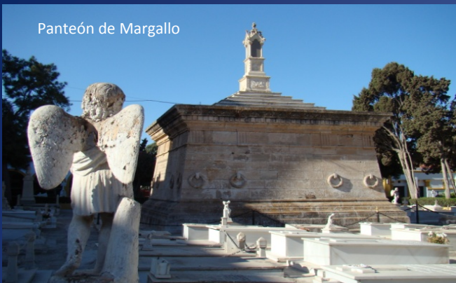
Panteón de Margallo

1.Panteón de Margallo. Finalizado en 1896. Construido por suscripción popular nacional. Acoge a los fallecidos en la Campaña de 1893 (descansan los restos del Gral. Margallo , laureado de San Fernando) y de 1909 ( Gral. Pintos , y restos anónimos rescatados del Barranco del Lobo en fosa común. En su capilla interior y sótano, con 37 nichos , siete Caballeros Laureados.