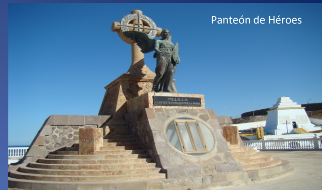
Panteón de Héroes

7.Panteón de Héroes. Construido con el remanente que cedió la Asociación de Señoras Caritativa de la cuestación popular realizada para el cuidado de los heridos de la campaña de 1909. En 1911 SM el Rey Alfonso XIII coloca la primera piedra. Fue bendecido en 1915. Consta de 80 nichos con 163 fallecidos, una fosa interior con los restos de 2.997 fallecidos, exhumados de la cruz de Monte Arruit, trasladados en 1949. En el exterior, a su pie dos fosas con posibles restos de fallecidos cristianos y musulmanes de las campañas de África. Está coronado en planta superior con diversas sepulturas y un ángel alado realizado en Alemania, colocado en 1924. Veintidós Caballeros Laureados.