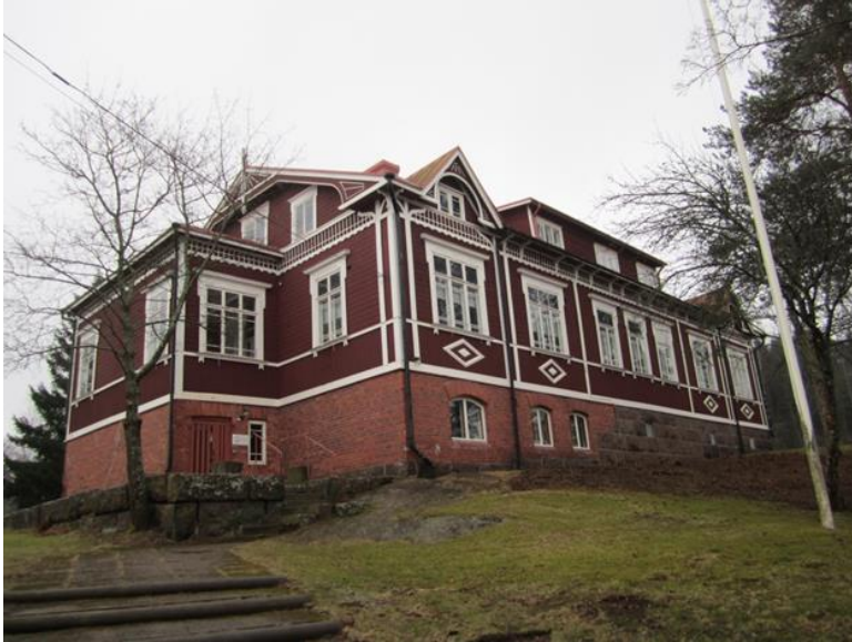
Kuvio 2. Vuonna 1902 vihitty Porvoon synnytyslaitos. Nykyisin Porvoon Retkeilymaja – Porvoo-Hostel. Kuva: Paula Vuorenniemi 8.3.2015.

Senaatin päätöksellä synnytyslaitos sai valtionapua 5000 mk vuosittain viiden vuoden ajan, minkä jälkeen summa nousi 6000 mk vuodessa. Synnytyslaitos sitoutui tarjoamaan vastaavasti viisi vapaapaikkaa varattomille synnyttäjille vuosittain. (Östra Nyland 1903: 3; Finlands Allmänna Tidning 1907: 1.) Laitos sai rahalahjoituksia vuosien varrella myös kaupungilta, Säästöpankilta, anniskeluyhtiön voittovaroista ja yksityisiltä henkilöiltä. Lahjoittajien nimet ja rahasummat Forsius julkaisi synnytyslaitoksen vuosikatsauksen yhteydessä esimerkiksi Borgåbladetissa. (Forsius 1903: 4.)