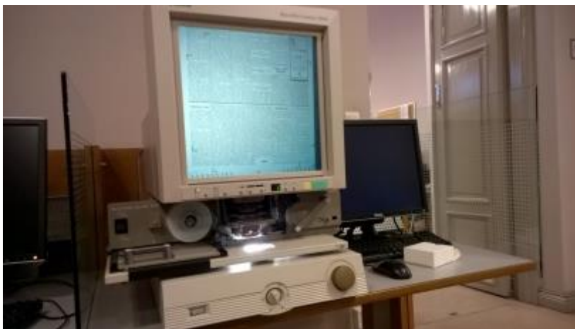
Kuvio 1. Mikrofilmin lukulaite. Kansalliskirjasto.