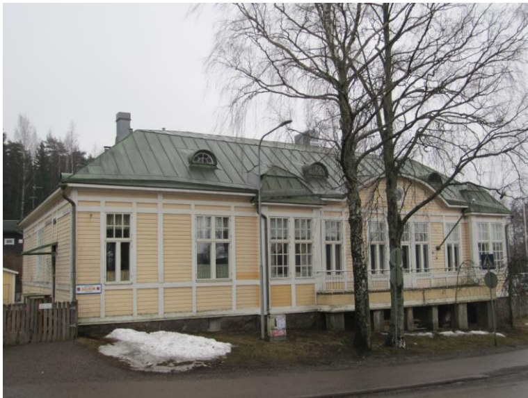
Kuvio 4. Vuonna 1914 vihitty suojakoti Solhem. Nykyisin Pelastusarmeijan päiväkotia Solhem. Kuva: Paula Vuorenniemi 8.3.2015

Äiti-lapsikodin hirret saatiin lopulta kokoon lahjoituksina. Kun isännät tulivat hakemaan synnytyslaitokselta poikavauvaansa, he saivat tuoda lahjaksi kaksi hirttä ja tyttövauvasta yhden hirren. Kaunis ja komea hirsirakennus valmistui vähitellen synnytyslaitosta vastapäätä, mutta odottamattomat vaikeudet pakottivat Forsiuksen luovuttamaan tämän yksityishankkeensa pois. Entisenä pelastusupseerina hän mieluiten luovutti sen Pelastusarmeijalle, joka kiitollisuudella vastaanotti tarjouksen huhtikuussa 1914. Suuri päärakennus, johon kuului 4 makuuhuonetta, sairashuone, lasten päivähuone, ruokaja työsalit, toimisto, kylpyhuone, keittiö ja kolme parvekettä olivat valmiit. Pelastusarmeijalle jäi tehtäväksi kodin sisustaminen ja ulkorakennusten pystytys. (Borgåbladet 1914: 3; Nieminen 1989: 114; Könönen 1964: 243.)