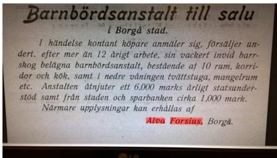
Kuvio 3. Synnytyslaitoksen myynti-ilmoitus (Tidskrift för barnmorskor i Finland 1.3.1912). Kansalliskirjasto.