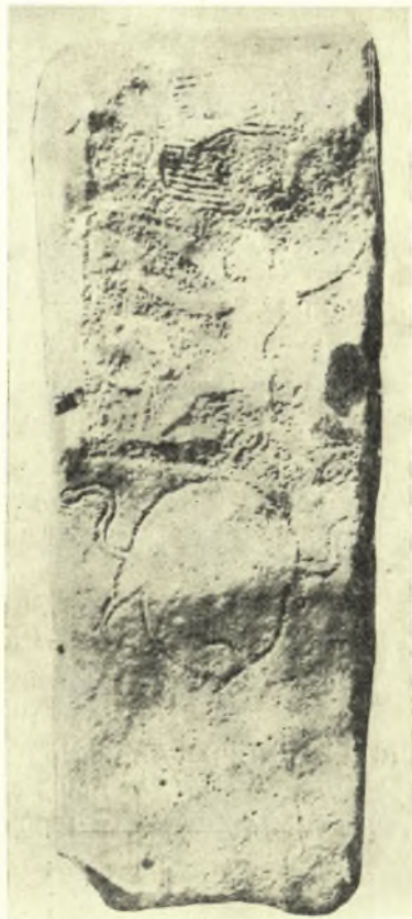
Εἰκ. 4. Στήλη ἐκ Δρήρου (ὑπ' ἀρ. 1).

1 Ἐν ἔτει 1932 ὁ καθηγ. P. DEMARGNE ἔφε- ρεν εἰς φῶς κατὰ τὴν διάρκειαν τῶν ἐν Δρήρῳ ἀνασκαφῶν του μίαν στήλην 2 (εἰκ. 4) (ὑπ' ἀρ. 1)