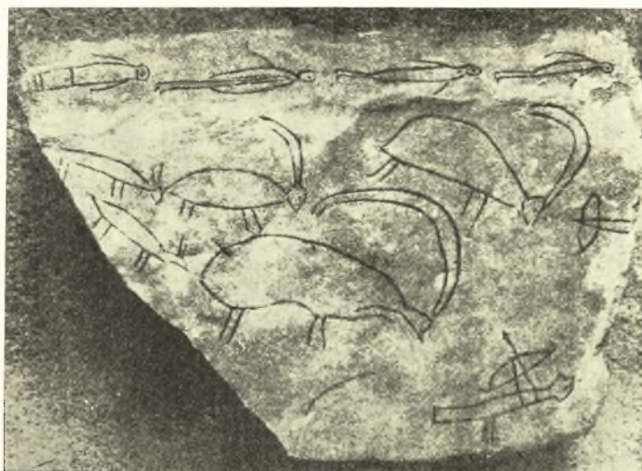
Εἰκ. 5. Λίθος ἐκ Δρήρου (ὑπ' ἀριθ. 3).

Ἡ πιθανὴ λοιπὸν χρησιμοποίησις τῶν πλακῶν τῆς Κορφῆς τ' Ἀρωνιοῦ εἰς μίαν ἐπιμήκη ζωφόρον εἶναι ἐν πρόσθετον στοιχεῖον ἐπιτρέπον ἀναμφισβητήτως καὶ τὴν χρονολόγησιν αὐ-