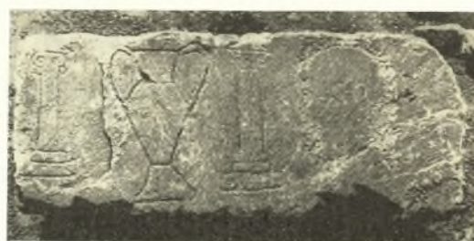
Εἰκ. 7. Λίθος ἐκ Δρήρου (ὑπ' ἀρ. 5).

ἔχομεν ἐν σύνολον ἀνάλογον πρὸς τὰς παλαιότερας ζωγραφίας τῆς Εὐρώπης καὶ τῆς Ἀφρικῆς, δὲν σημαίνει ὅτι πρέπει νὰ παρίδωμεν τὸν ἔθνη καὶ τὴν σωματικότητα τῶν παρασταθεισῶν μορφῶν. Ἐκτὸς τῆς σημειωθεῖσης σχηματοποιήσεως καὶ τινος γεωμετρικοποιήσεως