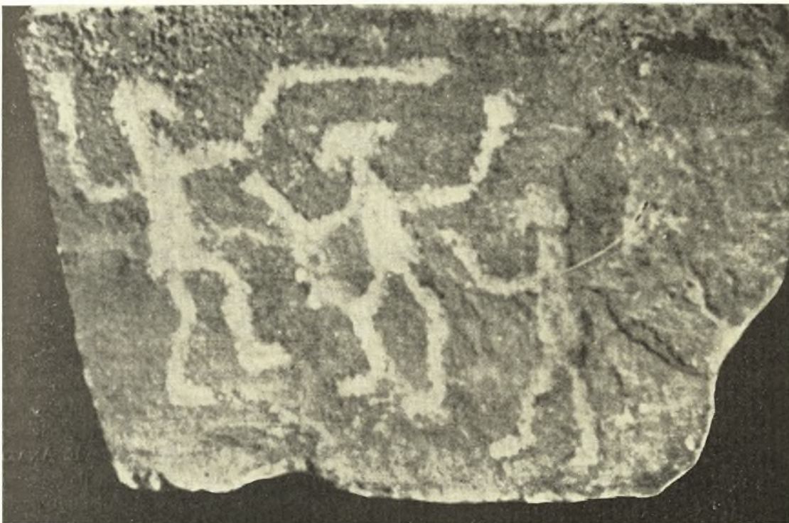
Εἰκ. 1. Μαρμαρίνη πλάξ ἐκ Νάξου.

κ. Χρ. ΝΤΟΥΜΑΣ* διενήργησε τὴν δέουσαν ἀνασκαφικὴν ἔρευναν εἰς τὴν Κορφὴν τ' Ἀρωνιοῦ, ἣτις καὶ ἀπέδωκεν ἄλλας τρεῖς τὸν ἀριθμὸν μαρμαρίνας πλάκας, εὐρεθείσας ὁμοίως ἐν τῇ χαρακτηριστικῇ τάφρῳ (ἀναλημματικὸς τοῖχος), τῇ συγκρατούσῃ τὴν ἐπίχωσιν, ἐντὸς τῆς ὁποίας εὐρέθησαν ἀπὸ βάθους 0.60 μ. καὶ κατωτέρω ὄστρακα χονδρῶν ἀγγείων χαρακτηρισθέντων ὡς καταγομένων ἐκ τῆς πρώτης περιόδου τοῦ Χαλκοῦ (εἰκ. 1—2) 1 .