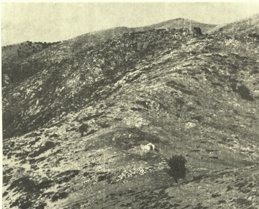
Εἰκ. 1. Ἀποψὶς τοῦ ναοῦ τοῦ Ἁγ. Πέτρου καὶ τῆς ἀνατολικῶς αὐτοῦ ἀρχαίας θεμελιώσεως.

παρ' αὐτὸν (περὶ τὰ 20 μ. πρὸς Α. αὐτοῦ) ἐρεῖπια ἀρχαίου οἰκοδομήματος (εἰκ. 1 - 4), ὀλίγον δὲ ἀνατολικώτερον καὶ ὑψηλότερον αὐτῶν φυσικὴ πηγὴ, γνωστὴ ὡς Πλάκα ἢ Πασσόνερο