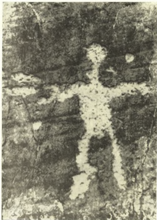
Εἰκ. 3. Παράστασις ἐκ Monte Bego.

λαμβάνουσαι πλέον τοῦ ἑνὸς πρόσωπα) ἀνήκουσιν ἐν πολλοῖς εἰς τὴν 1ῃν χιλιετηρίδα π.Χ. Εἶναι δὲ κατὰ τοῦτο ἀνάλογοι αἱ παραστάσεις τῶν ναξιακῶν πλακῶν πρὸς τὰς συνθετικὰς παραστάσεις τῶν Ἀλπεων, διότι ἀναφέρονται εἰς πολυπρόσωπους σκηνὰς κυνηγίου καὶ ἄλλων ἐκδηλώσεων τοῦ ἀνθρωπίνου βίου.