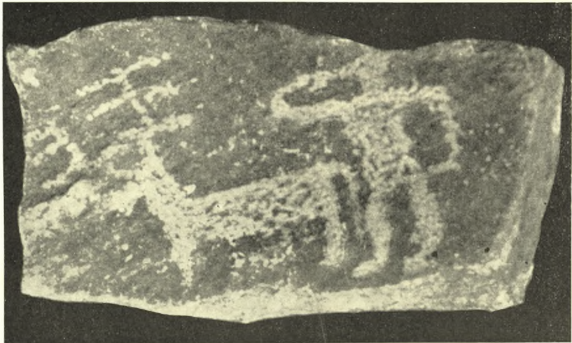
Εἰκ. 2. Μαρμαρίνη πλάξ ἐκ Νάξου.

αἵτινες ὅμως πόρρω ἀπέχουσι τῆς ὑπ' αὐτοῦ δεκτῆς γενομένης χρονολογίας κατὰ τοὺς Πρωτοκυκλαδικοὺς χρόνους διὰ τὰς ἐγχαράκτους μαρμαρίνας πλάκας τῆς Κορρῆς τ' Ἀρωνιοῦ. Οὕτως ὁ ΡΙΤΤΙΟΝΙ 2 ἀποκρούει καθ' ὀλοκληρίαν τὰς ὑπὸ τῶν G. ISETTI καὶ E. ANATI προταθείσας ὑψηλὰς χρονολογίας, ἀκόμη καὶ διὰ τὰς δύο πρώτας φάσεις, τῶν παραστάσεων τῶν Παραθαλασσίων Ἄλπεων ὡς ἀναποδείκτους. Τούτων αἱ νεώτεραι ἐξικνουῦνται 4 μέχρι