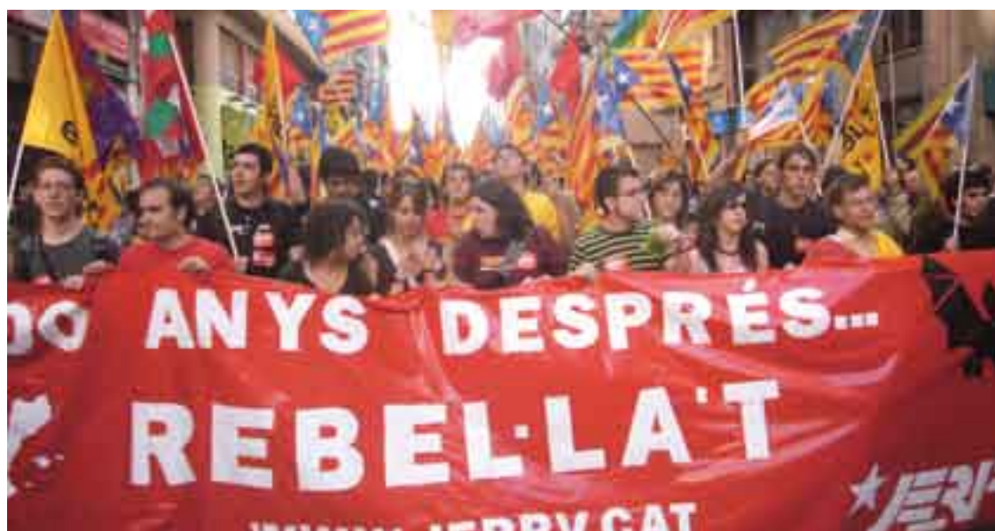
↑ Les JERPVS es van manifestar amb el lema «300 anys després... rebel·la't».