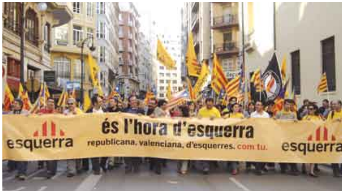
↑ Encapçalament del bloc d'Esquerra. El més nombrós que mai es recorda.