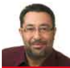
Gervasi Aspa Alcalde de Deltebre

Ser alcaldessa suposa un nou repte a la meua vida, el qual afronto amb molta il·lusió i amb ganes de treballar, amb el meu equip, per vetllar pels problemes i les necessitats que puguin sorgir en el municipi i per trobar-hi solucions satisfactòries. També suposarà un alt grau de responsabilitat i compromís, pel fet de representar el municipi i els seus habitants arreu del territori i davant les institucions.