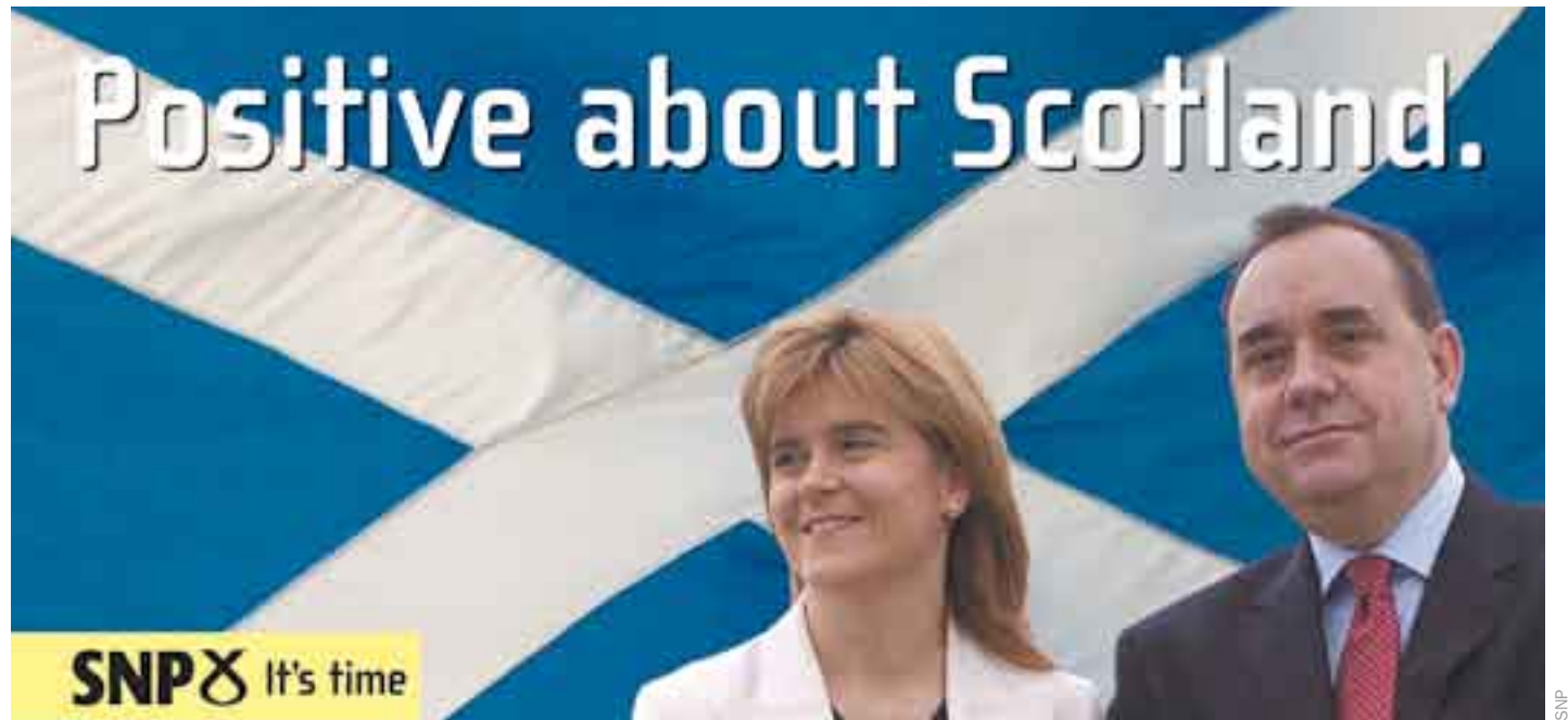
↑ Nicola Sturgeon i Alex Salmond, líders de l'SNP, en un cartell electoral amb consignes favorables a la independència.

A Escòcia, el terme independència no fa por, ni tampoc desperta reaccions visceralment. A diferència de Catalunya, sempre ha tingut resolt el problema de la identitat nacional. Ells són escocesos i volen el millor per al seu país. Així, doncs, la feina de l'SNP és convèncer els ciutadans del que per a l'SNP és una obvietat, la independència significa progrés. L'experiència dels petits estats independents veïns ens ho demostra: la petita Irlanda ha esdevingut el miracle econòmic d'Europa; Islàndia, amb només 300.000 habitants, és la quarta economia més competitiva del món. I Noruega, amb quatre milions i mig d'habitants, ha esdevingut, per sisè cop consecutiu, el país amb millor nivell de vida del món, segons les Nacions Unides. La diferència entre Escòcia, i Catalunya, i aquests altres països és que ells són estats independents i, per tant, poden escollir allò que més els convé, mentre que Escòcia i Catalunya no. Independència política només vol dir que un