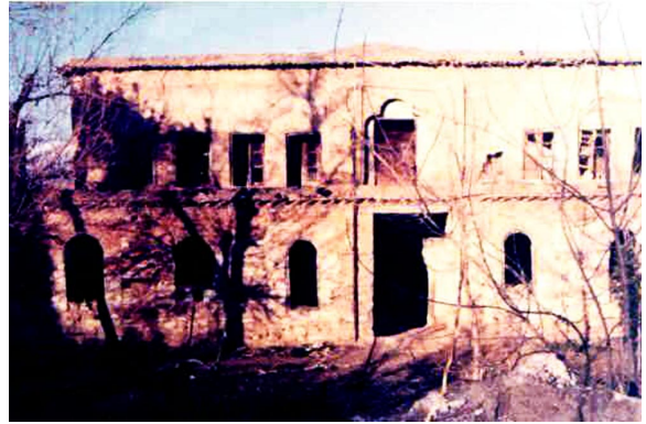
مالي وهسمان پاشای جاف له شاری هه له بجه

ئهحمده موختاردا نووسيو به تي: "شاعيري به ناوبانگ خواليخوشبوو ئهحمده موختار بهگ...". (ديواني ئهحمده موختار جاف، ۱۹۶۰، ۳)، نهجمه ددين مه لايش (۱۸۹۲-۱۹۶۹) نووسيو به تي: "ئهحمده موختار بهگي جاف كورپي وهسمان پاشاي ره ئيسسي عه شيره تي جافه، ئهحمده موختار بهگ...". (سۆزي نيشتمان، ۱۹۴۲، ۳۷۷)، ههروه ها نهجمه ددين مه لا له دهستنووسيو كي تردا نووسيو به تي: "ئهحمده موختار جاف: ئهحمده موختار بهگ كورپي عوسمان پاشاي جافه (احمد موختار بهگ)". (ميناى شكهسته، ب ۳، ۵۰۸)، به لام هه رچي ماموستا (عه لائه ددين سه جادي) شه (۱۹۰۷-۱۹۸۴) نووسيو به تي: ناوي "ئهحمده و كورپي وهسمان پاشاي جاف... ه"، (ميژووي ئه ده بي كوردي، ۱۳۹۵، ۵۲۴). د. مارف خه زنه داريش (۱۹۳۲-۲۰۰۷) ژياننامه ي شاعيري له (ميژووي ئه ده بي كوردي) به كه ي (عه لائه ددين سه جادي) به وه وه رگرتووه و له باره به وه ده نووسيت: ("ئهحمده موختار" ناويكي ليك دراوه، له كوئه وه "موختار" بوو به نازناو و سيفهت بو ناوي "ئهحمده" كه به كيكه له ناوه كاني پيغه مبه ر، ئيتر له دواي ئه مه موختار بو هه موو "ئهحمده" يك به كار هيتراوه، به تا به تي له كوئه لي عوسمانيدا...). (ميژووي ئه ده بي كوردي، ب ۵، ۲۰۰۵، ۴۵۱).