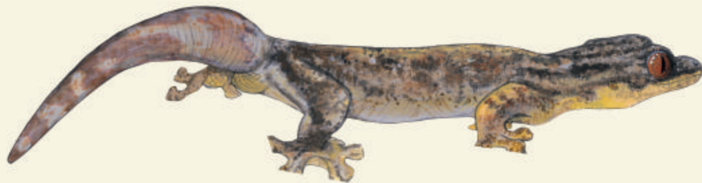
Thécadactyle à queue épineuse Gran mabouya