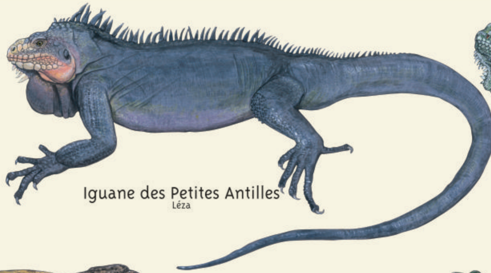
Iguane des Petites Antilles Léza