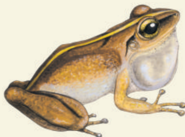
Hylode de la Martinique Gounouy