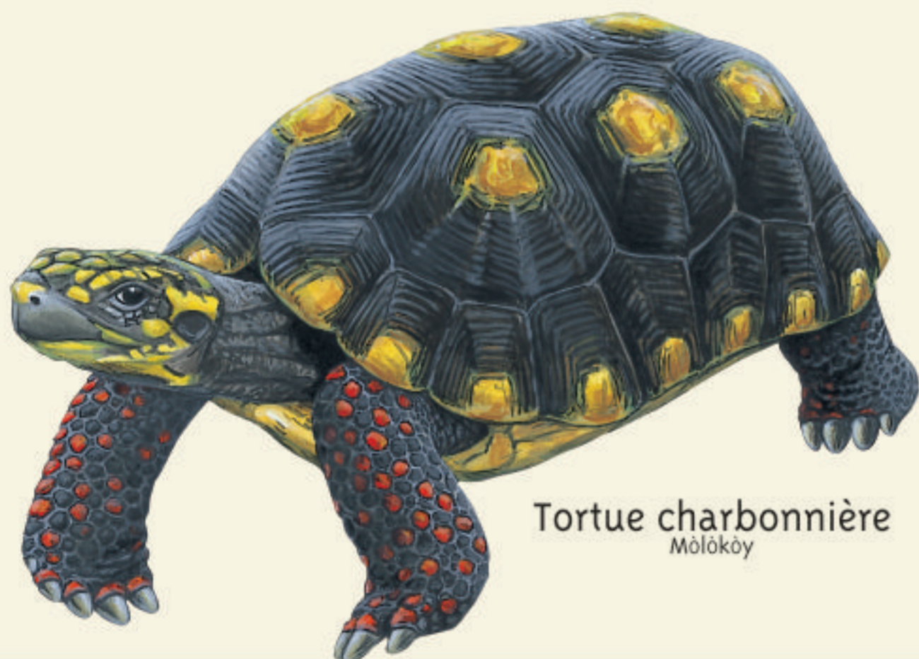
Tortue charbonnière Mòlòkòy