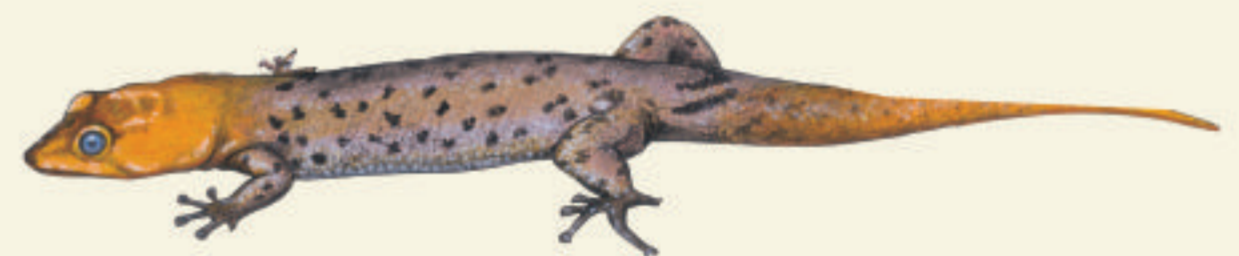
Sphérodactyle de Saint-Vincent Ti mabouya

TOUS LES REPTILES ET AMPHIBIENS SONT PROTÉGÉS EN MARTINIQUE EN VERTU DE L'ARRÊTE MINISTÉRIEL DU 17 FÉVRIER 1989 À L'EXCEPTION DU FER DE LANCE ET DE L'IGUANE VERT. SONT INTERDITS EN TOUT TEMPS, LA DESTRUCTION, LA MUTILATION, LA CAPTURE OU L'ENLÈVEMENT, LA NATURALISATION, QU'ILS SOIENT VIVANTS OU MORTS, LEUR TRANSPORT, LEUR COLPORTAGE, LEUR UTILISATION, LEUR MISE EN VENTE, LEUR VENTE OU LEUR ACHAT.