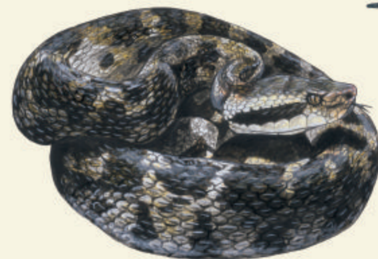
Trigonocéphale Fer de lance