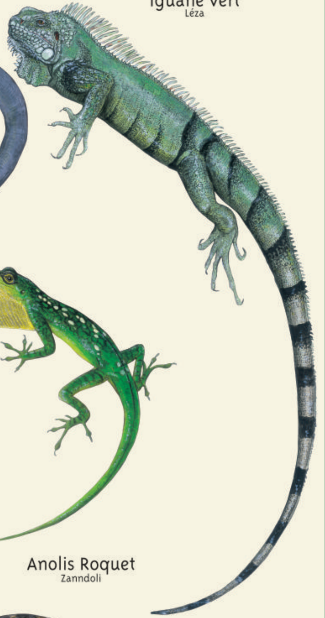
Iguane vert Léza