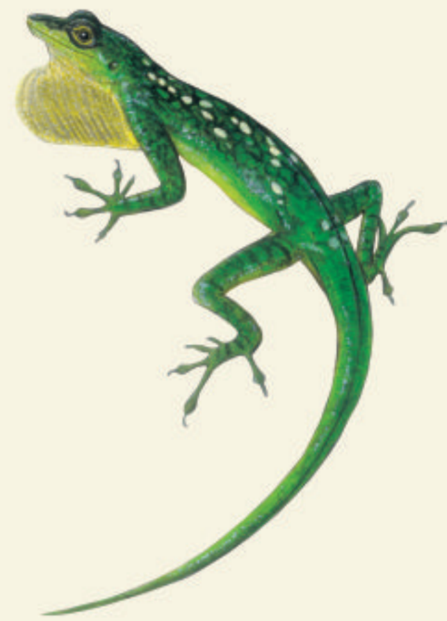
Anolis Roquet Zanndoli