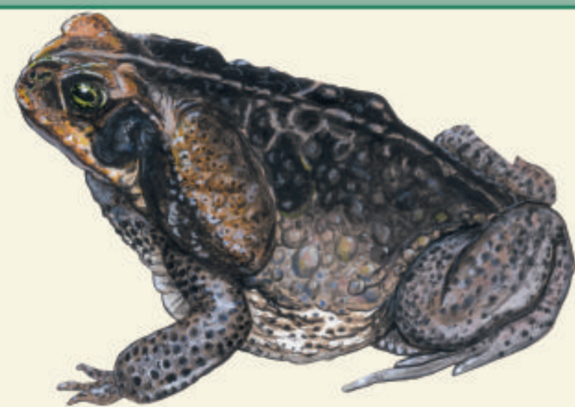
Crapaud Buffle Krapolad