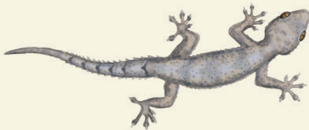
Hémidactyle mabouia Mabouya kaz