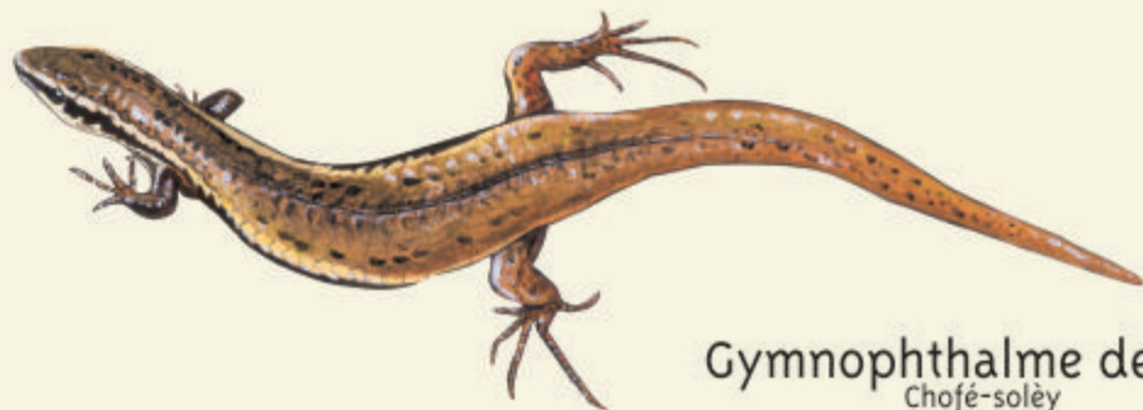
Gymnophthalme de Plée Chofé-solèy