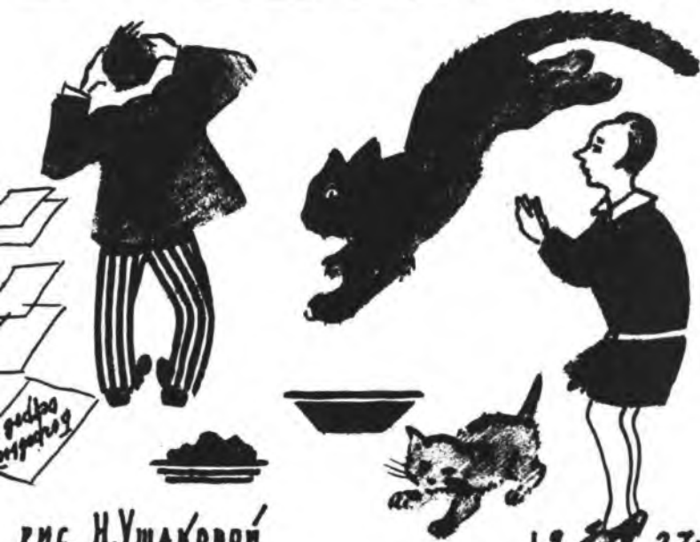
рис. Н. Ушаковой