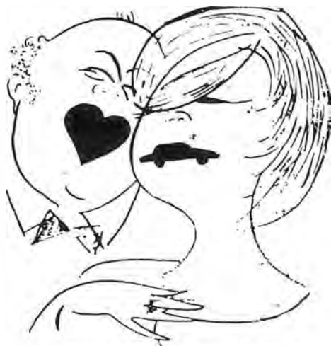
Різні погляди на любов і шлюб.