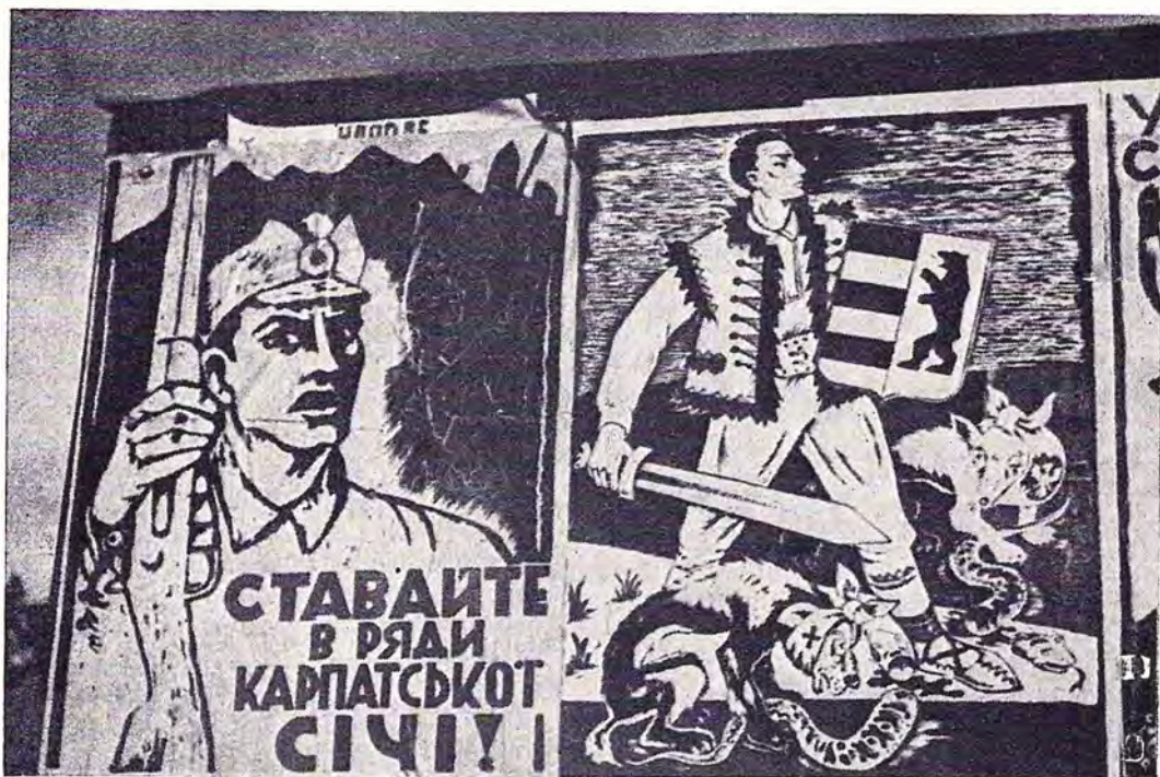
Один із пропагандивних плякатів Карпатської Січі в 1939 році.

Не легка була дорога з Нересниці до Апші. Приходилося відбувати її гористим тереном, вузькими гірськими стежками, в додатку без їжі і без відпочинку, в без-