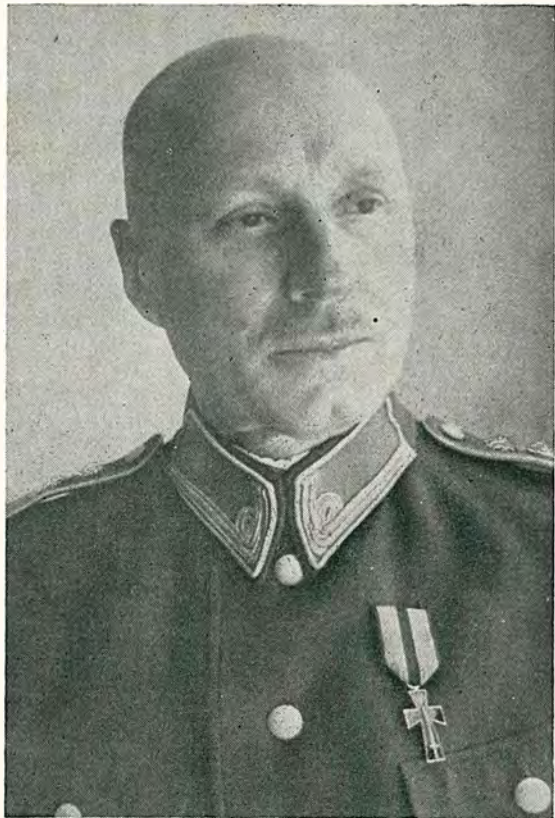
Генерал-полк. Павло Шандрук.

був частиною Комітету Об'єднаних Народів Росії, тоді я не маю про що з ним говорити. Згідно з попередньою розмовою, того самого дня я зустрівся з полк. А. Мельником, який одобрив мій крок і одверто додав: »Генерале, ви є вояк без достатнього знання політичної і діалектичної практики, Власов може вас використати«.