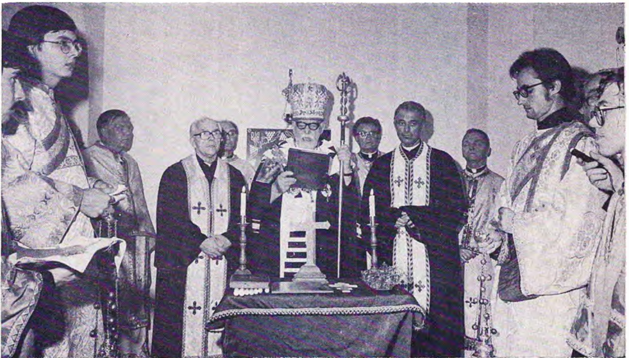
Блаженніший Патріярх Йосиф І править Панахиду за всіх поляглих за волю України.

Повагом увійшов у крипту Блаженніший Патріярх Йосиф у супроводі дякона й духовенства та почав відправляти Панахиду за всіх поляглих за волю України. Після відправлен-