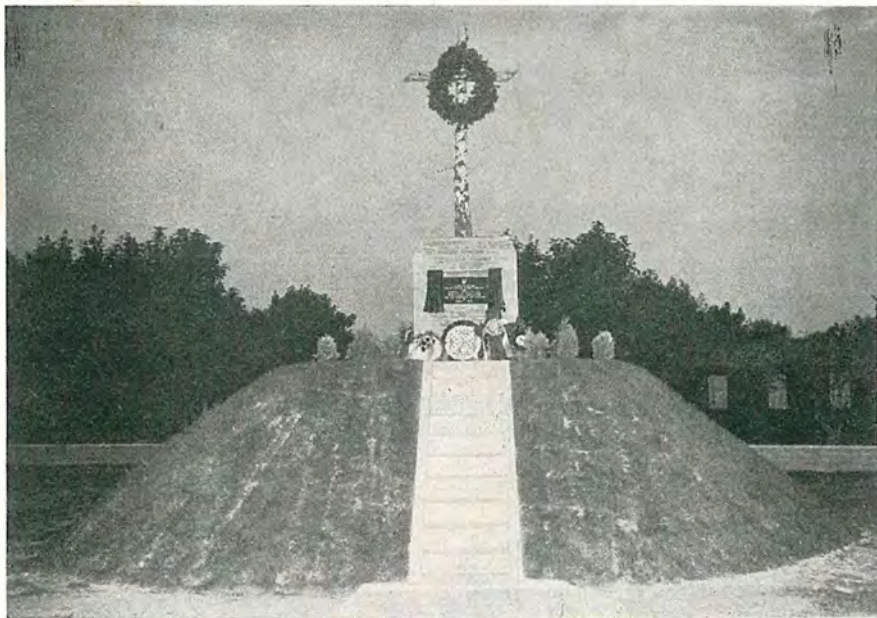
Могила-пам'ятник поляглим за волю України.