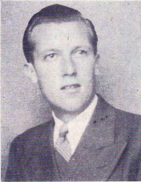
Автор цієї статті, після звільнення з полону.