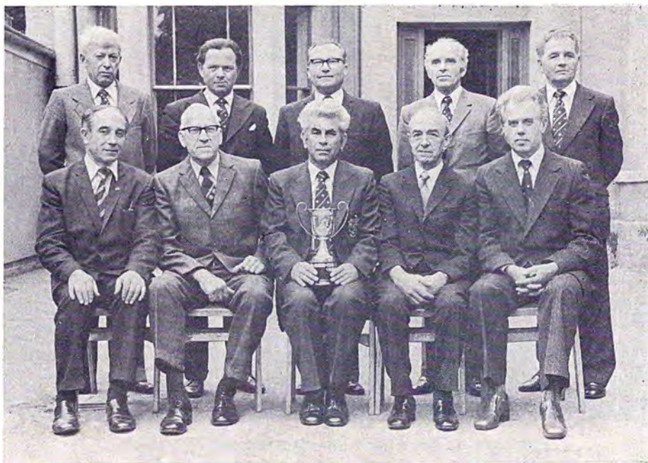
Управа Відділу ОБВУ в Ноттінггамі (1979 р.) з перехідною чашею ОБВУ.