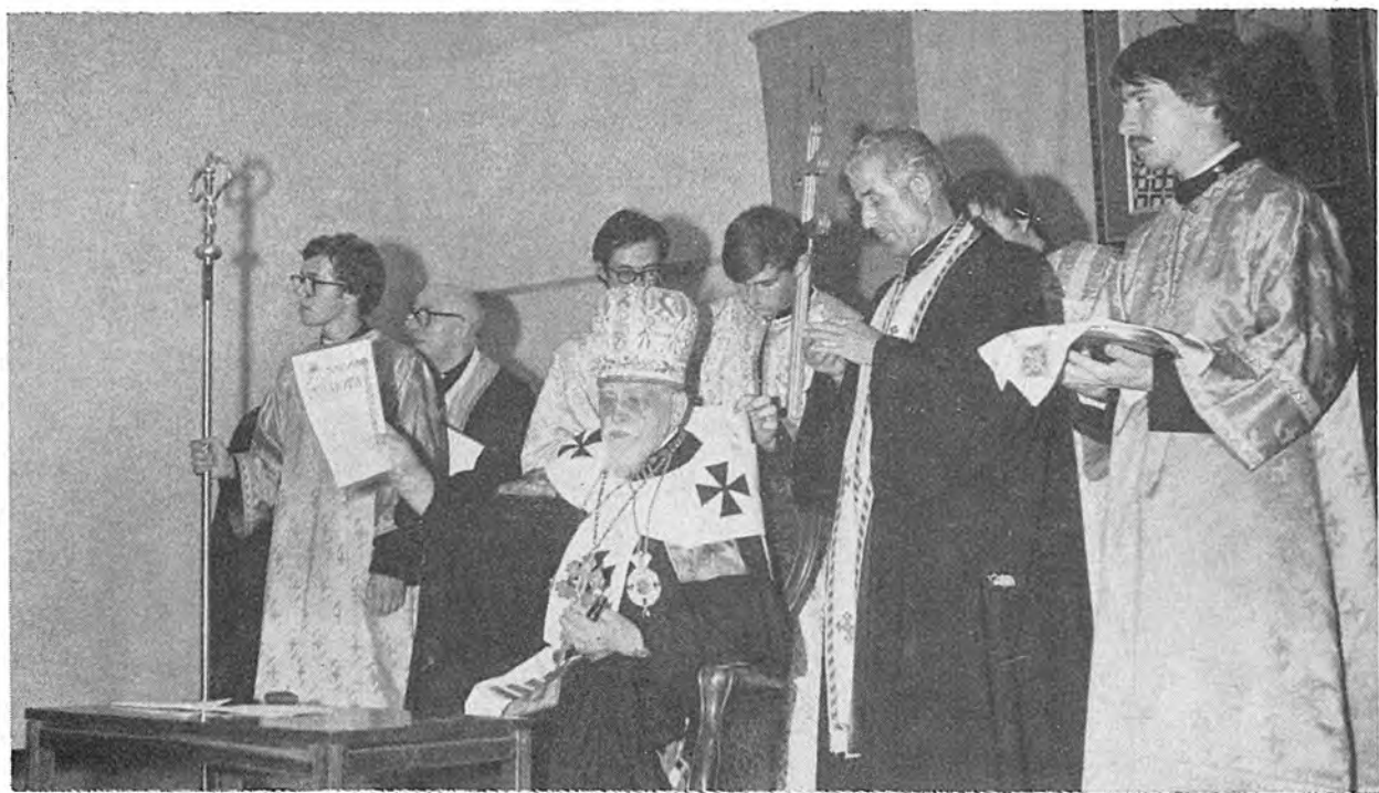
Блаженніший Патріарх показує присутнім грамоту почесного відзначення ОбВУ.