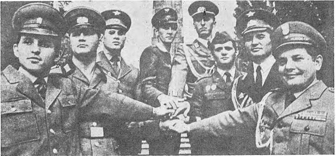
Символіка дружби молодих старшин Варшавського Пакту.

Старшини втішаються привілеями і вигодами, яких не мають решта советського суспільства. Головні чинники влади вважають, що кожний старшина має бути