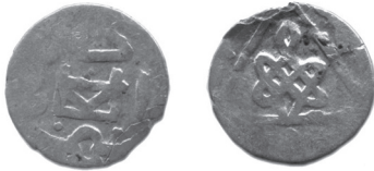
Фото 3. Улус Джучи. Срібний анонімний денг, карбований на території Кубані в період між правліннями ханів Токти і Узбека у 1312 році.