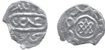
Фото 4. Улус Джучи. Срібний денг з ім'ям Абдаллаха, карбований у «Шхер Абд», знахідки якого переважають на території Таманського півострова і Північно-Східного Криму (фото з приватної колекції).