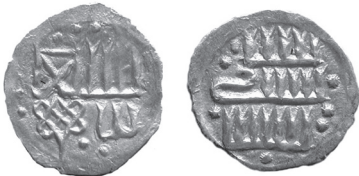
Фото 5. Київське князівство до 1362 року. Срібне «київське наслідування» джучидському денгу Джанібєка.