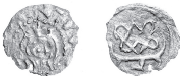
Фото 7. Велике князівство Литовське. Ягайло. Срібний денарій 1386 – 1387 рр. (фото з книги Eduardas Remecas Vilniaus žemutinės pilies pinigų lobis, Lietuvos nacionalinis muziejus, Vilnius, 2003. – С. 85 (#8.8-II)).