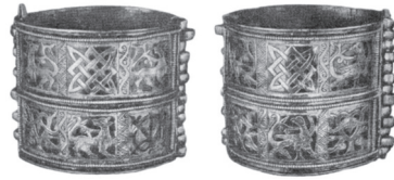
Фото 2. Браслет (обидва боки) зі скарбу в Старій Рязані. З книги Рибаківа Б. Н. «Язычество Древней Руси».