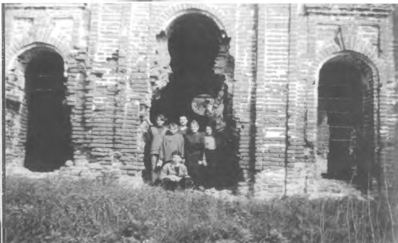
Церковь Покрова Пресвятой Богородицы