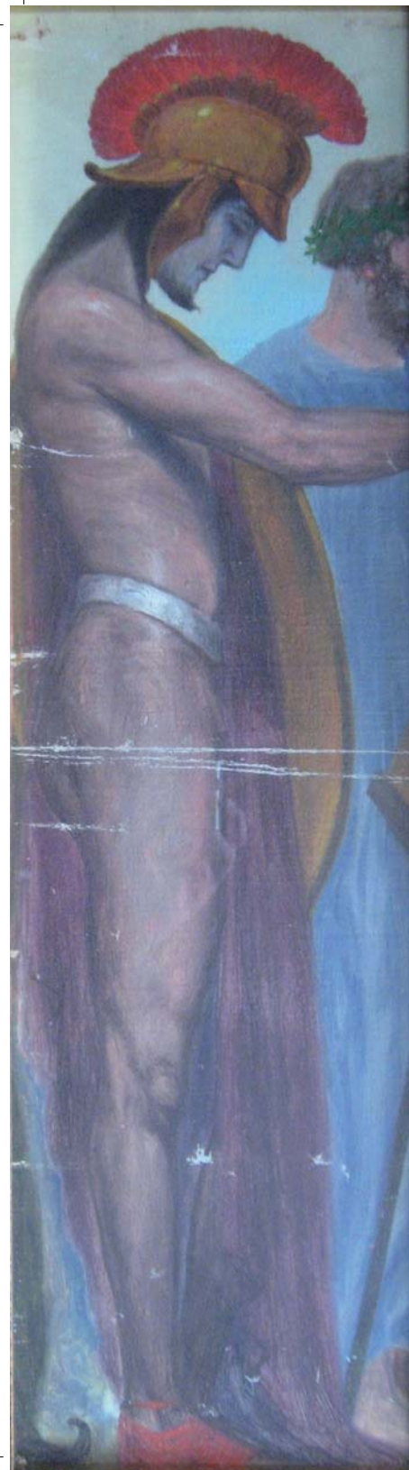
Fragmento de decorado no xardín da casa de San Roque da autoría de Camilo Díaz Balduino