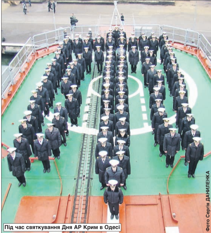
Під час святкування Дня АР Крим в Одесі