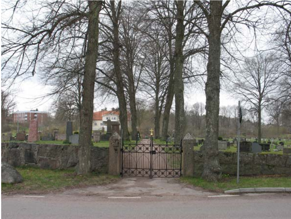
Ingång till Gamla B, med den äldsta delen till vänster.