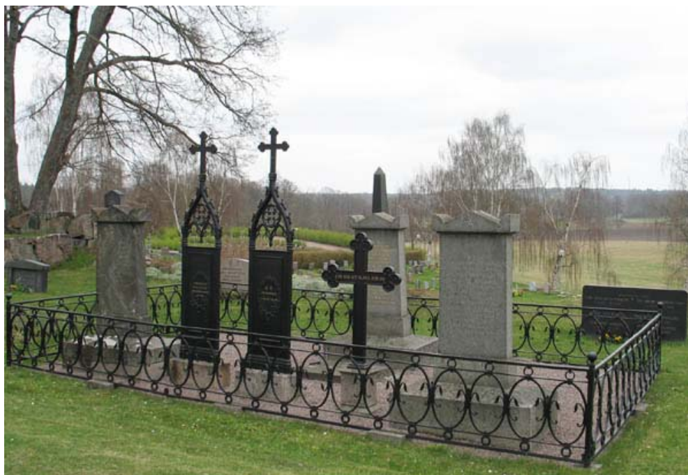
Den Cederbaumska – Hultenheimska gravplatsen sydost om kyrkan. Marmorstenen daterad 1835 syns längst till vänster i bild. (KI Döderhult kyrkog 051)

gravplatsen finns ett järnstaket. Öster om koret finns ägarna till Marieholms gård, familjen Wijkströms, stora familjegrav inom kraftig stenram.