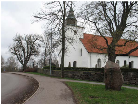
Kyrkan mot nordost med gamla kyrkogården. Minnsten över första skolan i Döderhult syns i förgrunden.