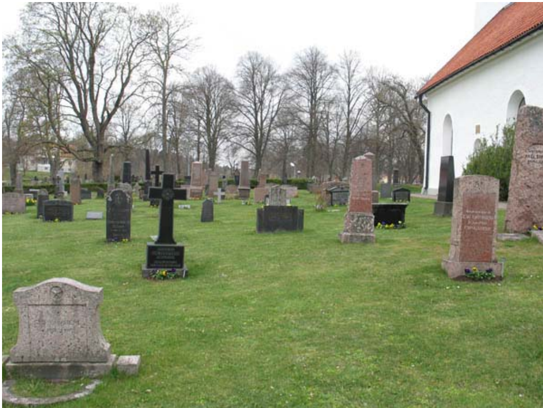
Gravsättningsområdet söder om kyrkan. Olika typer av vårdar. (KI Döderhult kyrkog 052)