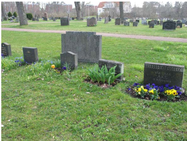
De små gravstenarna markerar barngravar av vilka finns en koncentration i kvarter 5. Notera skillnaden i storlek mot familjegravvårdarna som vetter mot grusgången. (KI Döderhult kyrkogård 125)

I Kvarter 4 är de äldsta gravstenarna daterade till 1920-talets början. Linjegravssystemet kan följas i ordningsföljd i raderna under 1920-30-talen. De äldsta familjegravarna är från 1930-talet. I kvarter 5 är linjegravarna från 1938 och fortsätter in på 1950-talet. Familjegravarna är mycket blandade i ålder från sent 1930-tal och framåt. I båda kvarteren finns rester av stenramar som tyder på att åtminstone områdets östra del varit grusbeklädd. I den västra delen av kvarter 5 finns barngravar i en samling från 1940-talet och framåt. Framförallt bland familjegravarna finns en del inskriptioner som anger den dödes yrke såsom trädgårdsmästare, rektor, rusthållare, lantbrukare, tullförvaltare, kvartersman m fl. Ortnamn anges på såväl familjegravar som linjegravar. I området finns till synes många lediga platser.