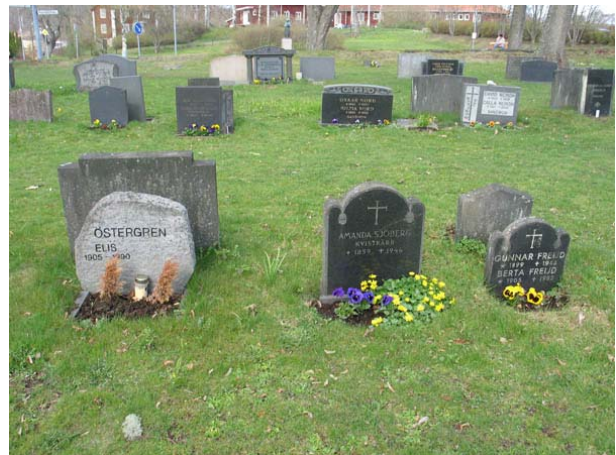
Kvarter 5 mot öster. Tidstypiska linjegravvårdar från 1946 av svart granit tillsammans med en ny gravsten i typisk 1990-talsutförande. (KI Döderhult kyrkog 122)