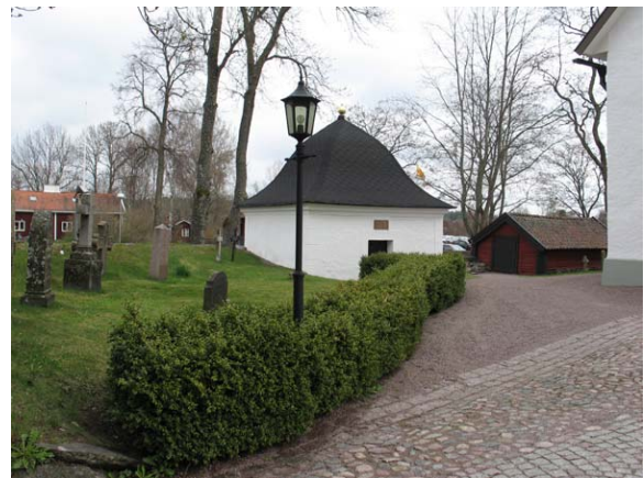
Kyrkogården nordväst om kyrkan, med gravkor och redskapsbod. (KI Döderhult kyrkog 021)