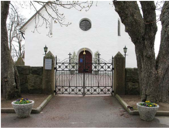
Gamla kyrkogårdens ingång i väster. (KI Hultsfred kyrkog 007)

Från kyrkogårdens huvudingång finns en bred, grusbelagd gång som leder till torningången och vidare längs kyrkans långsidor. Framför torningången är gångens mittparti lagt med kullersten, smågatsten och storgatsten.