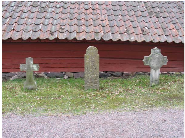
Musealt uppställda vårdar av sandsten och kalksten vid den lilla förrådsbyggnaden norr om kyrkan. Alla tre vårdar har markerat barngravar. (KI Döderhult kyrkog 029)