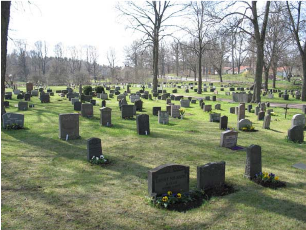
Kvarter 4 mot nordväst. Här syns det gamla linjegravsområdet, med bitvis mycket tätt placerade vårdar. (KI Döderhult kyrkog 088)

placerade i gräs utan annan ordnad vegetation än alléträden längs gångarna. I kvarter 4 är uppdelningen mellan köpta gravplatser i öster och gamla linjegravplatser i väster ännu tydlig. Förhållandet finns även i kvarter 5 där familjegravarna placerats som "ramar" kring två områden med linjegravar i mitten.