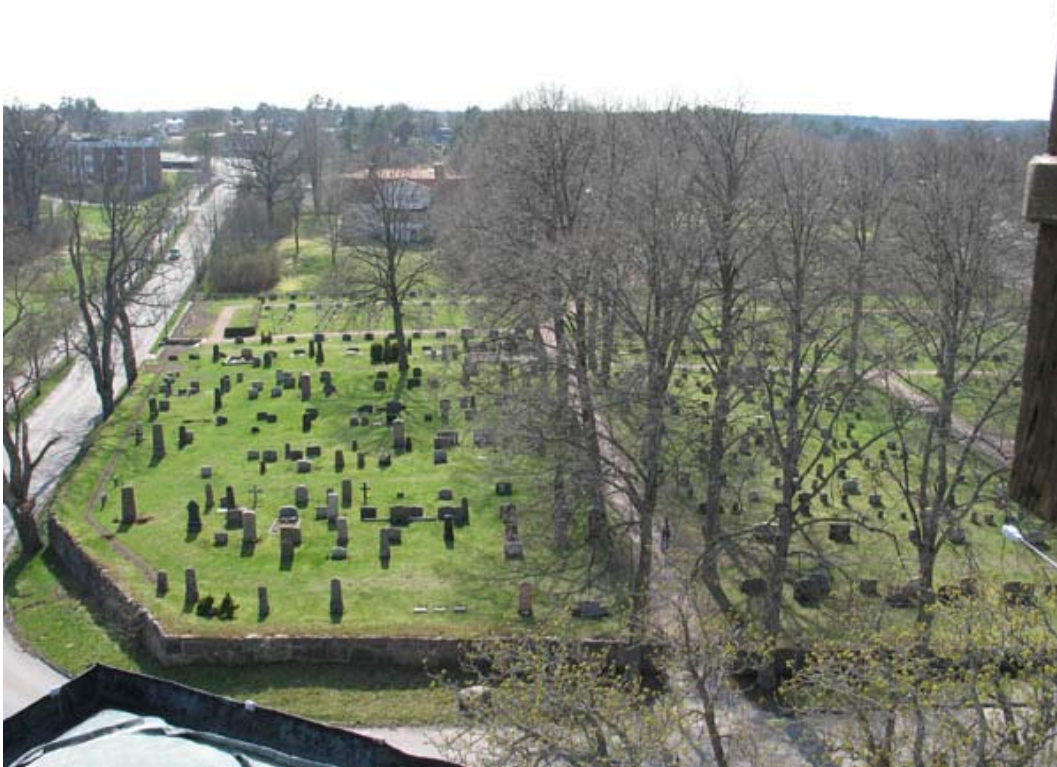
Gamla B mot väster. Kvarter 3 till väster. Notera alléerna och det strikta gångsystemet samt avsaknaden av gångar inne i kvarteren. (KI Döderhult kyrkog 100)

Utanför kyrkogårdens östra mur samt längs den östra delen av de norra och södra murarna finns stora lindar planterade. Längs kyrkogårdens två dominanta grusgångar finns alléer av lindar. Innanför kyrkogårdsmurens södra del finns en nyplanterad måbärshäck. Längst i väster finns en häck av oxel som omgärdning. I den västra delen av området är oxlar planterade i två norr-söder löpande rader. Här finns också ett par häckar av tuja.