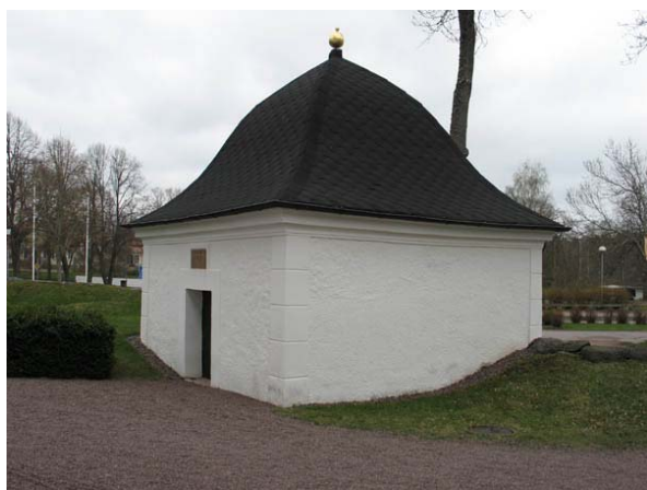
Rudbeckska gravkoret uppfört 1827. (KI Döderhult kyrkog 027)

Redskapsboden eller materialboden från 1700-talets början är byggd i liggtimmer och har enkupigt lertegeltak. Boden ska ha rödfärgats på 1850-talet och fick därefter nytt tegeltak som togs från sockenstugan 1866. Boden används ännu för förvaring.