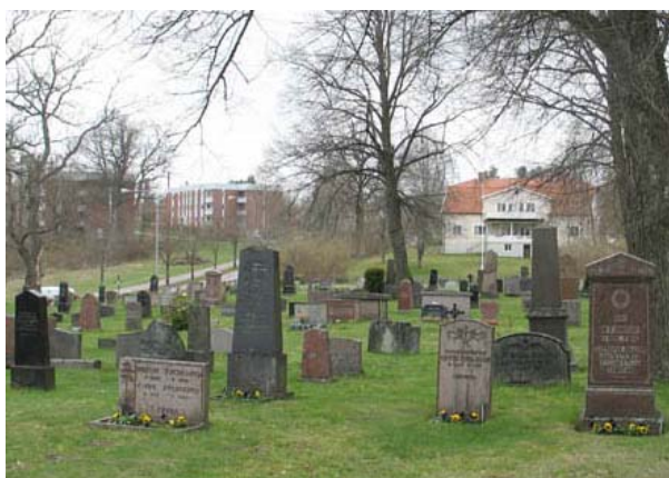
Kvarter 3 mot väster. Notera de många höga och stora vårdarna. (KI Döderhult kyrkog 059)

Kvarter 3 ligger i sydost och är den äldsta delen på Gamla B. Kvarteret rymmer omkring 160 gravplatser och avgränsas av kyrkogårdsmur mot öster och söder och av grusgång mot norr. Mot väster tar kvarter 1 vid, utan någon egentlig avgränsning. Gravvårdarna står i rader placerade i gräsmattan. Vissa rader har vårdar vända mot öster, andra mot väster. Den västligaste raden av kvarter 4 rymmer omkring 20 gravplatser och ingick i det område som utgjorde Gamla B i slutet av 1800-talet.