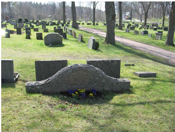
Kvarter 4 mot väster. Här kan man se hur de större familjegravarna ligger i områdets utkant. Den bred gravstenen från 1900-talets mitt är ett tecken på att området tidigare varit belagt med grus. Sådana stenar omgavs vanligen av stenram (KI Döderhult kyrkog 090)