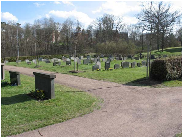
Kvarter 1 med tätt ställda rader av linjegravvårdar omgärdade av en tujahäck. (KI Döderhult kyrkog 143)

De två alléerna som är så markanta på den övriga kyrkogården finns inte här, vilket fungerar som en extra markör för att området är senare tillkommet. Karaktäristiskt är här i stället den låga profilen med låga gravstenar och låga häckar. Några relativt nyplanterade oxlar finns dock längs gångarna. Området ger ett ordnat och strikt intryck. I kvarter 1 är familjegravplatser ordnade längs kvarterets utkant, längs grusgångarna. I mitten finns linjegravplatser från främst 1950-talet, omgärdade av en tujahäck. Precis som i kvarter 4 och 5 är uppdelningen tydlig mellan familjegravvårdarna och linjegravvårdarna, både vad gäller placering och utformning. I kvarter 2 finns familjegravvårdar från främst 1950- 60-talen placerade i strikta rader.