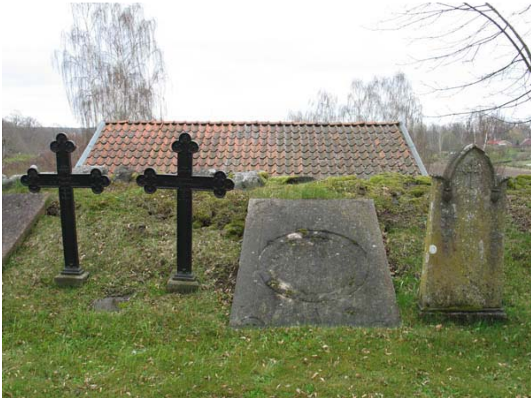
Några av de musealt uppställda vårdar nordost om koret. Här syns två gjutjärnskors, en häll av kalksten och en sandstensvård med nygotiska drag. (KI Döderhult kyrkog 036)

Många av gravplatserna har brukats av samma familj under lång tid. Till dessa hör exempelvis den kulturhistoriskt intressanta gravplatsen över familjen Cederbaum-Hultenheim som bl a var ägare till Fredriksbergs herrgård under en period. Gravplatsen har använts åtminstone från 1835 till 1966. Familjens historia i socknen har ett lokalhistoriskt värde och platsen rymmer också flera ålderdomliga och ovanliga gravvårdar. Till dessa hör en marmorvård över Brukspatronen Cederbarum, d. 1835 och två nygotiska gjutjärnsvårdar från 1860-talet. Kring