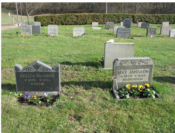
Kvarter 1 med tidstypiska linjegravvårdar. Här daterade 1955. (KI Döderhult kyrkog 146)