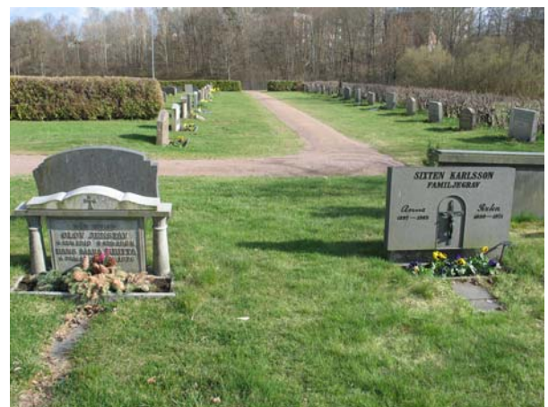
Kvarter 2 med familjegravvårdar. Här en i typisk klassicerande utförande till vänster och en mer modernt enkel, men med bronsstatyett, till höger. (KI Döderhult kyrkog 138)