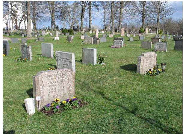
Kvarter 2 med enhetliga familjegravvårdar i ljusa stenslag. (KI Döderhult kyrkog 141)