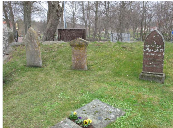
Innanför kyrkogårdsingången nordväst om tornet. Gravvårdar av sandsten till väster och av granit till höger. De vänstra är daterade till 1870 (Hemmansägare Carlsson) respektive 1850-tal. (KI Döderhult kyrkog 026)