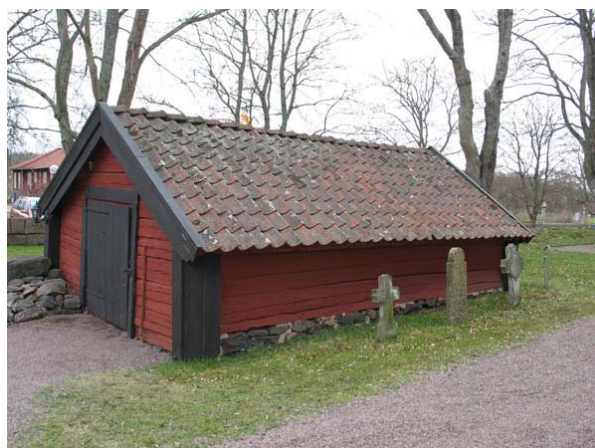
Redskapsboden med ålderdomlig karaktär, troligen uppförd vid 1700-talets början. (KI Döderhult kyrkog 028)