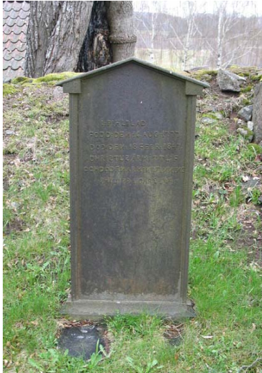
En av de musealt uppställda vårdarna öster om kyrkans kor. En gjutjärnsvård av ovanligt slag över I. Pihlblad, född 1777, död 1847. (KI Döderhult kyrkog 035)