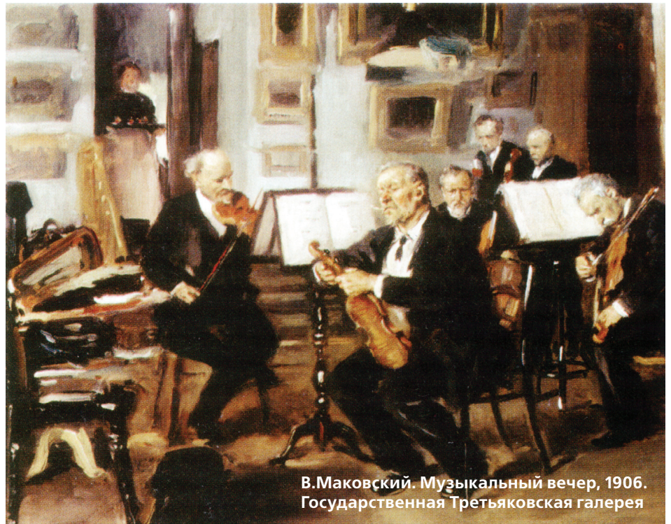
В.Маковский. Музыкальный вечер, 1906. Государственная Третьяковская галерея