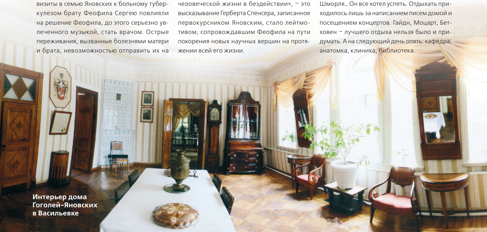
Интерьер дома Гоголей-Яновских в Васильевке