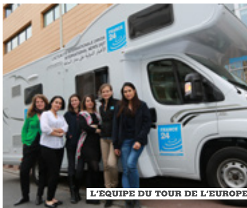
L'ÉQUIPE DU TOUR DE L'EUROPE